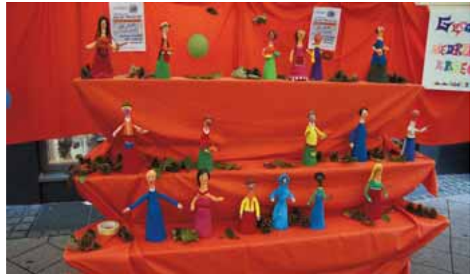
Das handelnde Gewerbe aus Pappmaché.