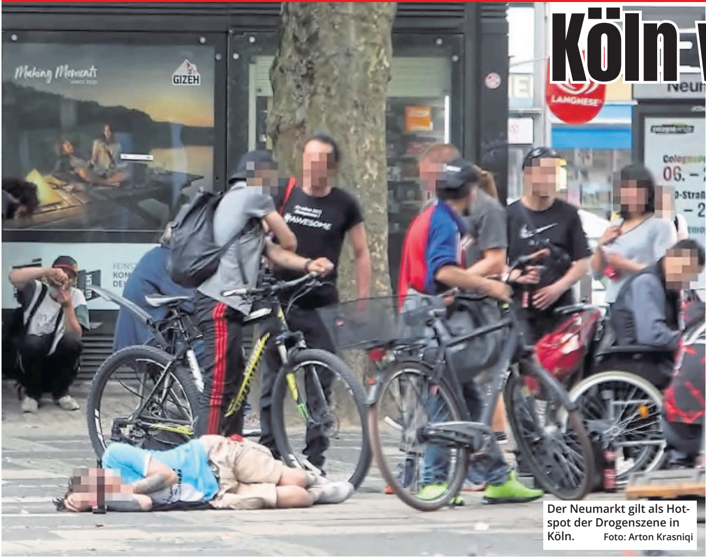
Der Neumarkt gilt als Hot-spot der Drogenszene in Köln.