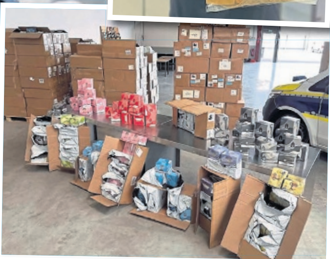
Egal ob illegaler Goldschmuck (Foto oben) oder Vapes und E-Liquids (u.), die Funde des Zolls waren vielfältig.

dung, Mobiltelefone, gefährliches Kinderspielzeug aber auch ein Großaufgriff mit 23.000 Kilogramm gefälschtem Waschmittel aus dem Februar 2024“, erklärt Frank Denner. Besonders bemerkenswert