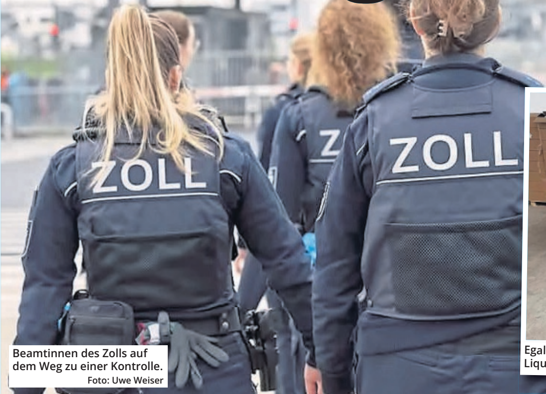
Beamtinnen des Zolls auf dem Weg zu einer Kontrolle.

amt Köln begrüßen zu dürfen.“ An den Gesamteinnahmen von fast fünf Milliarden Euro, hatte die Einfuhrumsatzsteuer, welche beim Import von Waren erhoben wird, mit rund vier Milliarden Euro den größten Anteil. Rund 577 Millionen Euro hat der Kölner Zoll an Verbrauchs- und Verkehrssteuern erhoben. Die Anzahl der Zollanmeldungen hat sich im Vergleich zum Vorjahr von 10,3 Millionen auf 10,5 Millionen leicht erhöht. Zudem wurden im vergangenen Jahr durch die Zollämter Bonn, Gummersbach, Köln-West, Köln-Wahn und zum größten Teil beim Zollamt Flughafen Köln/Bonn Waren im Wert von rund 22 Millionen Euro beschlagnahmt. „Hinter den mehr als 1.100 Aufgriffen stecken rund 376.000 gefälschte Taschen, Uhren, Schuhe, Brillen, Beklei-