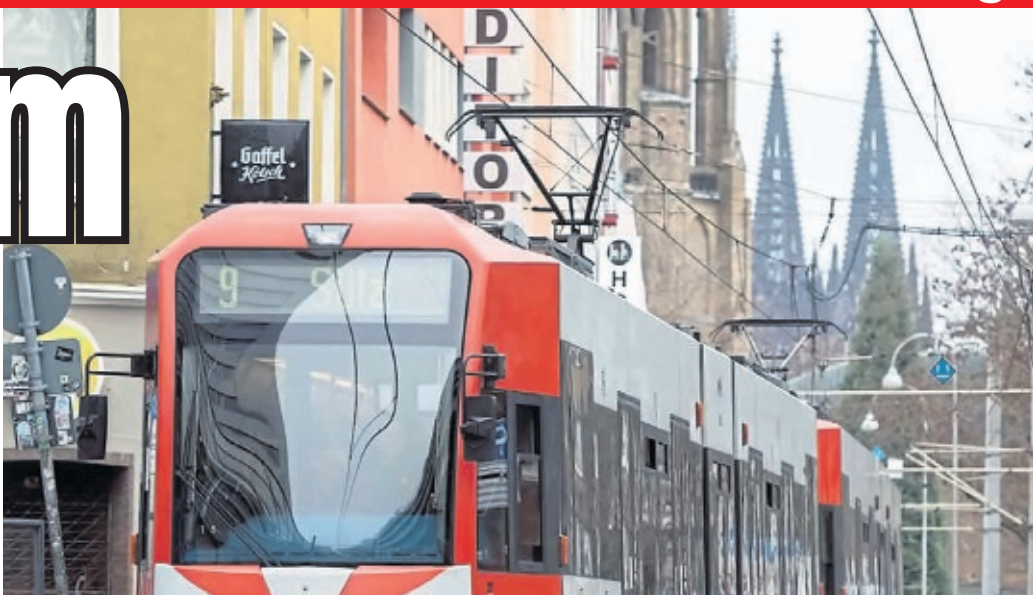
Eine Straßenbahn der Linie 9. Vor eine solche Bahn soll der Angeklagte (Foto r. mit seinen Verteidigern) einen Mann gestoßen haben.

„Wir können am Ende nicht ausschließen, dass sich der Angeklagte auch einfach den besten Platz zum Einsteigen sichern wollte“, so der Staatsanwalt. Auch deshalb könnte der Mann zum Bahnsteig gerannt sein und noch einen Bogen um weitere wartende Fahr-