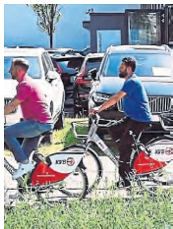
27,2 Mio. Kilometer wurden mit den KVB-Bike bereits „erradelt“

Insgesamt 16 Millionen Ausleihen konnten in den vergangenen zehn Jahren verzeichnet werden. Bisher wurde jedes Jahr die vorjährige Nachfrage übertroffen – die Nutzer haben somit jedes Jahr einen neuen Nachfrager rekord eingefahren. Aktuell sind 365.914 Nutzer registriert. Das entspricht etwa einem Drittel der Einwohnerschaft Kölns. Bei einer über die Jahre konstant gebliebenen durchschnittlichen Fahrtweite von 1,7 Kilometer