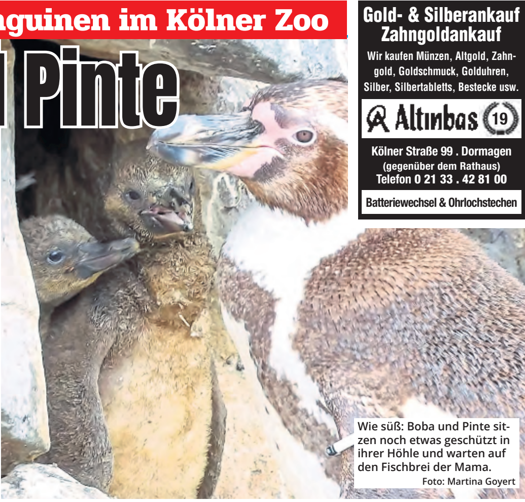
Wie süß: Boba und Pinte sitzen noch etwas geschützt in ihrer Höhle und warten auf den Fischbrei der Mama.

„Humboldt-Pinguine sind monogam und behalten ihren Partner eigentlich für immer. Dadurch ist die erfolgreiche Zucht dann eingebrochen.“ Heck ist sich sicher, dass mit den Erfahrungen, die jetzt gemacht wurden, auch im nächsten Jahr wieder eine erfolgreiche Aufzucht möglich sein wird. (lbo.)