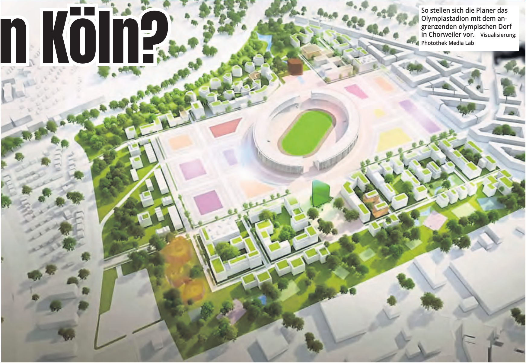
So stellen sich die Planer das Olympiastadion mit dem angrenzenden olympischen Dorf in Chorweiler vor. Visualisierung: Photothek Media Lab

Köln hätte zudem gute Chancen, das Herz der NRW-Spiele zu werden. Die im Stadtbezirk Chorweiler liegende Fläche „Kreuzfeld“, die ohnehin ein