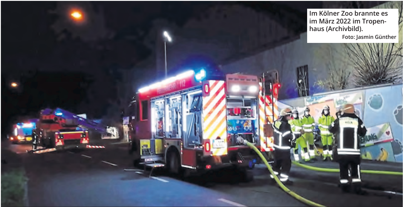
Im Kölner Zoo brannte es im März 2022 im Tropenhaus (Archivbild).