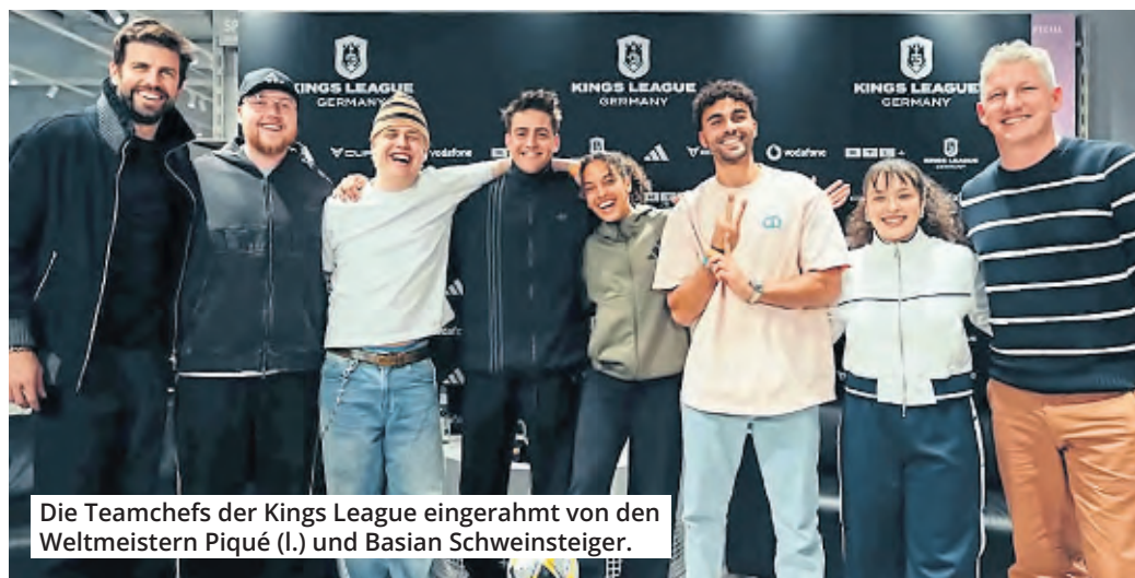
Die Teamchefs der Kings League eingerahmt von den Weltmeistern Piqué (l.) und Bastian Schweinsteiger.

halten haben. Die junge Generation wird traditionellen Fußball am Fernseher verfolgen und parallel die Kings League am Tablet. Wir haben das Konzept entwickelt, den traditionellen Fußball mit verrückten Regeln und Content Creators zu kombinieren. Die neue digitale Welt, in der vieles über Streaming abläuft, braucht solche Formate“, so Piqué gegenüber EXPRESS.