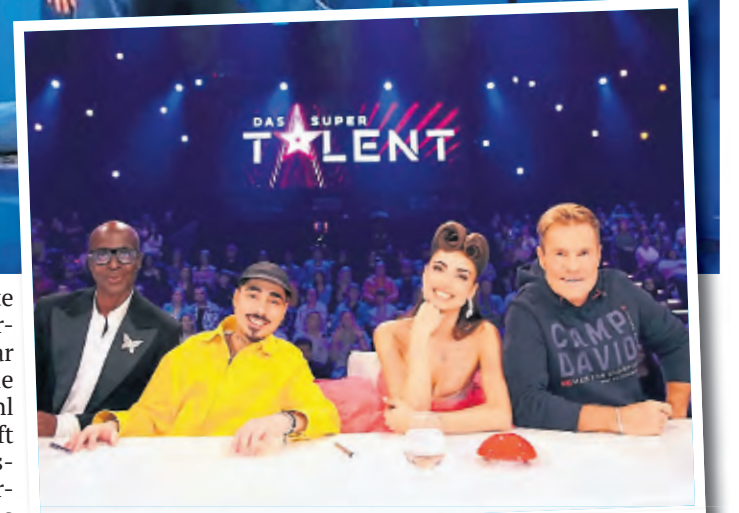
Die Jury von „Das Supertalent“ besteht in der neuen Staffel aus Bruce Darnell, Tony Bauer, Ekaterina Leonova und Dieter Bohlen (v.l.).