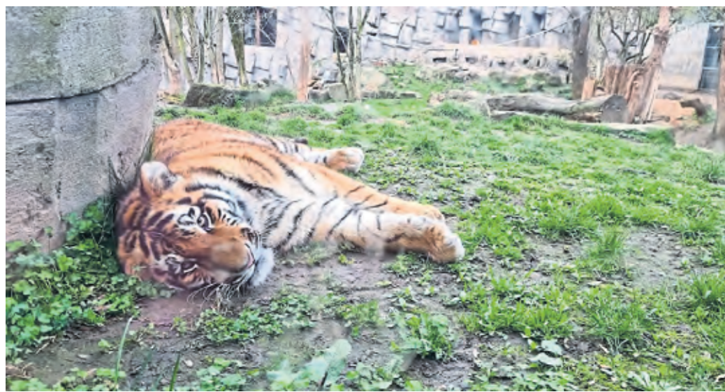
Ungezoomt: Mit etwas Glück können die Jungtiger aus nächster Nähe beobachtet werden.

Auch in den Osterferien gibt es in vielen Kölner Museen wieder Angebote für die ganze Familie. Bei der Veranstaltung „Zurück in die Steinzeit“ des Römisch-Germanischen Museums können Kinder im Alter von sechs bis zehn Jahren am 14. April von 11 bis 14 Uhr beispielsweise das Töpfern lernen. Jede Menge über Porzellan dürfen Kinder des gleichen Alters bereits einen Tag später von 11 bis 14 Uhr im Museum für Ostasiatische Kunst lernen. Außerdem interessant: der Workshop „Was verbindet uns? Vater Rhein“ – seine Schiffe, Sagen und Legenden“ im Kölnischen Stadtmuseum (16. April, 11 bis 14 Uhr) sowie ein Workshop zum Thema Spielzeug-Recycling im Rautenstrauch-Joest-Museum (17. April, 11 bis 14 Uhr).