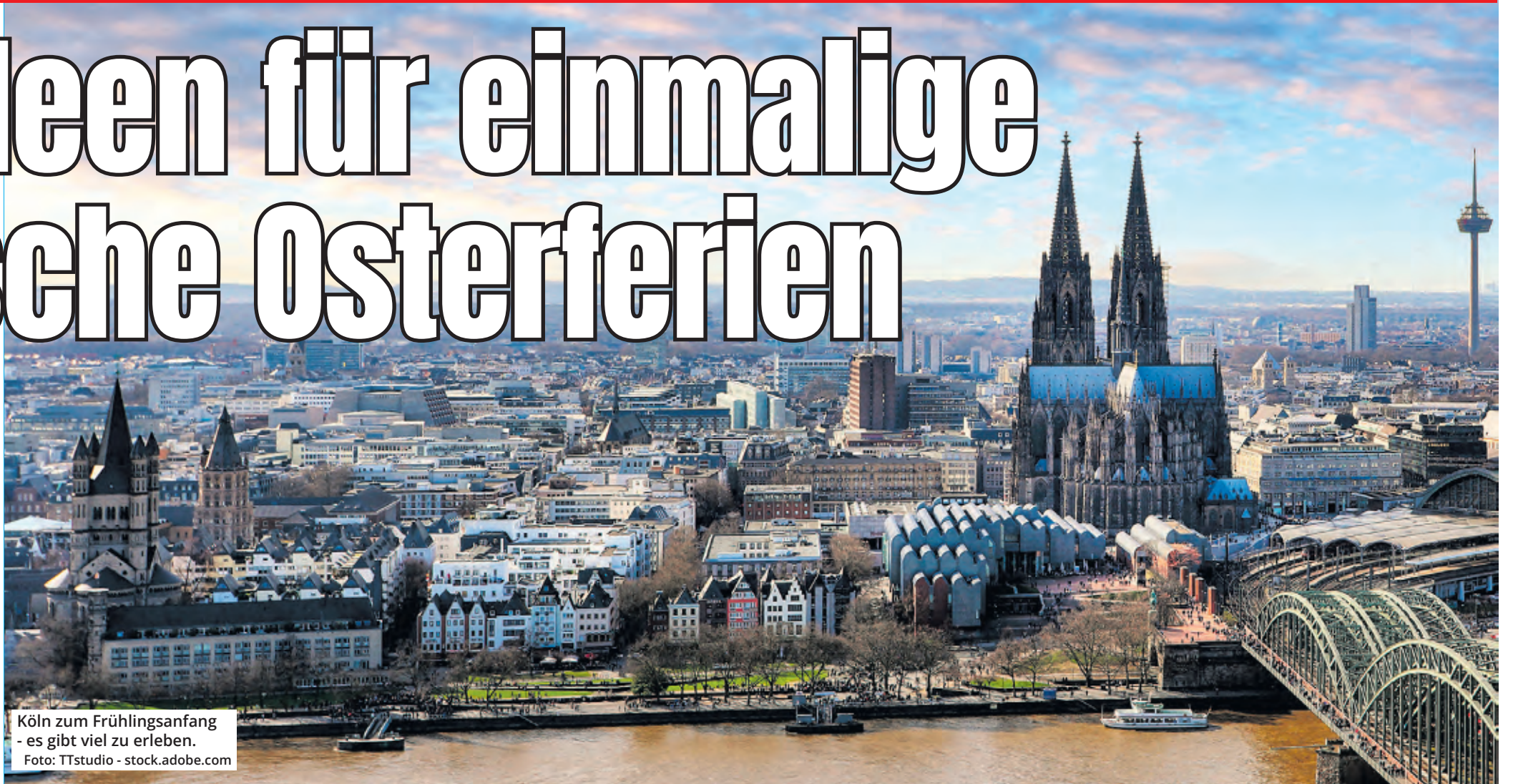
Köln zum Frühlingsanfang - es gibt viel zu erleben.

Nicht nur vom Flughafen aus lässt sich die Welt entdecken. Auch vom Kölner Hauptbahnhof können viele europäische Metropolen innerhalb von kürzester Zeit erreicht werden. So beträgt die Fahrzeit nach Amsterdam, Brüssel oder Paris weniger als dreieinhalb Stunden. Außerdem interessant: Mit dem Deutschlandticket lässt sich die ganze Republik für 58 Euro mit der Bahn entdecken. Ein wenig Zeit sollte dabei aber eingeplant werden, da Ticketinhaber lediglich Nahverkehrszüge nutzen dürfen.