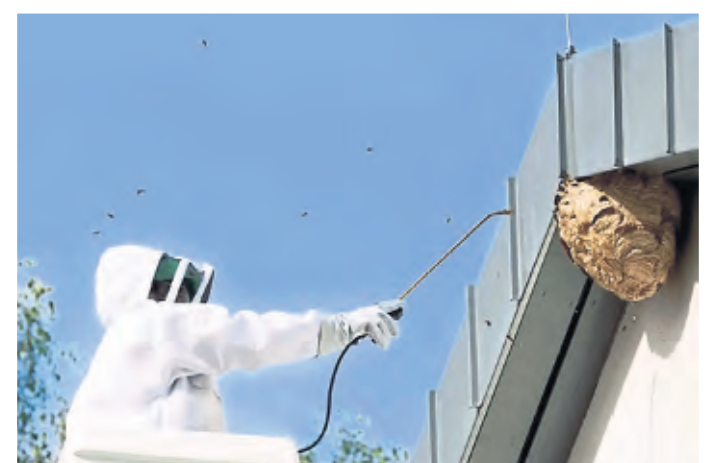
Die Tiere bauen große Nester, die nur von Experten entfernt werden sollten.

Eines habe sich auf dem Parkplatz des Klinikgeländes Holweide befunden, zwei Sekundärnester fanden sich in Chorweiler und jeweils eins in Deutz, Dünnwald, Riehl und Weiden, erzählt er. „Zwei weitere bekannte Nester in der Bayer-Siedlung und in Dellbrück wurden aufgrund des späten Jahreszeitpunktes nicht mehr entfernt.“ Das größte und mit Ende November späteste Nest habe sich in Deutz in der Teutonenstraße befunden. (iri)