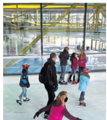
Planschen und Eislaufen: Im Lentpark geht beides.

Köln. Wer über die Osterfeiertage schwimmen oder saunieren möchte, sollte einen Blick auf die Öffnungszeiten der KölnBäder werfen. Während einige von ihnen regulär geöffnet haben, befinden sich andere in der Revision oder bleiben an den Feiertagen geschlossen. An den Osterfeiertagen haben folgende Bäder geöffnet: Agrippabad und -sauna sowie Ossendorfbad und -sauna sind täglich von 9 bis 21 Uhr offen, AgrippaFit und RochusFit von 9 Uhr bis 20 Uhr. Im Lentpark steht die Badelandschaft an allen Tagen von 9 bis 21 Uhr zur Verfügung. Die Badelandschaft im Stadionbad ist ebenso von 9 bis 21 Uhr geöffnet, die Saunalandschaft von 10 bis 21 Uhr. Zündorfbad und Groov-Sauna haben an allen Tagen von 10 bis 21 Uhr geöffnet.