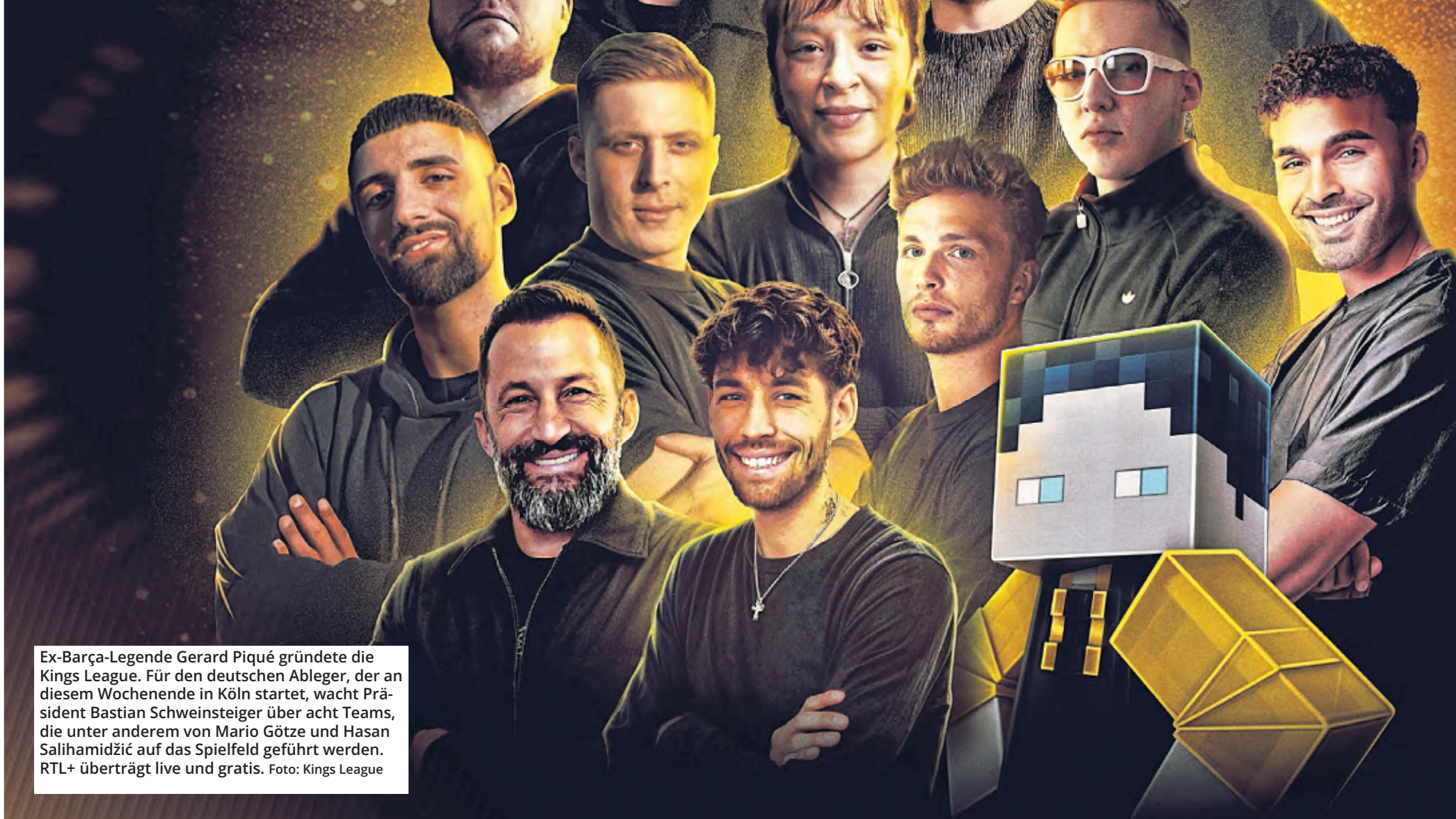
Ex-Barça-Legende Gerard Piqué gründete die Kings League. Für den deutschen Ableger, der an diesem Wochenende in Köln startet, wacht Präsident Bastian Schweinsteiger über acht Teams, die unter anderem von Mario Götze und Hasan Salihamidžić auf das Spielfeld geführt werden. RTL+ überträgt live und gratis.