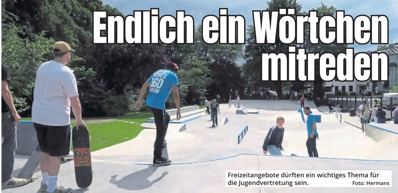
Freizeitangebote dürften ein wichtiges Thema für die Jugendvertretung sein.