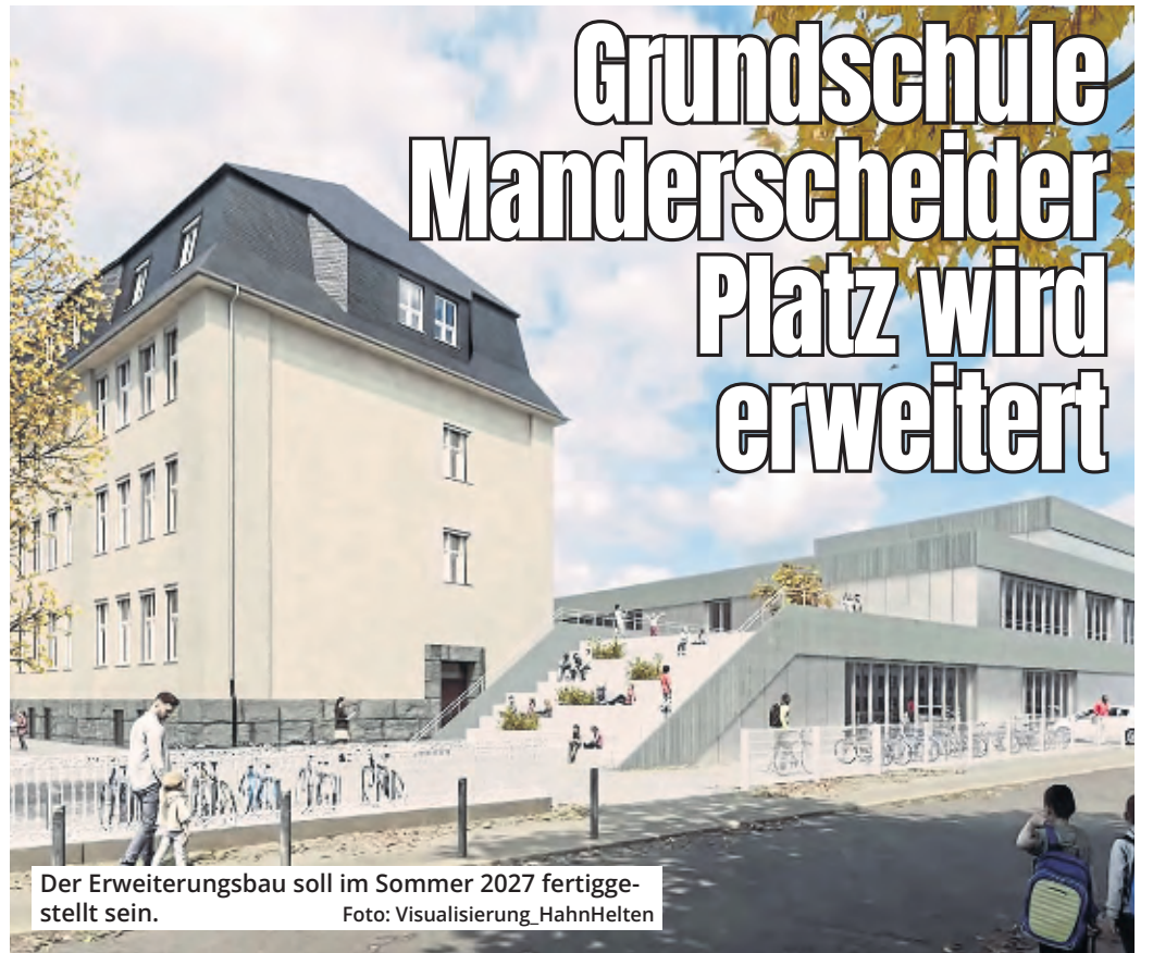
Der Erweiterungsbau soll im Sommer 2027 fertiggestellt sein.

Weiden. Jeder kennt Banksy, aber niemand weiß, wer er ist. Seine Werke sind weltberühmt, doch seine Identität ist bis heute unbekannt. Banksy nutzt Wände, um Gedanken auszudrücken, die Welt zu verändern und die kraftvolle Botschaft seiner Kunst zu verbreiten. Damit wurde er zur Ikone der Street-Art. Reproduktionen des jetzt schon legendären Künstlers sind im Rhein-Center ausgestellt. Die nicht autorisierte Ausstellung „Banksy - Gesetzlose Kunst“ ist noch bis zum 3. Juni 2025 im ersten Obergeschoss zu besichtigen. Die Ausstellung wird zudem durch räumliche Installationen und Multimedia ergänzt. „Girl with Balloon“ symbolisiert verlorene Unschuld und Hoffnung. „Pulp Fiction“ entlarvt mit Banksys gewohnt scharfem Blick die Absurdität von Gewalt und Konsumkultur. „Flower Thrower“ steht für friedlichen Protest gegen Krieg, während „Monkey Queen“ Monarchie und Personenkult aufs Korn nimmt. Der Eintritt zur Ausstellung ist kostenlos.