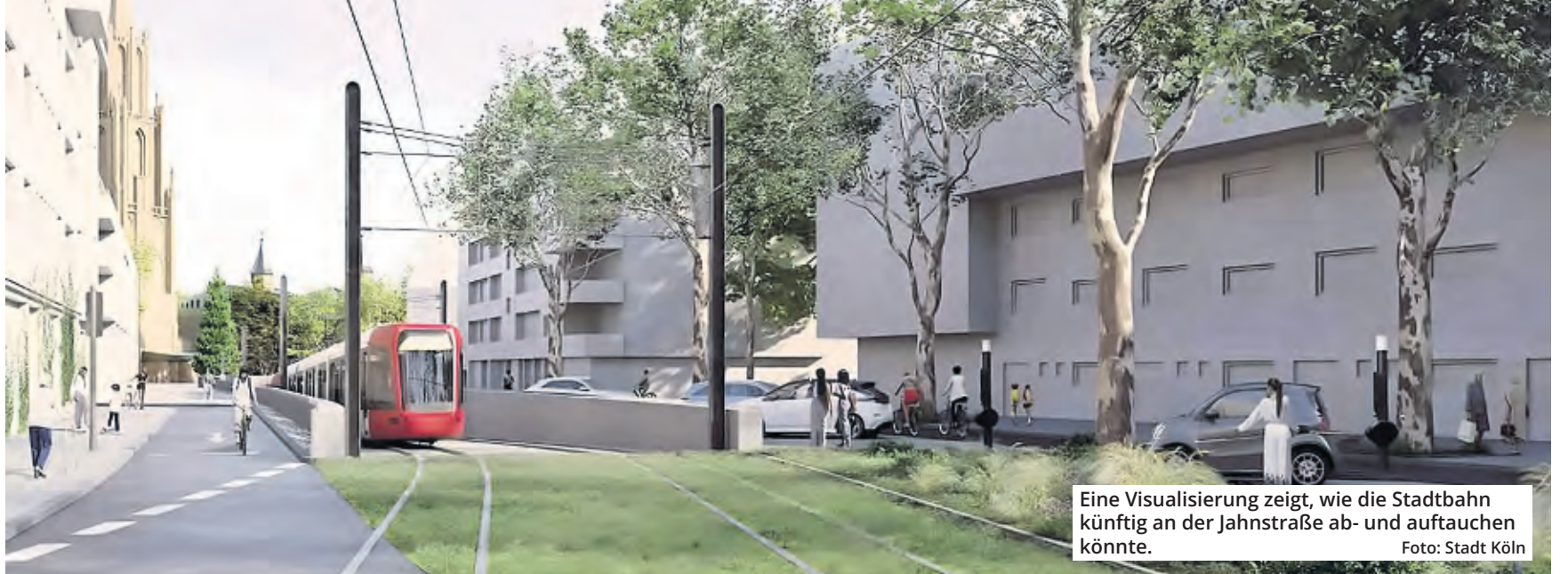
Eine Visualisierung zeigt, wie die Stadtbahn künftig an der Jahnstraße ab- und auftauchen könnte.

Nach vielen Jahren der Diskussion, nach etlichen Verzögerungen und Vertagungen hat der Stadtrat den Bau eines Tunnels für mehrere Stadtbahn-Linien zwischen Heumarkt und Aachener Weiher beschlossen. Die Grünen als Tunnelgegner wollen sich damit nicht abfinden, sprechen von Zufallsmehrheiten und fordern jetzt eine Bürgerbefragung.