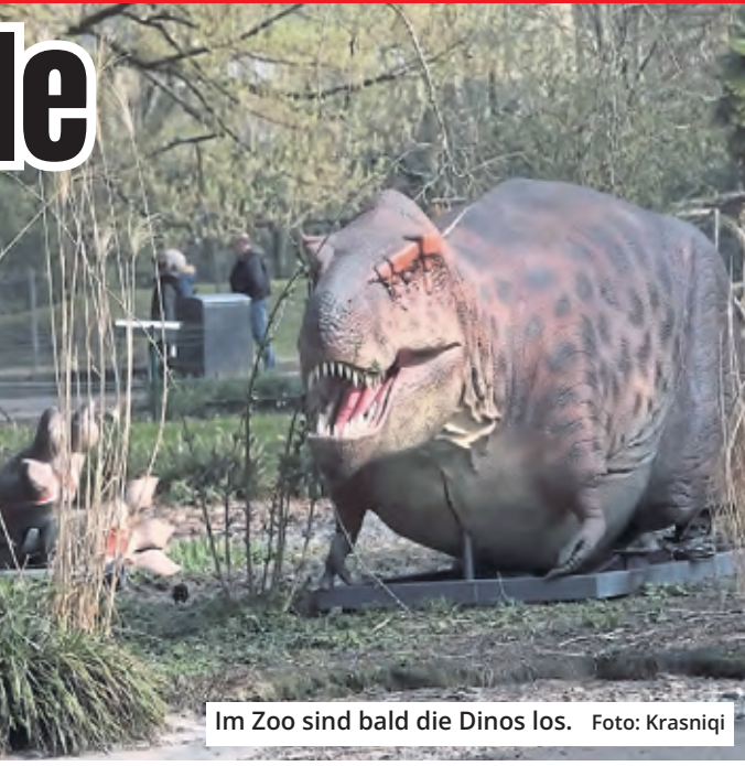
Im Zoo sind bald die Dinos los.