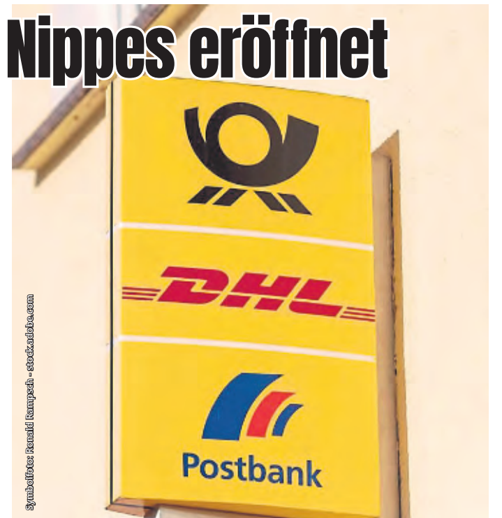
gebäude-kunst-kampfen - stockphoto.com

Unter www.deutschepost.de/standorte werden alle Standorte von Postfilialen und DHL angezeigt.