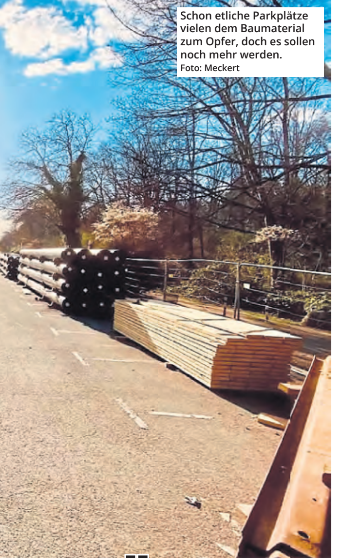
Schon etliche Parkplätze vielen dem Baumaterial zum Opfer, doch es sollen noch mehr werden.

Modeschmuck von damals, vergoldet oder versilbert, Zahngold, Echtschmuck, Bruch-Gold, Silber, altes Geld, alte und auch defekte Armbanduhren von Privat, Hausauflösung und Entrümpeln, kaufe ich gerne. Vintage An-&Verkauf, Frankfurter Str. 71, 51065 Köln. ☎ 0178-2915386