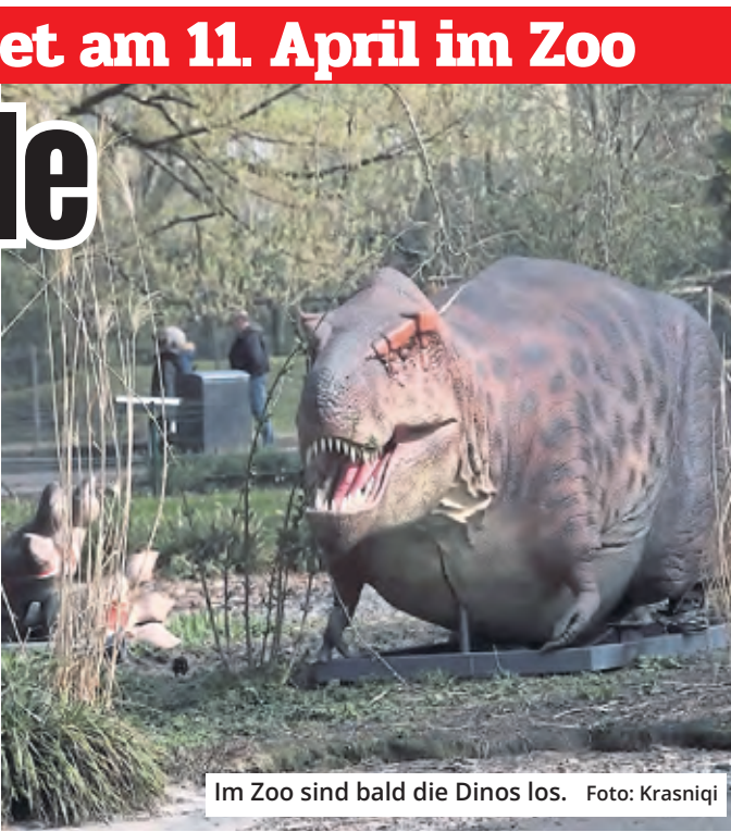
Im Zoo sind bald die Dinos los.