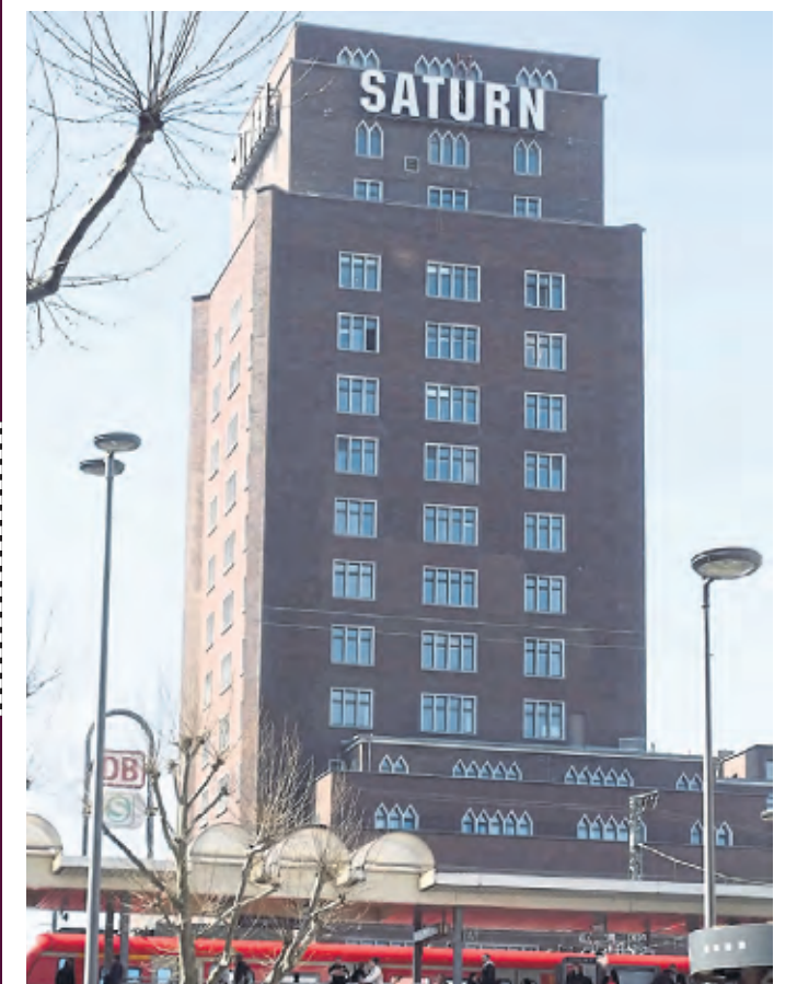
Das Gebäude befindet sich in der unmittelbaren Umgebung der Haltestelle Hansaring.