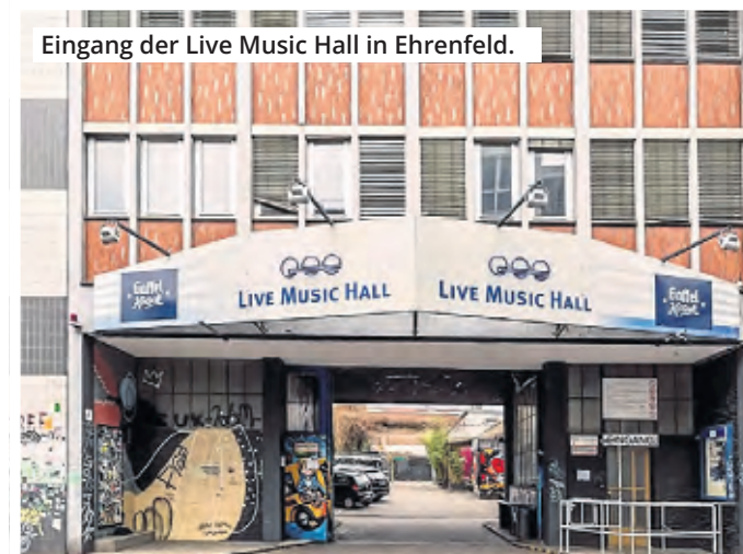
Eingang der Live Music Hall in Ehrenfeld.

zen. „Die haben Proviant dabei, wechseln sich ab. Ich habe ihnen schon versprochen, dass sie auf jeden Fall in die erste Reihe kommen, sie sollen ruhig nach Hause gehen. Aber nichts zu machen“, sagt Pick. Der hat für so manchen Fan schon den Hof der LMH geöffnet, damit sie auf die Toilette gehen können.