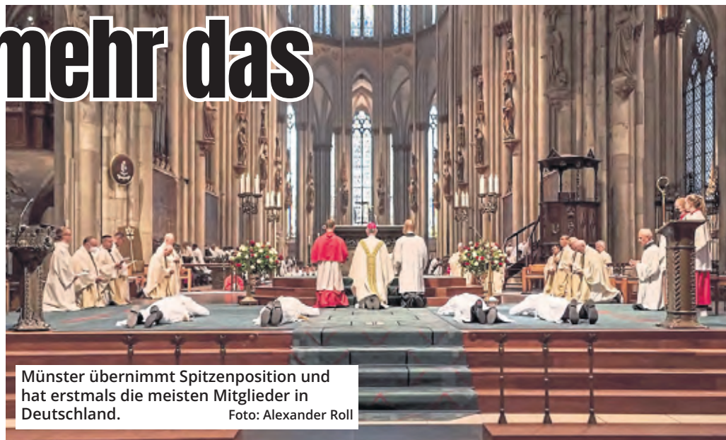
Münster übernimmt Spitzenposition und hat erstmals die meisten Mitglieder in Deutschland.

Immerhin: Das Erzbistum Köln verzeichnete wie alle deutschen Diözesen wieder weniger Kirchenglieder: Waren es im Jahr 2023 noch 40.913, liegt der Wert für 2024 bei 28.979.