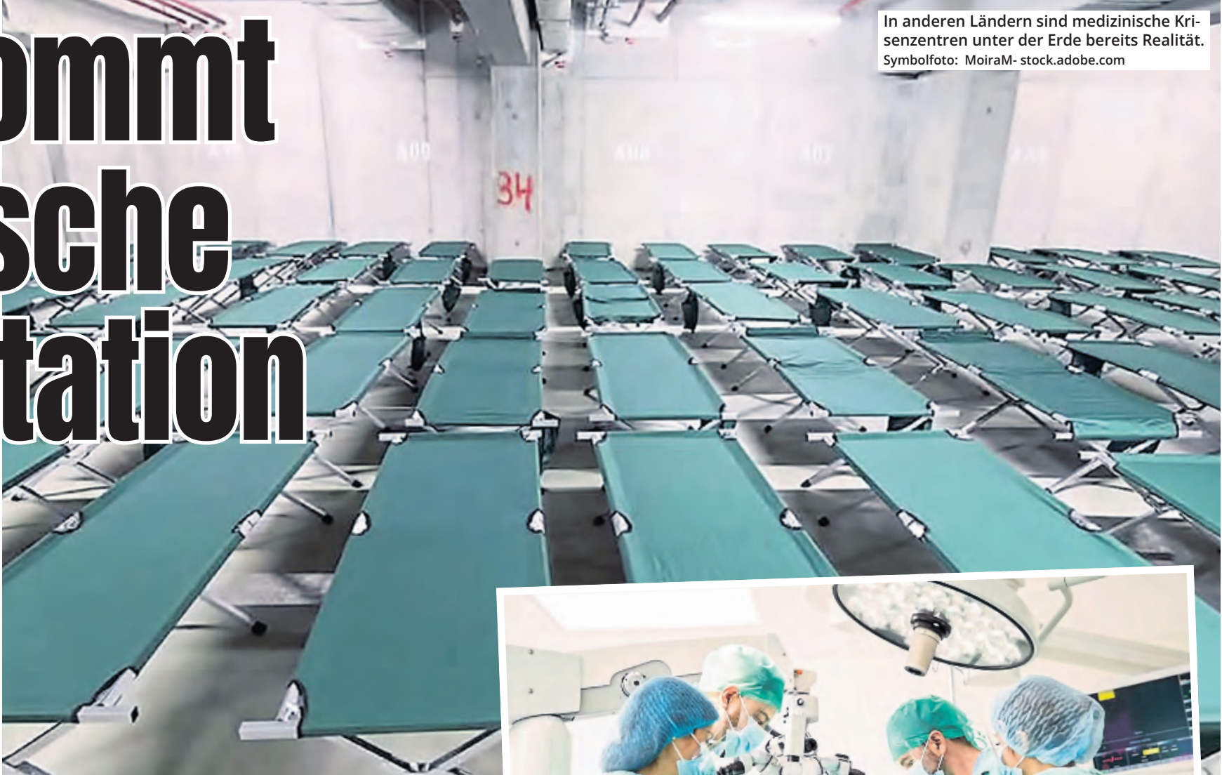
In anderen Ländern sind medizinische Krisenzentren unter der Erde bereits Realität.