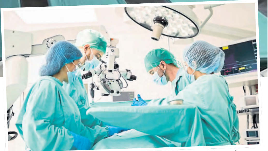
Auch Operationen müssen in einem Krisenzentrum bestmöglich durchgeführt werden können.

frage nicht äußern. Zumindest an der Uniklinik Köln verfolgt man ähnliche Gedanken wie in Merheim. So wies Professor Edgar Schömig, Vorsitzender der Uniklinik Köln, schon im Februar gegenüber dieser Zeitung auf die Notwendigkeit von Pop-up-Intensivstationen für den Fall einer kriegerischen Auseinandersetzung hin. Auch zusätzliches Geld sei für eine Bereitstellung eines solchen Notfallsystems nötig. „Die Maximalversorger müssen in die Lage versetzt werden, in Krisensituationen noch besser für die Menschen da sein zu können“, so Schömig.