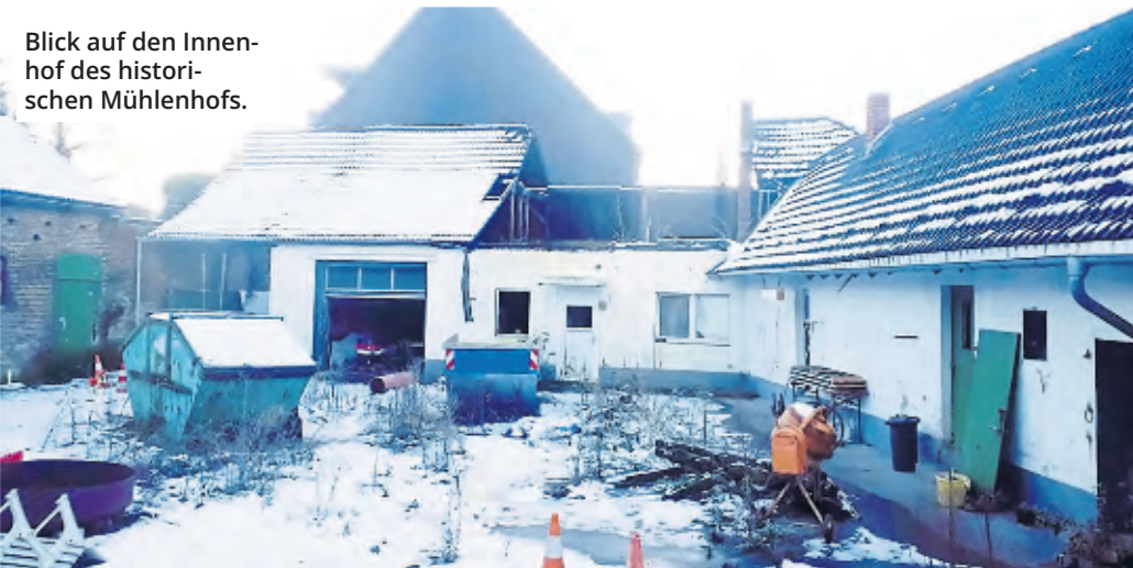
Blick auf den Innenhof des historischen Mühlenhofs.

Best diverse Förderanträge gestellt und Gutachten erstellen lassen, die für das Projekt erforderlich sind.