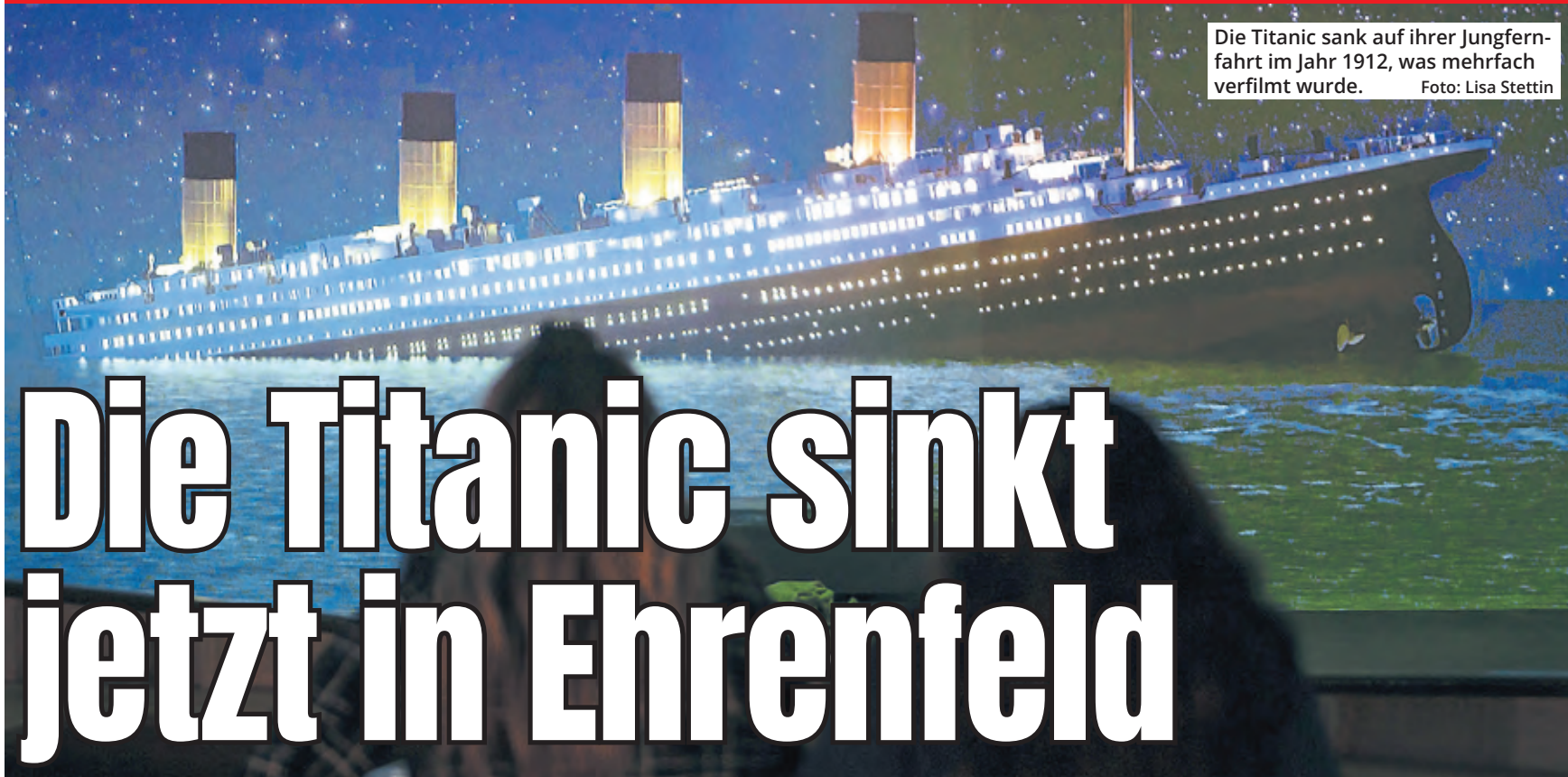
Die Titanic sank auf ihrer Jungfernfahrt im Jahr 1912, was mehrfach verfilmt wurde.