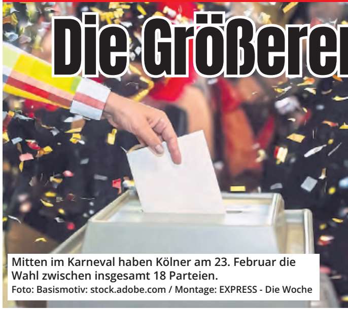
Mitten im Karneval haben Kölner am 23. Februar die Wahl zwischen insgesamt 18 Parteien.

Bald müssen in der Wahlkabine wieder lange Stimmzettel ausgeklappt werden, um seine Kreuzchen zu machen, obwohl - so zumindest die aktuellen Umfragen - nur sechs Parteien die Fünf-Prozent-Hürde knacken und in den Bundestag einziehen dürften. Grund für die dennoch langen Wahlscheine sind die Klein- und Kleinstparteien, die neben den Etablierten ebenfalls in NRW antreten. 18 Parteien stehen