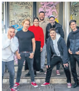
Bald Brauhaus-Besitzer: die Band Kasalla.