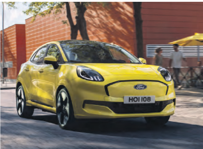
Puma E-Antrieb soll Fahrvergnügen stützen