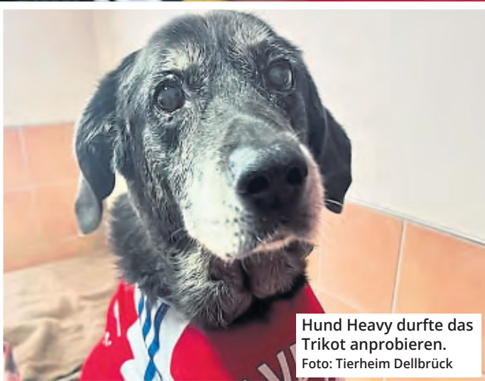
Hund Heavy durfte das Trikot anprobieren.

Das Jersey war dann nicht nur bei den Mitarbeitern das Objekt der Begierde: „Büro-Hund und Schwergewicht Heavy durfte es als Arsenal-Fan kurz zur Probe tragen, aber am Ende haben wir entschieden, dass es schön gerahmt einen Ehrenplatz bei uns am Empfang bekommen wird.“