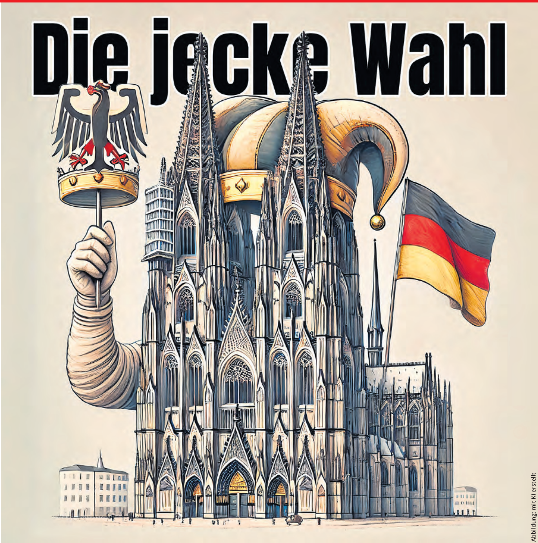
Abbildung: mit KI erstellt

An den anderen Direktwahlschaltern kann nur gewählt werden, wenn man im jeweiligen Wahlkreis gemeldet ist, montags bis freitags von 9 bis 17 Uhr: Wahlkreis 93, Kundenzentrum Rodenkirchen (Mannesmannstraße 10), Wahlkreis 94, Kundenzentrum Nippes (Neusser Straße 450) und Wahlkreis 100, Kundenzentrum Mülheim (Wiener Platz 2a). Der Wahlkreis ist auf der Vorderseite der Wahlbenachrichtigung vermerkt. Alternativ kann jeder seinen Wahlkreis online unter Angabe der Adresse abrufen.