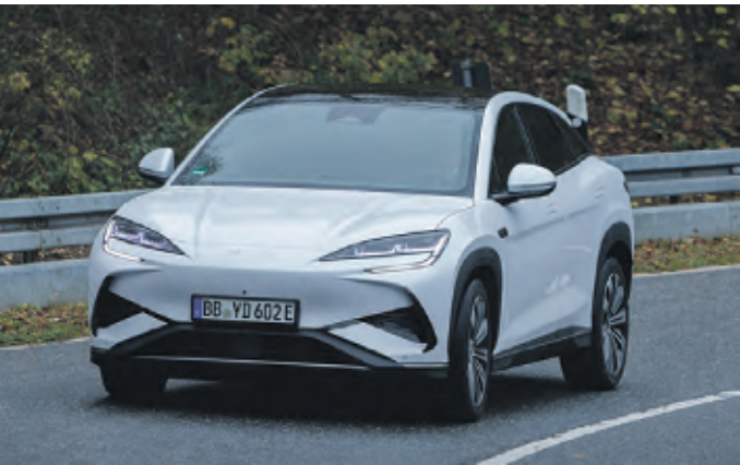
2025 steht im Zeichen neuer BYD-Modelle