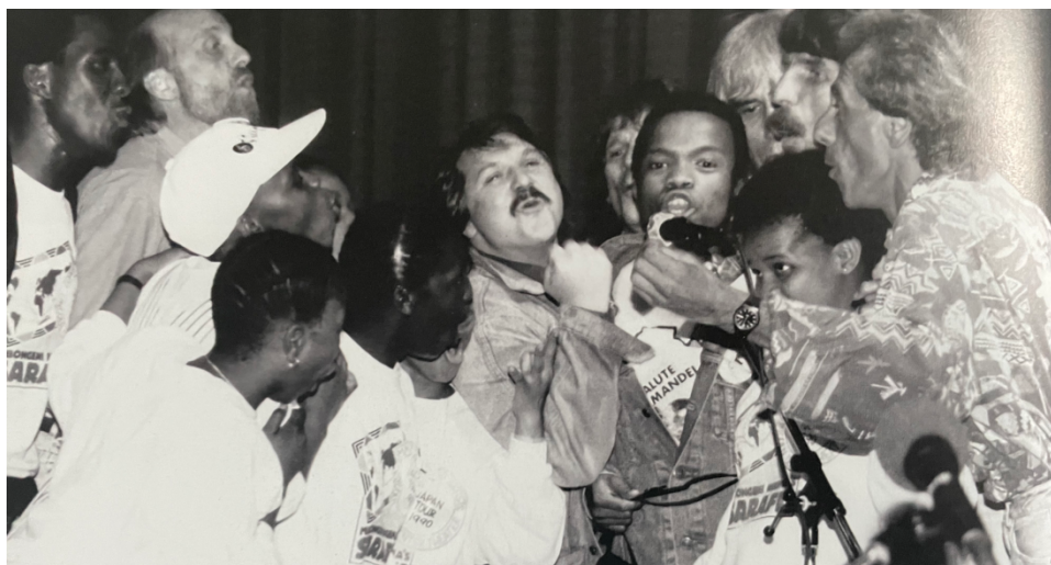
Abbildung 24 - 1990 im Bonner Maritim Hotel zur Freilassung von Nelson Mandela mit Musikern des Musicals Sarafina

Unsere Recherche ergab, dass sich alle Fööss in dieser Sache einig waren. Der bewegendste Moment ihrer Karriere – wenn man einen herausstellen kann – war die Begegnung mit Nelson Mandela. Kurz nachdem Mandela aus der Haft entlassen worden war, gab die SPD ihm zu Ehren einen Empfang in Bonn. Die Fööss sangen den Song „Homeless“ von Ladysmith Black Mambazo, die Antiapartheidshymne überhaupt. Nelson Mandela stand zusammen mit Willy Brandt vor der Bühne, ebenso wie die Mitglieder des Musicals Sarafina, das die Geschichte der Haft Mandelas erzählt. Eine Schar der Musical-Darsteller „stürmte“ die Bühne und sang mit.