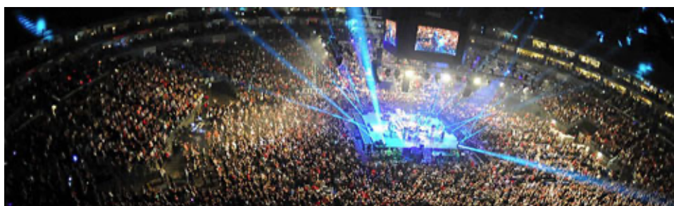
Abbildung 25 - Millenniumskonzert Köln-Arena

Ein weiterer Höhepunkt war das Millennium-Konzert vor 15.000 Zuschauern in der ausverkauften Köln-Arena. Das werden die Fööss wohl nie vergessen. Erry bekäme heute noch Gänsehaut, wenn er daran denkt, sagte er in einem Interview.