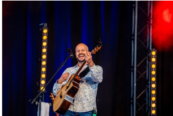
Abbildung 37 - Tanzbrunnen 26.08.2024