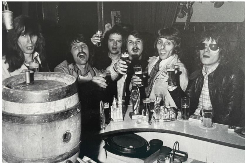
Abbildung 12 - De Fööss en ehrer Stammkneip (Dir Ringschenke)

En ehr Stammkneip, der Ringschänk, han se em Keller ehre Proberäume gehat. Dodrin han de Fööss ziemlich vill Stunde verbrach met Probe un Texte för neu Leeder ze schrieve. Et darf nit vergesse weede, dat der Lohn för erfolgreiche Optredde noh umfangreicher un manchmol och hadder Vürarbeid ende Kneip de neu Leeder opjelaat (A- un B-Sigge = Vorder-/Rücksigge vun der Plaate). Woför et mih Applaus gov, dat woren dann de A-Sigge. Et woodte och ganz LP's (Langspielplatten = Vorläufer vun CD's) getestet. De Zohörer krähte Zeddel för de Benotung un de beste 5 wore dann miets och de neue Hits.