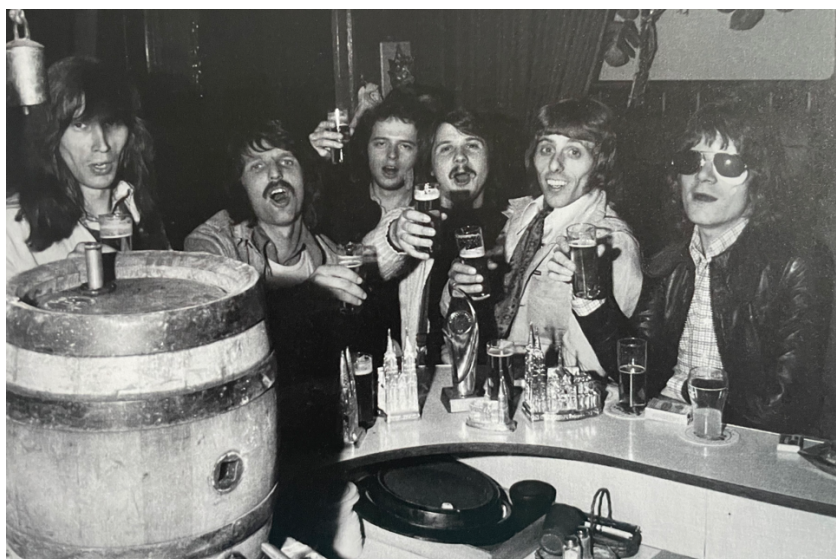
Abbildung 14 - Die Fööss in Ihrer Stammkneipe (D'r Ringschenke)

In ihrer Stammkneipe, der Ringschenke hatten sie im Keller ihre Probenräume. Dort verbrachten die Fööss sehr viele Stunden mit Proben und dem Texten von neuen Liedern. Es darf nicht vergessen werden, dass der Lohn für erfolgreiche Auftritte in umfangreicher und manchmal auch harter Vorarbeit im Probenraum liegt. Wenn sie mit den Proben fertig waren, hat die Wirtin Beatrix oben in der Kneipe die neuen Lieder aufgelegt (A- und B Seite = Vorder-/Rückseite der Platte). Wofür es mehr Applaus gab, das wurde dann die A-Seite. Es wurden auch ganze Langspielplatten (LP's = Vorläufer von CD's) getestet. Die Zuhörer bekamen Zettel zur Benotung und die besten 5 wurden dann meist auch die neuen Hits.