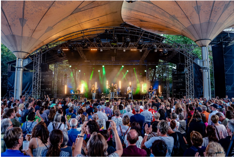
Abbildung 38 - Tanzbrunnen 26.08.2023

Wat verzaubert dich an den BF auch nach 53 Jahren noch?