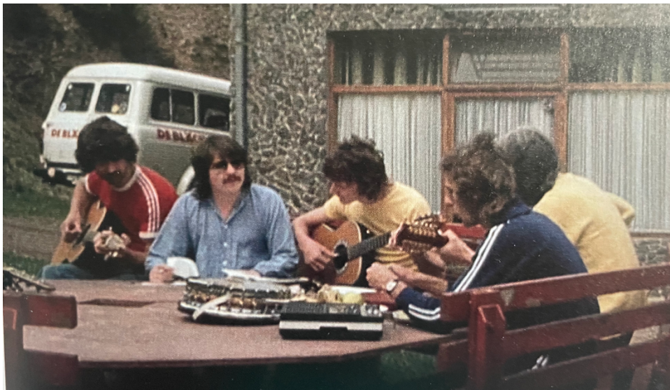
Abbildung 16 - Die Fööss komponierte und sunge neue Leeder in

Erfolg hät och för de Fööss bedück, ständig dranzoblieve un regelmäßig Neues zo finge. Anfangs sin se all zosamme noh der Hasborner Mühl en de Eifel gefahre un han do drin geprob un Leeder geschrivve. De Teams sin dann später och noch bestonn geblivve. Konsequenterwies sin se ävver getrennt vun einander op Jöck gegange un han sich esu im Nohgang widder versammelt un de Texte un jeweilige Rollen im Leed usgemaat.