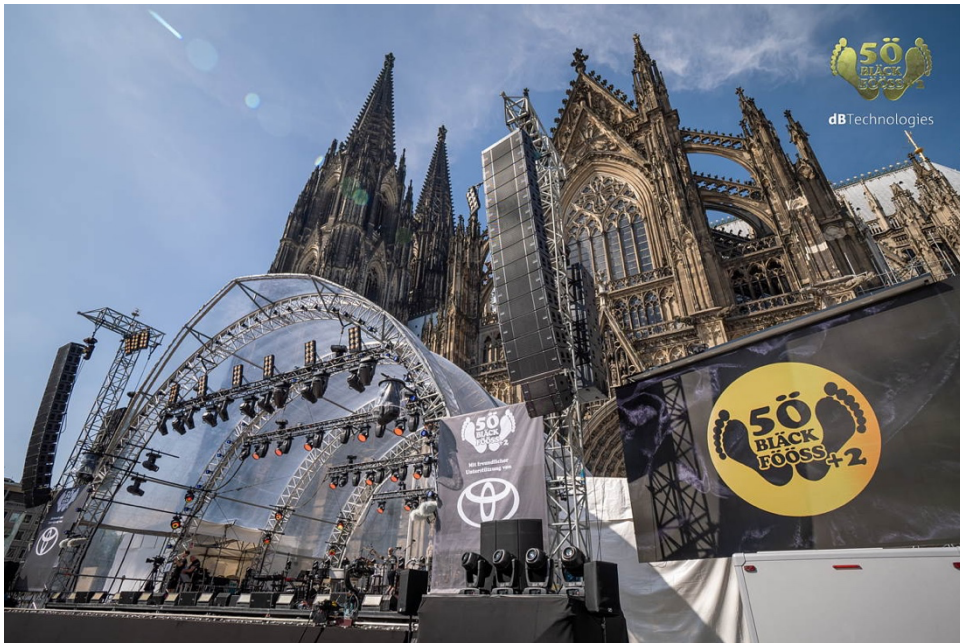
Abbildung 30 - Roncalliplatz 2022 – 50 Jahre Jubiläum (nachgefeiert)

Zum 50 jährige Bandjubiläum em Jahr 2020 hatte sich de Fööss vill vürgenomme. Allerdings mohten opgrund vun Corona de Mietste vun denne geplante Konzerte op 2021 oder 2022 verschobe weede.