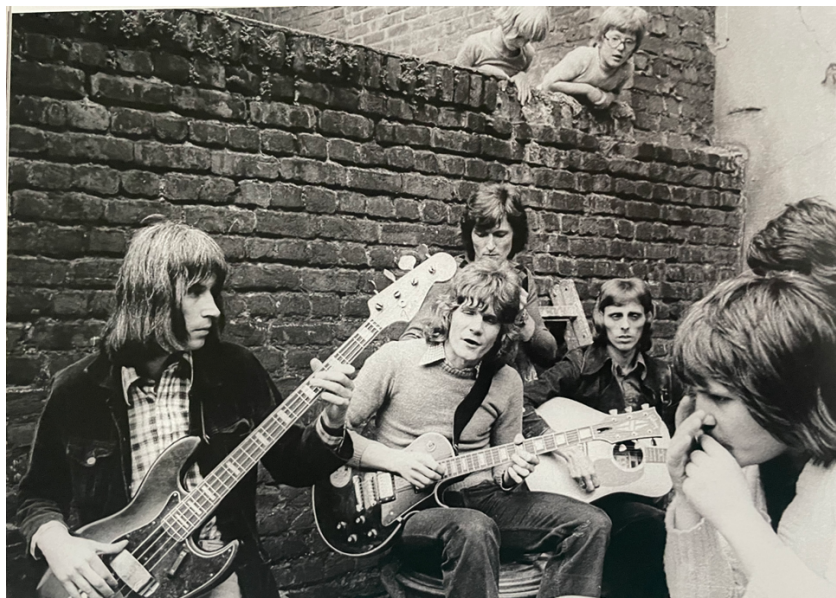
Abbildung 15 - Die Fööss probten auch im Hof und hatten die ersten Zuhöre

Auch wenn die Fööss sehr mit Köln verbunden waren, wollten sie anfangs auch überregional Erfolg haben. Das gelang 1983 mit dem Lied „Frankreich, Frankreich“. 190.000 verkaufte