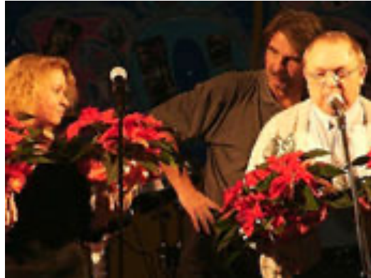
Abbildung 20 - Montessori Schule 2001