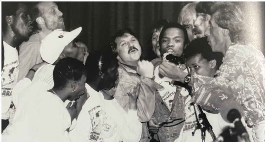
Abbildung 22 - 1990 im Bonner Maritim Hotel zor Freilassung vun Nelson Mandela met Musiker vum Musical Sarafina

Unser Recherche hät ergovve, dat sich alle Fööss en dä Saach einig wore. De bewegendste Momang ehrer Karriere – wenn mer eine erustelle kann – wor die Begängung met Nelson Mandela. Kurz nohdem Mandela us de Haft entlasse woode wor, hät de SPD ihm zo Ihr ene Empfang en Bonn gegovve. De Fööss han do de Song „Homeless“ vun Ladysmith Black Mambazo gesunge, de Antiapartheitshymne övverhaup. Nelson Mandela stund zosamme met Willy Brandt vür dä Bühn, och de Mitglieder vum Musical Sarafina, dat de Geschich vun dä Haff vum Mandela verzällt. En Schar vun dä Musical-Darsteller „störmt“ de Bühn un sung met.