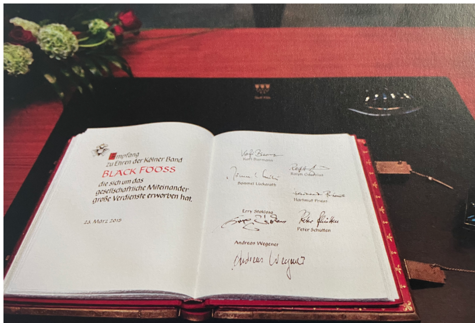
Abbildung 27 – Eintrag in das Goldene Buch der Stadt Köln

2015 durften Sie sich in das Goldene Buch der Stadt Köln eintragen.