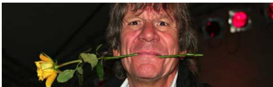
Abbildung 5 - 06.09.2008 Odenthal