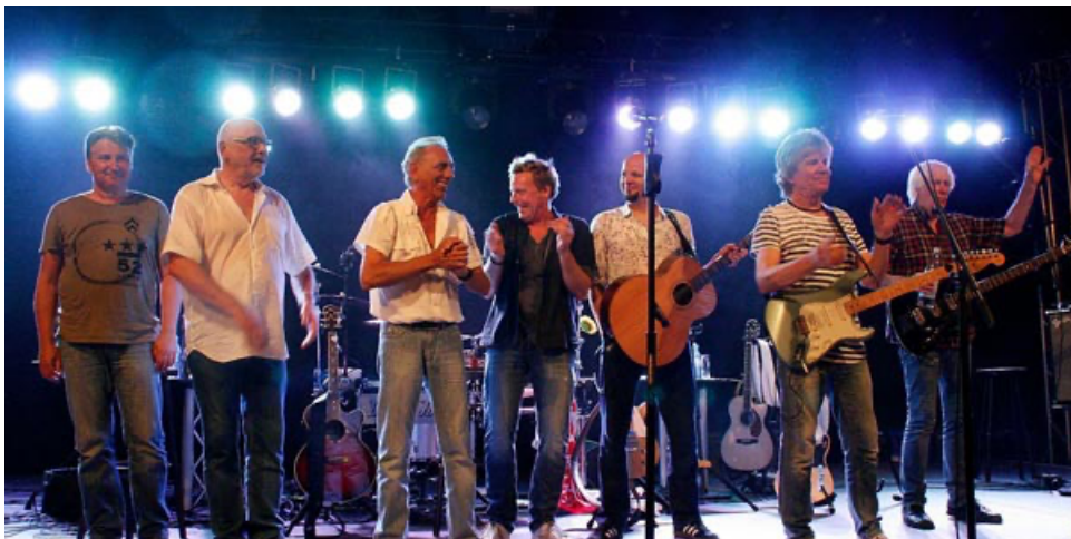
Abbildung 1 - 26.05.2017 (Hürth)

Bläck Fööss - Zeitreise durch mehr als 50 Jahre Musikgeschichte