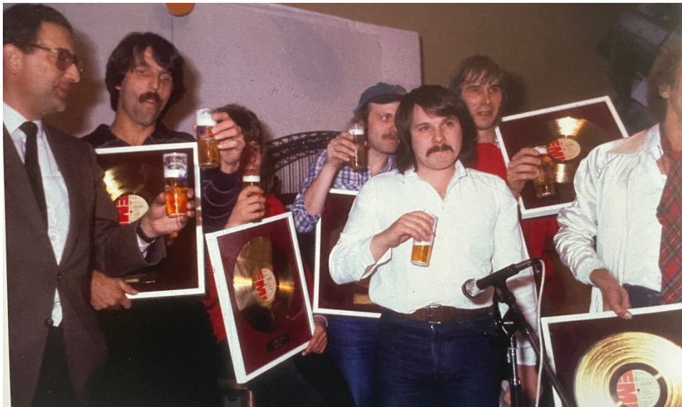
Abbildung 18 - Innenminister un Wahlkölsche Gerhard Baum övverreicht die Plaat