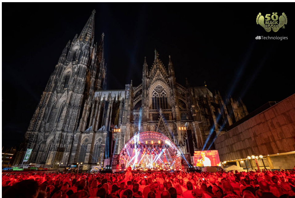
Abbildung 35 - Roncalliplatz 2022 – 50 Jahre Jubiläum (nachgefeiert)

Es ist davon auszugehen, dass die Welt der Kölner ohne die Fööss eine andere wäre. Der Beitrag der Band zum Erhalt der kölschen Sprache ist allgemein anerkannt und viele Lieder aus ihrem Fundus sind schon längst zu Evergreens geworden. Die Fööss haben für jeden Augenblick im Leben ein Lied gemacht – gewollt oder ungewollt. Und sie haben so ziemlich alle kritischen Themen des Lebens in ihren Liedern verpackt.