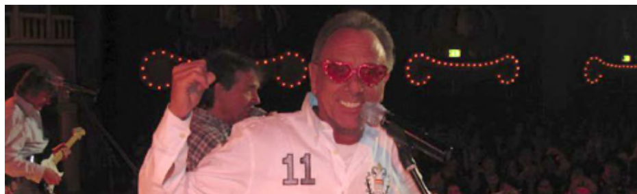
Abbildung 4 - Session 2012

Das war und ist bis heute eine lange und spannende Reise. Und auch die Bläck Fööss blieben in dieser langen Zeit nicht von der einen oder anderen großen Veränderung verschont. Zuletzt gab es 2022 die bisher letzte, dafür aber große Zäsur. Die beiden noch verbliebenen Gründungsmitglieder, Gitarrist und Sänger Ernst-Josef „Erry“ Stocklosa und Gitarrist Günther „Bömmel“ Lückerrath, traten nach mehr als 52 Jahren von der großen Showbühne zurück.