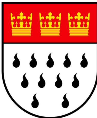
Abbildung 39 - Kölner Wappen