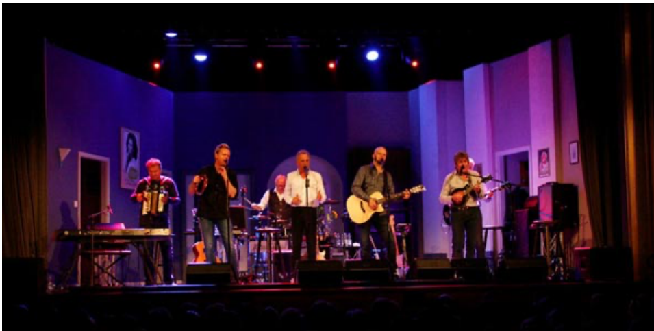
Abbildung 28 - Köln Volksbühne (ehemols et Millowitsch Theater 2017)

De personelle Veränderunge sin sicherlich en große Herausforderung gewäs. Met jedem bekannte Geseech, dat de Band verloße hät, moht e neu Geseech etabliert weede. Dat Wohl- un Mir-Gefühl kütt sicher nit bei jedem em Publikum glich aan. Dennoch han de Fööss dä größte un wichtigste Schritt gemaat, öm de Band wiggerzoentwickele un bei neue Zielgrupp aanzokumme.