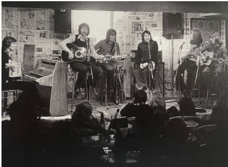
Abbildung 9 - Auftritt im Senftöpfchen

Exkurs: Hierbei ist zu beachten, dass das Equipment seinerzeit noch eher rudimentär war. Jeder der Musiker hatte im Prinzip ein Instrument und es gab einen Verstärker für Bass und Gitarre. Das war alles, womit man unterwegs war. Im Gegensatz dazu haben die Bands heutiger Prägung einen wahnsinnigen Aufwand, um ihr Equipment an Ort und Stelle zu bringen und aufzubauen. Das lässt sich nur noch mit einem speziellen Team bewerkstelligen. Verständlicherweise braucht man zumindest einiges davon, um die großen Veranstaltungsorte auch zu "beschallen" und vielfach die Show aufzuziehen.