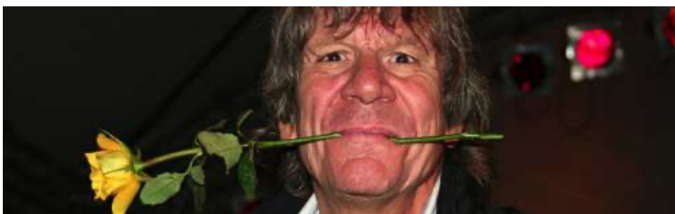
Abbildung 3 - 06.09.2008 Ohnde (Odenthal)