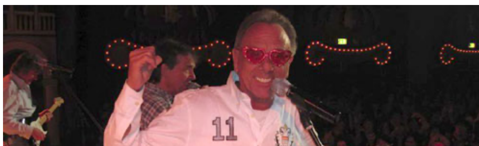
Abbildung 2 - Session 2012

Dat wor un es bes hüek en lang un spannende Reis. Un och de Bläck Fööss sin en dieser lange Zigg nit vun der ein oder andere grüße Veränderung verschont geblivve. Zuletzt hät et 2022 die bisher letzte, doför ävver große Zäsur gegovve. Die beide bes dohin noch överiggeblivvene Gründungsmitglieder, Gitarrist un Sänger Ernst-Josef „Erry“ Stocklosa un Gitarrist Günther „Bömmel“ Lückerrath, sin noh mih als 52 Jahr vun der große Showbühn zoröckgetrodde.