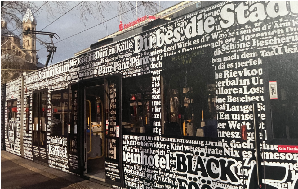
Abbildung 32 - Die Fööss gewidmete Straßenbahn

Us der „Corona-Not“ han se en Tugend gemaat. Praktisch us dem Homeoffice erus wood de Veedelband gegründet. Domet wullte de Fööss de Lück Mot maache, dat der „Driss“ och widder vorbeigeiht. Övver 1,5 Mio. Zohriffe hät dat Leed en de soziale Netzwerke gehat – met dem Klassiker „En unsrem Veedel“.