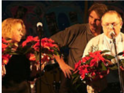
Abbildung 21 - Montessori Schule 2001