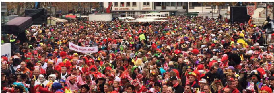
Abbildung 11 - 11.11.2014 Sessionseröffnung auf dem Heumarkt

Der Karneval hat sich im Laufe der 5 Jahrzehnte zweimal gewandelt. Als die Fööss auf der Bühne erschienen, kam die erste Wandlung ins Rollen. Sie haben viele Dinge anders gemacht, mit ihren Texten und ihrem kritischen Hinweisen wurden viele Probleme sichtbar und es kam sicher an der einen oder anderen Stelle Bewegung in Veränderungsprozesse. Die zweite Wandlung erfolgte mit der sog. „Verballermanisierung“, bei der es nur noch um Party und weniger um kritische Inhalte ging. So haben bspw. Büttensprecher oder sonstige Einzeldarsteller einen sehr schweren Stand, wenn sie ihre kritischen Untertöne zum Besten geben wollen. Wegen der ausufernden Kommerzialisierung traten die Fööss auf dem Heumarkt nicht mehr auf. Das Lied, was das versinnbildlicht, ist „Aber bitte mit Jeföhl“.