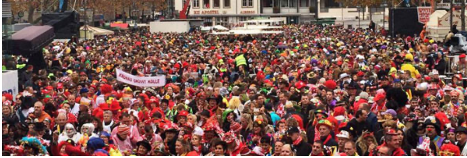
Abbildung 10 - 11.11.2014 Sessionsoptak om Heumaat

Der Karneval hät sich im Lauf vun der 5 Jahrzehnte zweimol gewandelt. Als die Fööss op der Bühne erschiene sin, kom die eetste Wandlung en et Rolle. Se han vill Dinge anders gemaht, met ehre Texte un durch ehre kritische Hinweise sin vill Probleme sichtbar gewoode un et kom sicher an der ein oder andere Stell Bewegung in Veränderungsprozesse. De zweite Wandlung met der sog. „Verballermannisierung“, bei der et nur noch öm Party un winniger öm kritische Inhalte ging. Su han bspw. Büttendredner oder sonstige Einzeldarsteller ene sehr schwere Stand, wenn se ehr kritische Ungertön zum Beste gevve wolle. Wägen der usufernde Kommerzialisierung sin de Fööss op dem Heumarkt nit mih opgetrodde. Dat Leed, wat dat versinnbildlicht, is “Ävver bitte met Gefühl”.