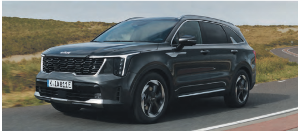
Der geräumige Sorento Plug-in Hybrid „Plug&Ride“ kostet ab 62.890 Euro

Köln – Zwischen Voll- und Plug-in-Hybriden besteht üblicherweise ein Preisunterschied. Kia lässt diese Differenz nun schrumpfen: Für die aufladbaren Hybrid-Versionen von Niro, Sportage und Sorento bietet Kia jetzt die limitierten Sondermodelle „Plug&Ride“ an, die ab sofort bestellt werden können. Sie