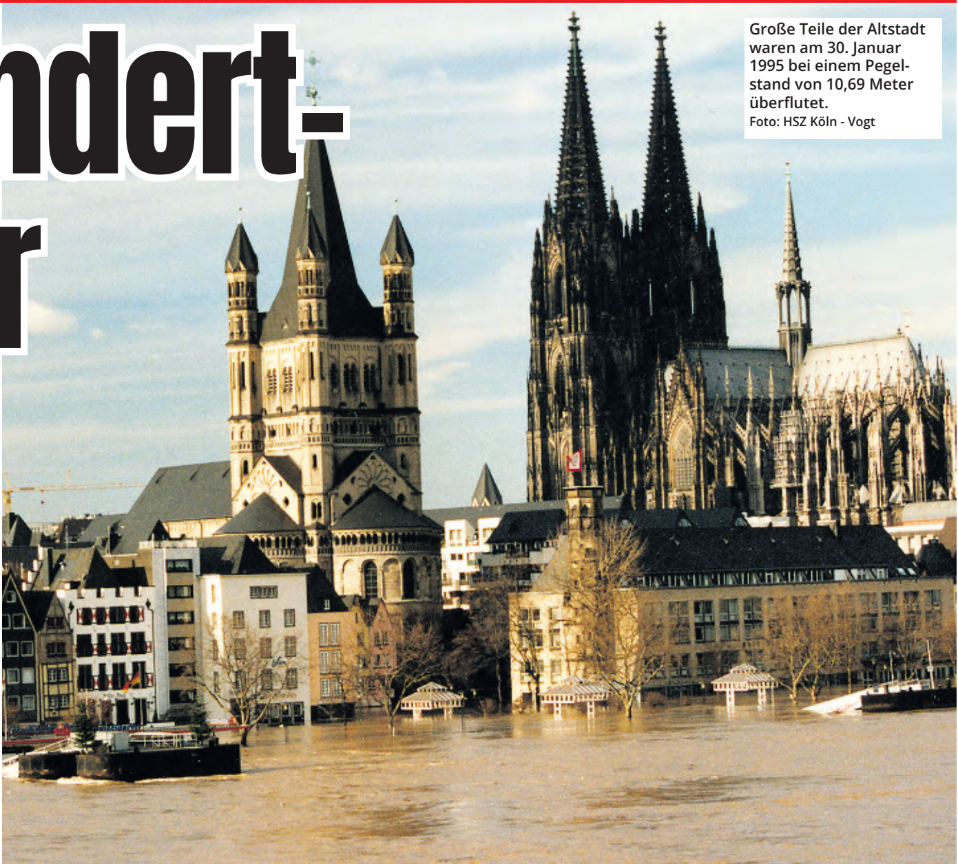
Große Teile der Altstadt waren am 30. Januar 1995 bei einem Pegelstand von 10,69 Meter überflutet.