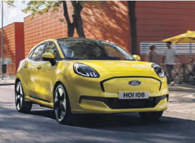
Puma E-Antrieb soll Fahrvergnügen stützen

Wie für jeden Kia-Neuwagen gelten für die „Plug&Ride“-Sondermodelle die 7-Jahre-Kia-Herstellergarantie, die die Antriebsbatterie mit einschließt und das 7-Jahre-Kia-Navigationskarten-Update. Karten- und Software-Aktualisierungen sind auch als Over-the-Air-Update (OTA) verfügbar. Als Dienstwagen sind alle drei Kia Plug-in-Hybride steuerlich förderfähig. Das bedeutet, dass monatlich statt einem Prozent nur 0,5 Prozent des Listenpreises als geldwerter Vorteil versteuert werden muss. WMD