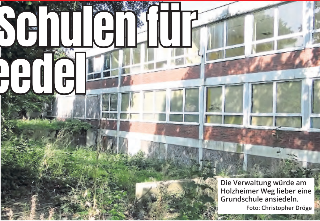
Die Verwaltung würde am Holzheimer Weg lieber eine Grundschule ansiedeln.

Die Schulentwicklungsplanung des Bezirks konzentrierte sich zurzeit auf den Bereich von Roggendorf/Thenhoven und