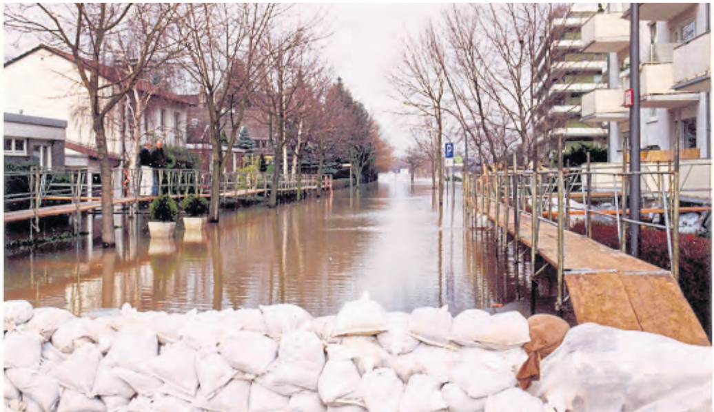
Um Staudämme zu errichten, wurden 1995 rund 400 000 Sandsäcke genutzt.

11,30 bis 11,70 m Viele Gebiete der Stadt werden überflutet.