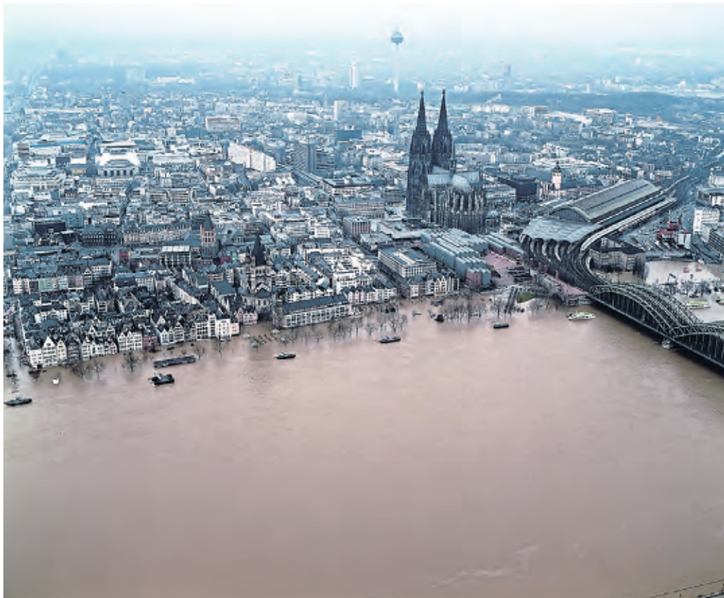
Beim Hochwasser im Januar 1995 standen Teile der Altstadt unter Wasser, weshalb Stege aufgebaut und Boote eingesetzt werden mussten.