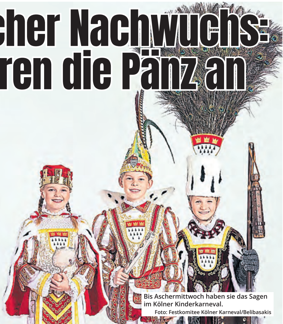
Bis Aschermittwoch haben sie das Sagen im Kölner Kinderkarneval.