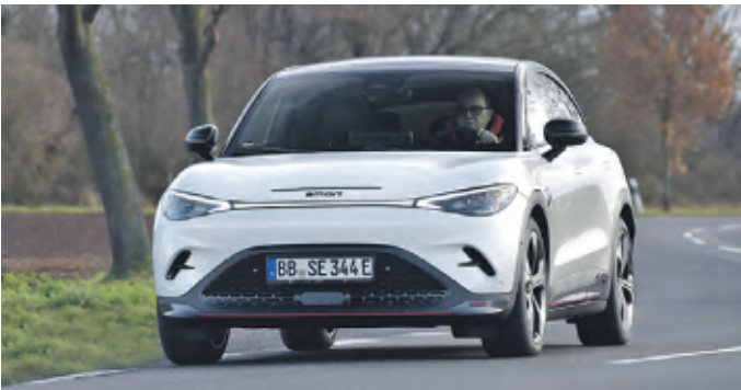
Der sportliche smart #3 BRABUS

Der sportliche Auftritt will sich auch in der Leistung des #3 widerspiegeln: Die Leistung reicht von 272 PS (200 kW) bei den vier heckangetriebenen Linien bis zu 428 PS (315 kW) im BRABUS, damit sind in diesem Marktsegment Maßstäbe gesetzt. Hier bewegt sich die Beschleunigung von 0 auf 100 km/h in 3,7 Sekunden.