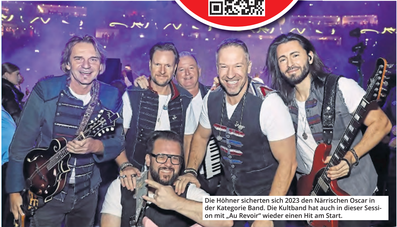
Die Hühner sicherten sich 2023 den Närrischen Oscar in der Kategorie Band. Die Kultband hat auch in dieser Session mit „Au Revoir“ wieder einen Hit am Start.

Bis zum 9. Februar 2025 um 24 Uhr kann bei Kölns größtem jekken Karnevals-Wettbewerb abgestimmt werden. Bis dahin zählt jede Stimme im Kampf um den Närrischen Oscar.