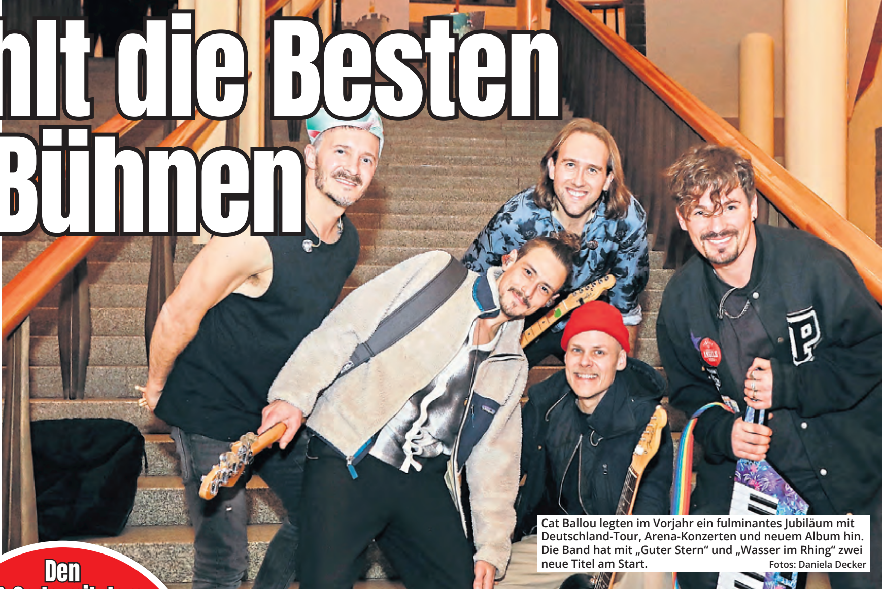
Cat Ballou legen im Vorjahr ein fulminantes Jubiläum mit Deutschland-Tour, Arena-Konzerten und neuem Album hin. Die Band hat mit „Guter Stern“ und „Wasser im Rhing“ zwei neue Titel am Start.

und „Newcomer“. Da auch viele Musikerinnen und Musiker ihr Publikum ohne große Band-Unterstützung begeistern, bekommen sie auch eine eigene Sparte. Und da der Nachwuchs sowohl im Bereich der Musik als auch bei der Rede ins Rampenlicht drängt, wollen wir dies mit einer