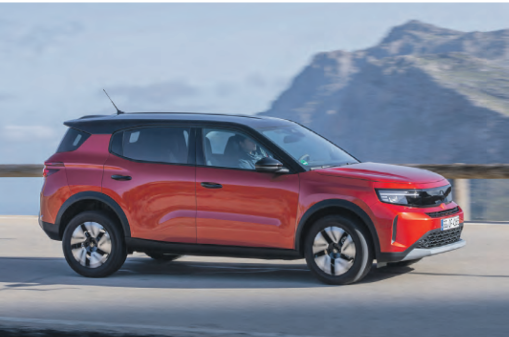
Der familienfreundliche Frontera bietet bis zu sieben Sitzplätze

Wer komplett lokal emissionsfrei unterwegs sein möchte, kann den batterie-elektrischen Frontera Electric mit 83 kW (113 PS) Leistung, 44 kWh-Akku (nutzbare Kapazität) und bis zu 305 Kilometer Reichweite bestellen. Als später folgende „Long Range“-Version werden mit dem neuen Frontera Electric bis zu rund 400 Kilometer (vorläufige Reichweite) ohne Ladestopp möglich sein. WMD