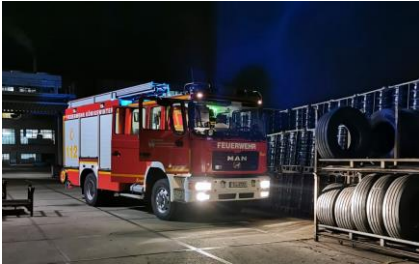
HLF20 (MAN ME 14.280/Ziegler, Baujahr 2005)

Der Löschzug Altstadt verfügt derzeit über fünf Fahrzeuge sowie fünf Anhänger.