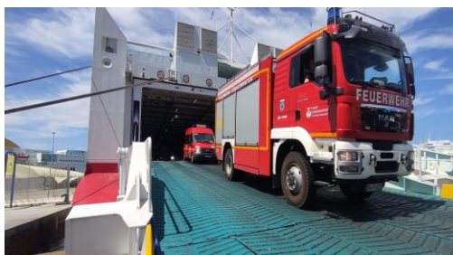
TLF3000 (MAN TGM 13.290/Ziegler, Baujahr 2011)

Hier beim Verlassen der Fähre im Hafen von Ancona/Italien im Rahmen des Einsatzes des GFFF-V.