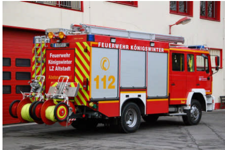
HLF20 (MAN ME 14.280/Ziegler, Baujahr 2005)

Der Löschzug Altstadt verfügt derzeit über fünf Fahrzeuge sowie vier Anhänger.