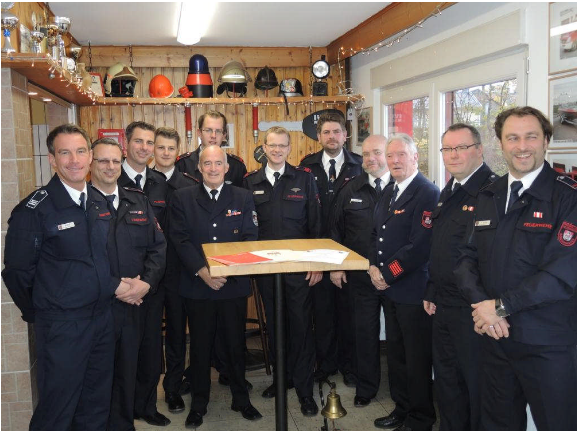
Geehrte und Beförderte am Patronatstag 2014

Nach einigen Grußworten der Ortsvereine endete der offizielle Teil mit einem Mittagessen. Danach ließen die Löschzugmitglieder den Tag in geselliger Runde ausklingen.