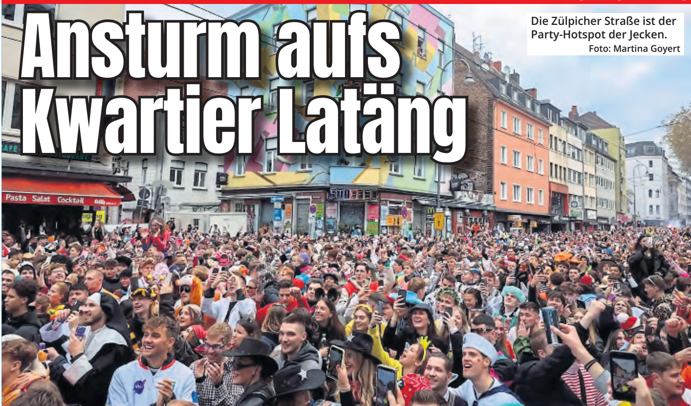
Die Züllicher Straße ist der Party-Hotspot der Jecken.