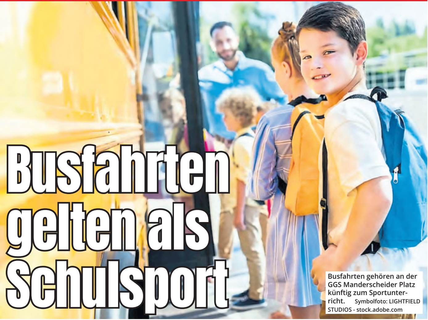
Busfahrten gehören an der GGS Manderscheider Platz künftig zum Sportunterricht.

Die Situation im Zuge des Turnhallenneubaus an der GGS Manderscheider Platz wird immer absurder. Bis 2027 sollen an der Sülzer Grundschule zwei neue Gebäude entstehen, die aktuelle Halle wird aber schon jetzt abgerissen. Über die Alternative können die Eltern der Schüler sowie der Chef des Stadtsportbundes nur den Kopf schütteln, zumal diese erst kurz vor Ende der Herbstferien präsentiert wurde. Denn künftig gelten Busfahrten und andere Wege zu Sportstätten für Schüler der GGS Manderscheider Platz als Sportunterricht.