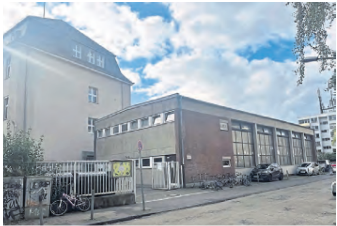
Die alte Turnhalle GGS Manderscheider Platz wird abgerissen.

Peter Pfeifer hat diesbezüglich allerdings wenig Hoffnung. Vielmehr sei die Lage auch an vielen anderen Schulen der Stadt schlecht. Dementsprechend appelliert auch er in Richtung der Entscheidungsträger, die Bedingungen zugunsten des Schulsports durch das Ergreifen der richtigen Maßnahmen endlich dauerhaft zu verbessern.