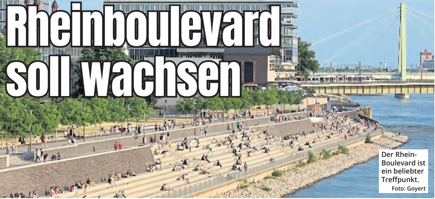
Der Rhein-Boulevard ist ein beliebter Treffpunkt.

Der Rheinboulevard ist ein beliebter Treffpunkt für Kölner. Jetzt soll er wachsen.