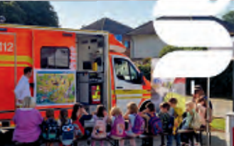
Ein buntes Kinderprogramm für Vorschulkinder. Auf dem Bild: Besichtigung eines Rettungswagens

110 Jahre Geschichte, davon 40 Jahre unter Sana – wir blicken auf eine große Herkunft und ebensolche Zukunft“, sagte Sana-Vorständin Stefanie Kemp. Das Krankenhaus Hürth ist Vorreiter bei der Digitalisierung der Sana-Kliniken: „Es wird eines der ersten Häuser sein, die wir auf ein neues digitales Betriebssystem umstellen – für eine einfachere Gesundheitsversorgung für Patienten und Mitarbeitende.“