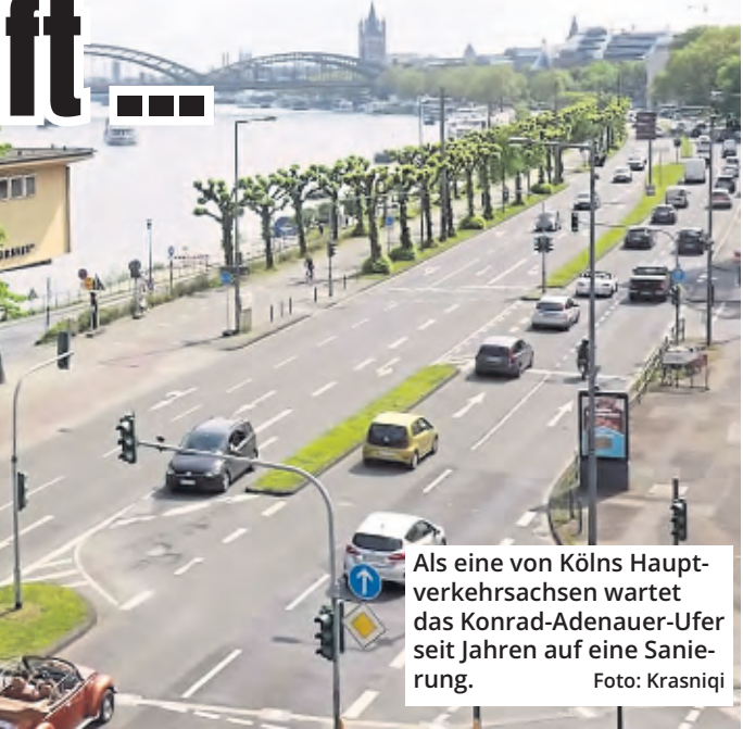
Als eine von Kölns Hauptverkehrsachsen wartet das Konrad-Adenauer-Ufer seit Jahren auf eine Sanierung.

Straßenverkehrsnetz steht das Konrad-Adenauer-Ufer allerdings nicht weit oben auf der Prioritätenliste des Verkehrsdezernats. Zunächst will sich das Amt für Straßen- und Radwegbau laut Mitteilung auf die Fertigstellung der „Via Culturalis“ in der Gürzenich- und Pipinstraße konzentrieren, die Neusser Landstraße instandsetzen und schließlich auch die Nord-Süd-Stadtbahn ausbauen. Auch wichtiger sei der Erhalt der Verkehrssicherheit, Beispiel Schutzplanken an der Industriestraße im Norden, wo derzeit Tempo 50 statt 100 km/h gefahren werden darf.