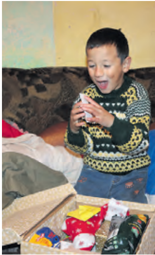
Die kleine rumänische Junge freut sich über sein Weihnachtspäckchen.