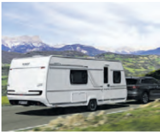
Top-Variante von Fendt-Caravan