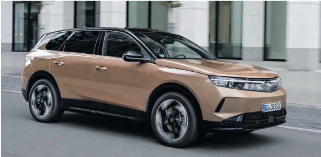
Der vollelektrische Grandland Electric leistet 157 kW (213 PS) und kostet 46.750 Euro

Der neue Opel Grandland ist durch und durch ‚made in Germany‘