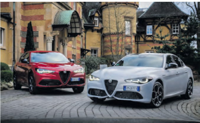
Stelvio (li.) und Giulia gibt es auch mit Diesel

Markantestes Merkmal der Alfa Romeo Modelle Giulia und Stelvio ist das neue Design der Scheinwerfer. Analog zum Alfa Romeo Tonale sind sie nun in 3+3-Elementen aufgebaut. Die drei Module bilden Fahrlicht, Tagfahrlicht und Blinker ab. Diese Konfiguration ist eine Hommage an berühmte Modelle der Marke aus den frühen 1990er Jahren, das Coupé Alfa Romeo SZ Zagato und das Konzeptfahrzeug Alfa Romeo Proteo. Heute setzen die Scheinwerfer auf die Voll-LED-Matrix-Technologie.