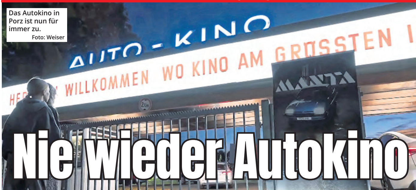
Das Autokino in Porz ist nun für immer zu.

Das war es! Nach 57 Jahren lief im Porzer Autokino zum letzten Mal ein Film. Für viele Fans der Kultstätte war das ein emotionaler Augenblick.