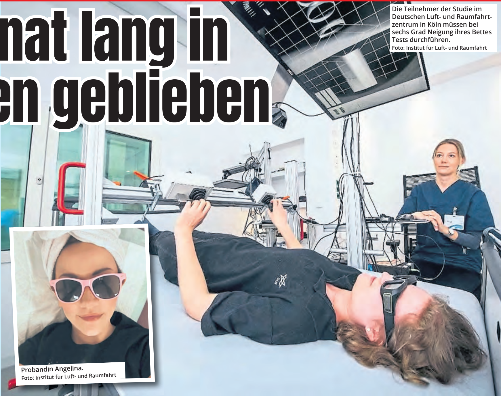
Die Teilnehmer der Studie im Deutschen Luft- und Raumfahrtzentrum in Köln müssen bei sechs Grad Neigung ihres Bettes Tests durchführen.