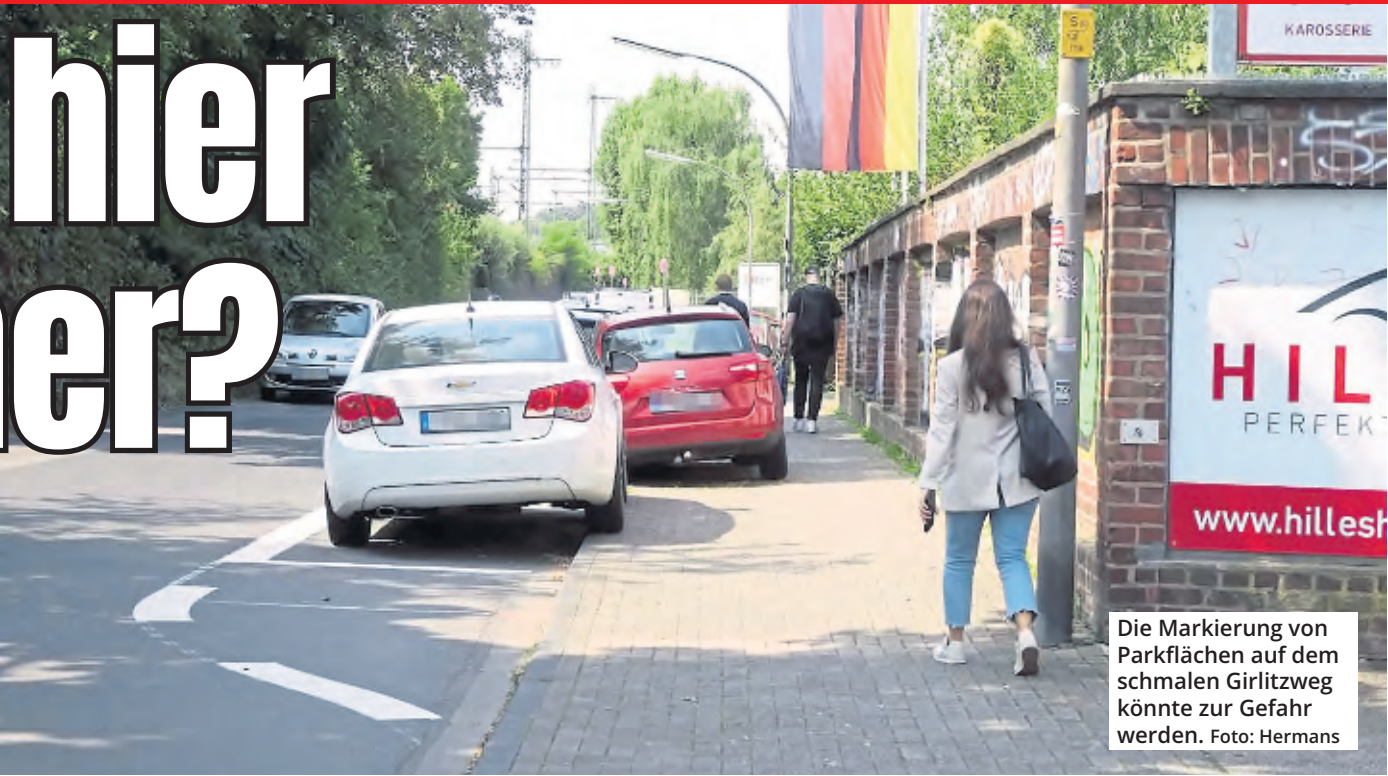
Die Markierung von Parkflächen auf dem schmalen Girlitzweg könnte zur Gefahr werden.

Auch bei einem weiteren Thema hofft Spelthann auf einen Durchbruch: Der Tunnel unter dem Bahndamm zwischen Widdersdorfer Straße und Girlitzweg soll nach Vorstellung der Politiker künftig nur noch in eine Richtung befahrbar sein. Das würde nicht nur den engen Tunnel sicherer für Schüler machen, sondern auch Schleichverkehr vom Girlitzweg fernhalten. Auch hier sollte sich möglichst zeitnah etwas tun, meint Spelthann: „Es wird Zeit, denn die Schulen auf dem Vogelsanger Campus sind im Aufbau begriffen, die Zahlen der Schüler steigen weiter an.“