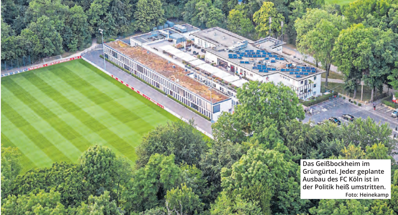
Das Geißbockheim im Grüngürtel. Jeder geplante Ausbau des FC Köln ist in der Politik heiß umstritten.

Nach dem jahrelangen Gezerre um den geplanten Ausbau des FC Köln im Grüngürtel schien es, dass eine Lösung greifbar nah ist. Doch die Platznot im Kölner Westen ist immer noch ein Riesen-Problem.