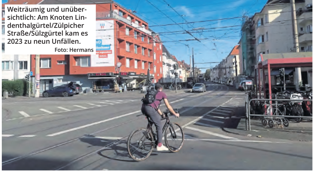
Weiträumig und unübersichtlich: Am Knoten Lindenthalgürtel/Zülpicher Straße/Sülgürtel kam es 2023 zu neun Unfällen.

Weniger mysteriös sind die fünf Unfälle, bei denen Radfahrer, die auf der Aachener Straße Richtung Stadion unterwegs waren, von Pkw angefahren wurden, die von der Militärringstraße kommend auf die Aachener Straße einbiegen wollten. Hier hat die Verwaltung bereits veranlasst, dass das Vorfahrtszeichen gegen ein Stopp-Schild für die Autofahrer ausgetauscht wurde. Eine Halteinie wurde ebenfalls markiert und das Warnschild „Radverkehr“ aufgestellt. Langfristig soll die Ausfahrt auf die Aachener Straße mit Ampeln geregelt werden.