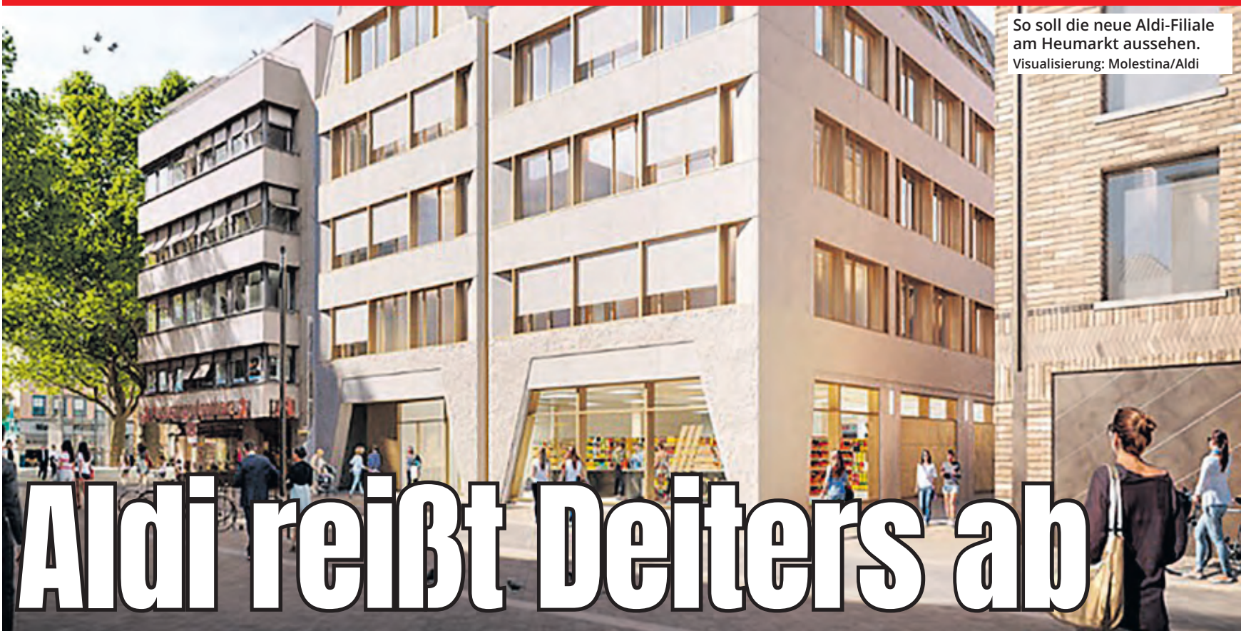
So soll die neue Aldi-Filiale am Heumarkt aussehen. Visualisierung: Molestina/Aldi