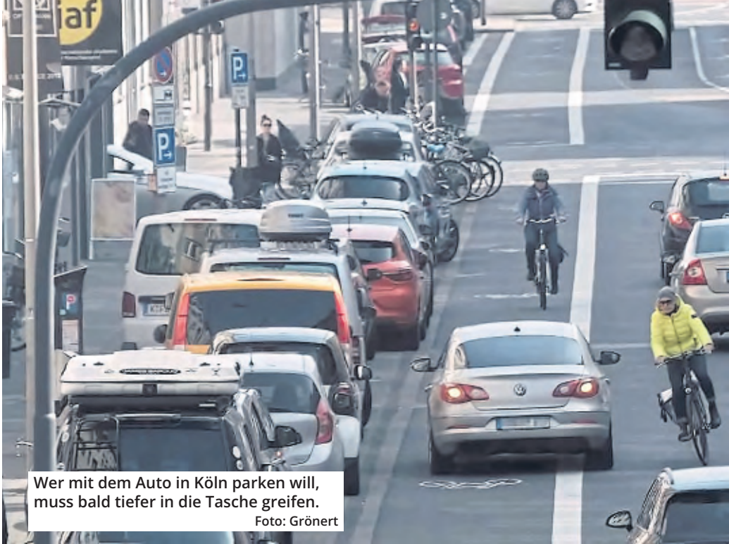
Wer mit dem Auto in Köln parken will, muss bald tiefer in die Tasche greifen.

Köln soll eine neue Parkgebührenordnung bekommen. Die Politik berät über die Beschlussvorlage der Verwaltung für eine neue Parkgebührenordnung 2025. Der Entwurf hat es in sich.