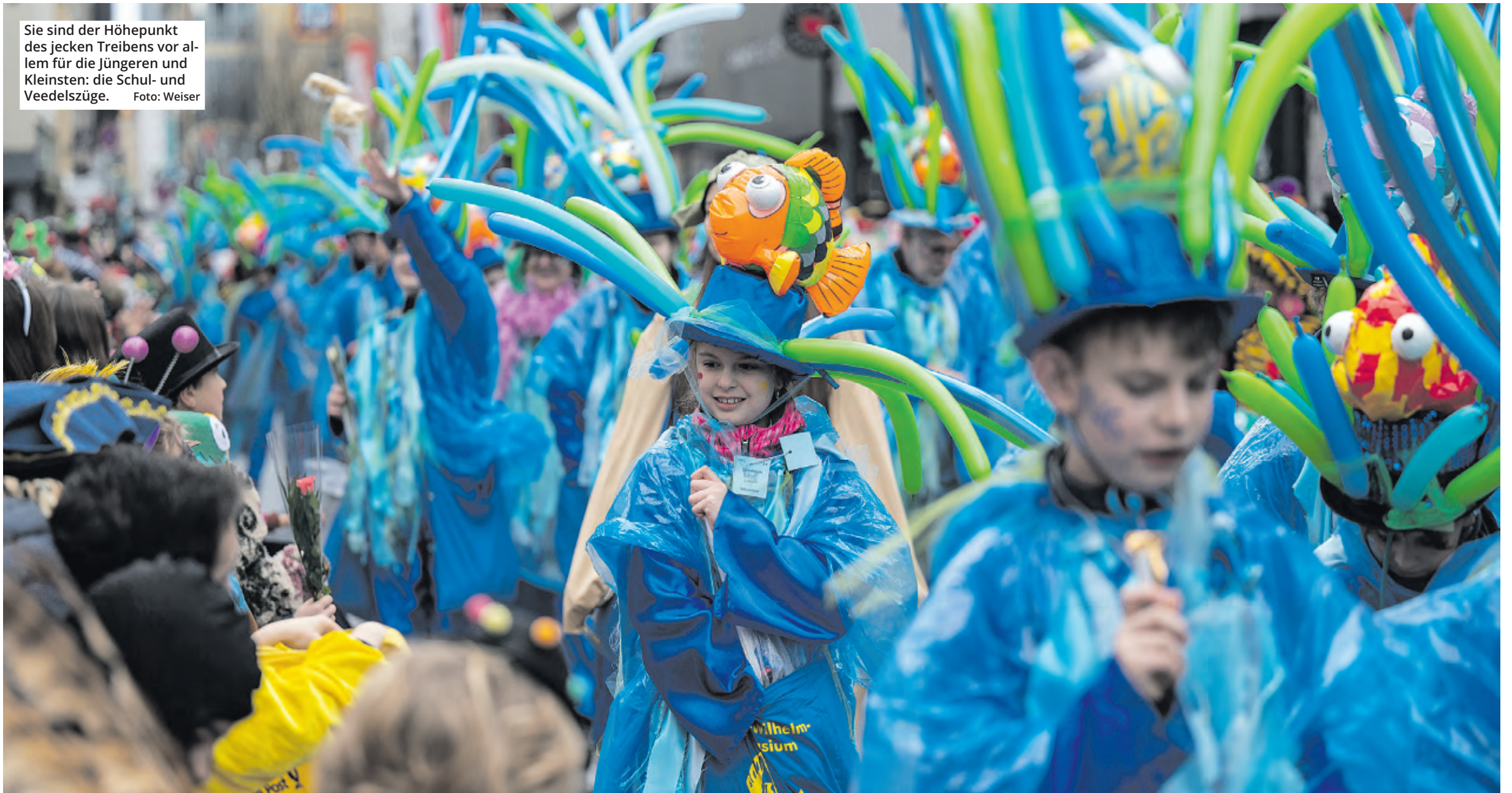
Sie sind der Höhepunkt des jecken Treibens vor allem für die Jüngeren und Kleinsten: die Schul- und Veedelszüge.