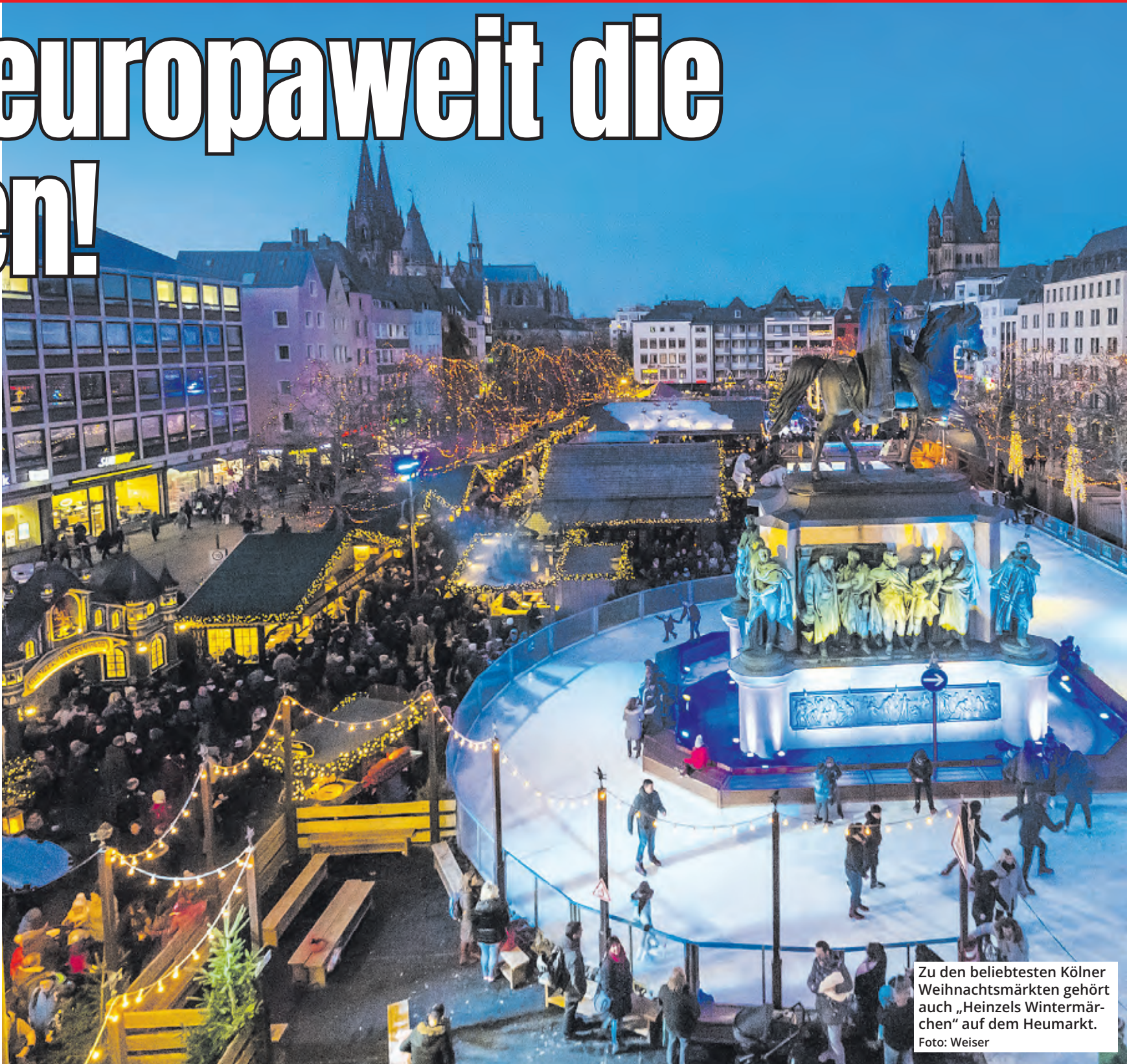
Zu den beliebtesten Kölner Weihnachtsmärkten gehört auch „Heinzels Wintermärchen“ auf dem Heumarkt.

Mit dem Weihnachtsmarkt am Schokoladenmuseum hat bereits am 15.11. der erste Kölner Markt für 2024 geöffnet, die meisten anderen noch eine Woche später nach.