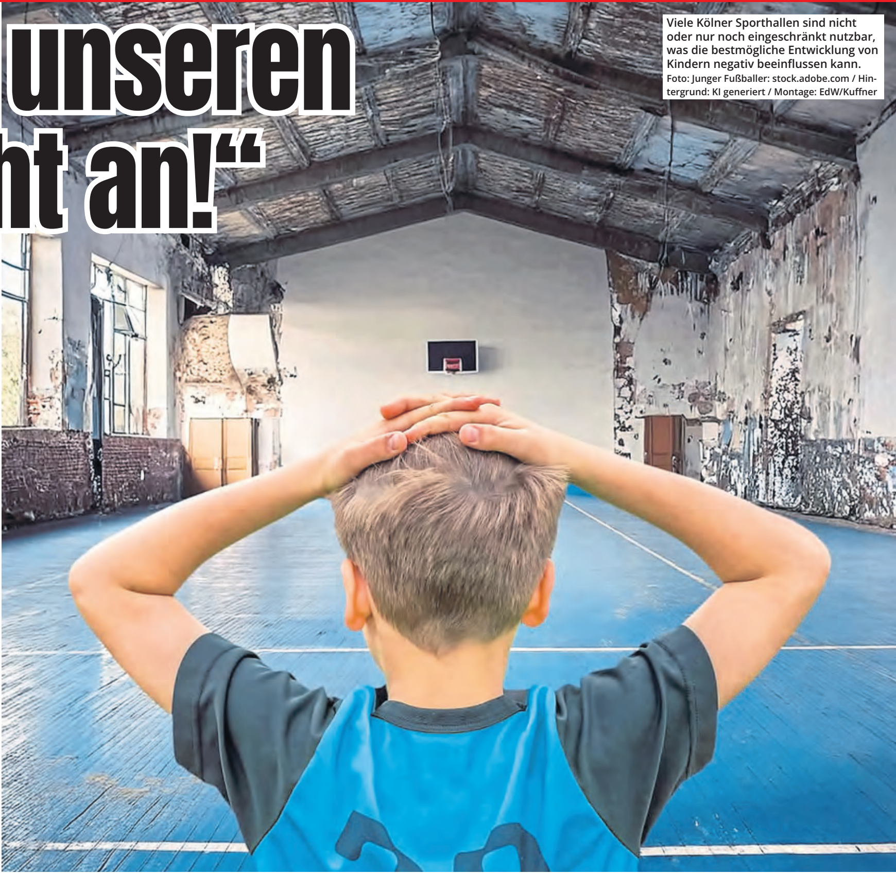
Viele Kölner Sporthallen sind nicht oder nur noch eingeschränkt nutzbar, was die bestmögliche Entwicklung von Kindern negativ beeinflussen kann.

„Nie wieder dürfen wir zulassen, dass unsere Schulen durchweg so marode werden, wie sie es vor zehn Jahren waren.“ Der Respekt vor der Zukunft der Stadtgebiete zudem, dass alles dafür getan werde, um Kölner Kindern die besten Rahmenbedingungen zu bieten, so Reker. Tatsächlich wird Köln seine Investitionen in die Schulen im Jahr 2025 im Ver-