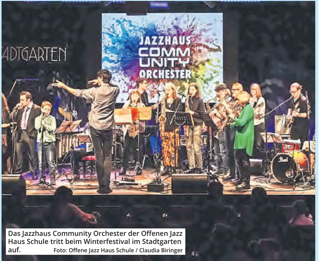
Das Jazzhaus Community Orchester der Offenen Jazz Haus Schule tritt beim Winterfestival im Stadtgarten auf.

Alle Auftritte des Festivals mit den genauen Uhrzeiten gibt es auf der Homepage der Schule unter jazzhausschule.de