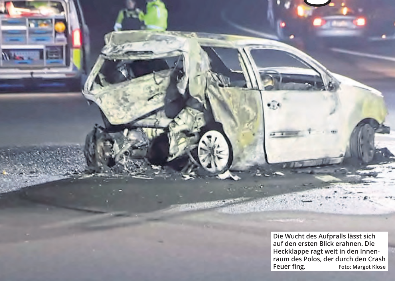
Die Wucht des Aufpralls lässt sich auf den ersten Blick errahnen. Die Heckklappe ragt weit in den Innenraum des Polos, der durch den Crash Feuer fing.

Ylvi und ihre Mutter Christina sind vor einem Jahr offenbar Opfer von Autofahrern geworden, die ihren Kick im Geschwindigkeitsrausch suchten. (red)