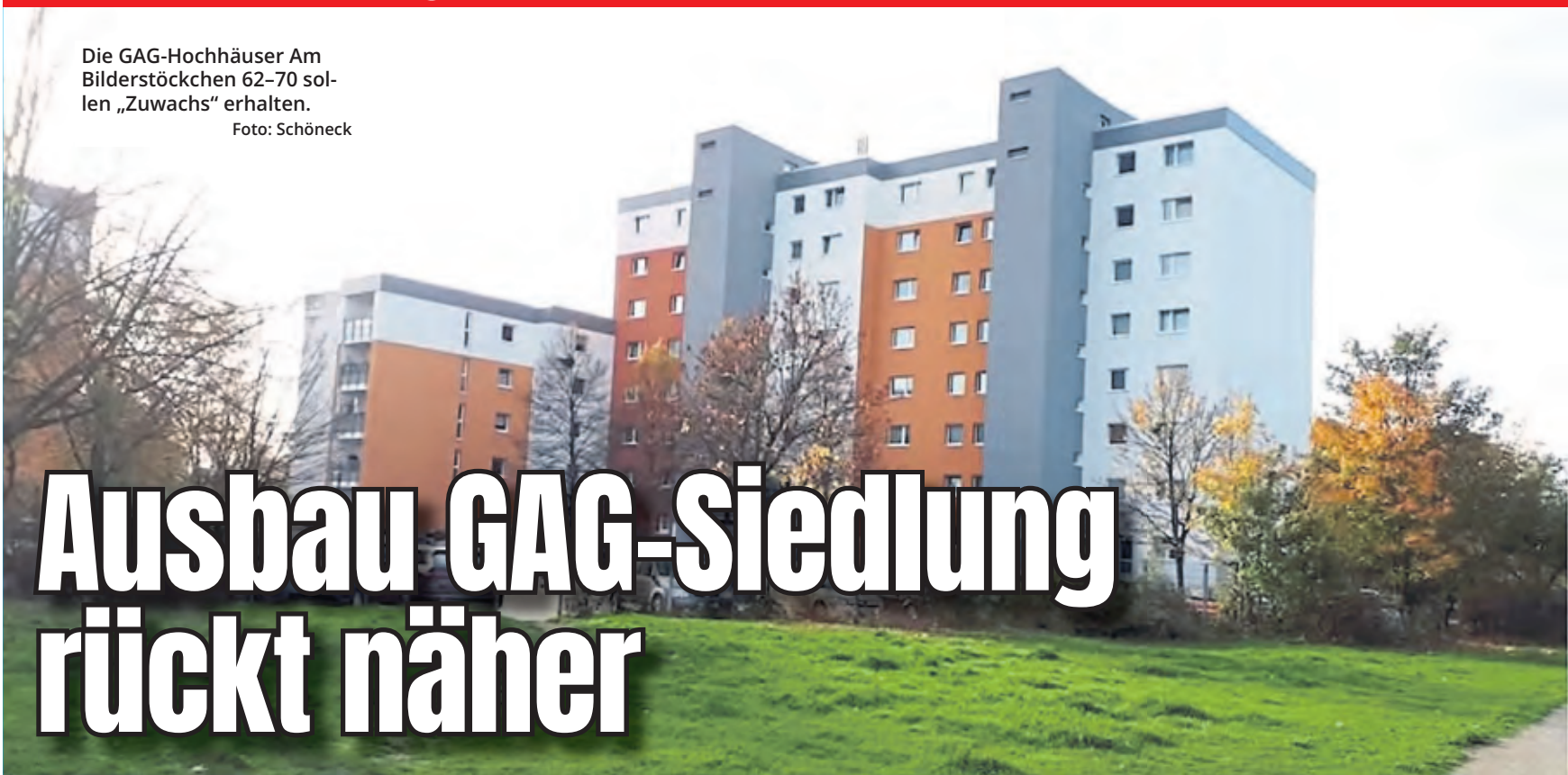
Die GAG-Hochhäuser Am Bilderstöckchen 62-70 sollen „Zuwachs“ erhalten.