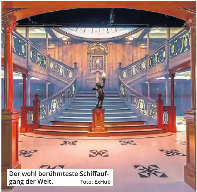
Der wohl berühmteste Schiffaufgang der Welt.

Tickets gibt es ab sofort online unter www.titanic-experience.com