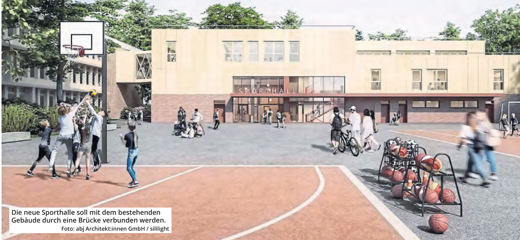
Die neue Sporthalle soll mit dem bestehenden Gebäude durch eine Brücke verbunden werden.

Endlich! Das Johann-Gottfried-Herder-Gymnasium in Buchheim bekommt eine neue Turnhalle. Bevor diese errichtet werden kann, wird das alte Gebäude zunächst