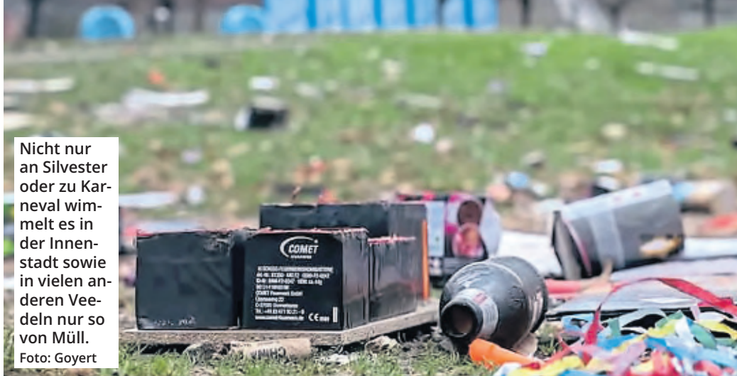
Nicht nur an Silvester oder zu Karneval wimmelt es in der Innenstadt sowie in vielen anderen Veedeln nur so von Müll.

Einige der wichtigsten Eckpunkte des Masterplans sind eine bedarfsgerechtere Reini-