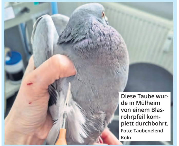
Diese Taube wurde in Mülheim von einem Blasrohrpfeil komplett durchbohrt.

Der Kölner musste sich dafür vor dem Amtsgericht verantworten. Er war wegen Verstoßes gegen das Tierschutzgesetz sowie Jagdschutzgesetz angeklagt. Im Frühjahr waren im Bereich des Mülheimer Bahnhofs immer wieder verletzte Tauben gefunden worden. In ihren Körpern steckten Pfeile beziehungsweise sogenannte Diaboli (Luftgewehr-Projektile), mit denen sie sich offenbar bereits tagelang herumgequält hatten. Vor Gericht wurden dem Kölner jetzt konkret zwei Fälle mit Tauben zur Last gelegt. Die Polizei identifizierte den mutmaßlichen Taubenhasser, nachdem wegen Schüssen auf Tauben mehrere Notrufe eingegangen waren. Einsatzkräfte trafen den 37-Jährigen daraufhin im Bereich Frankfurter Straße/Montanusstraße an. Bei der anschließenden Durchsuchung seiner Wohnung wurden unter anderem ein Luftgewehr sowie Blasrohre sichergestellt.