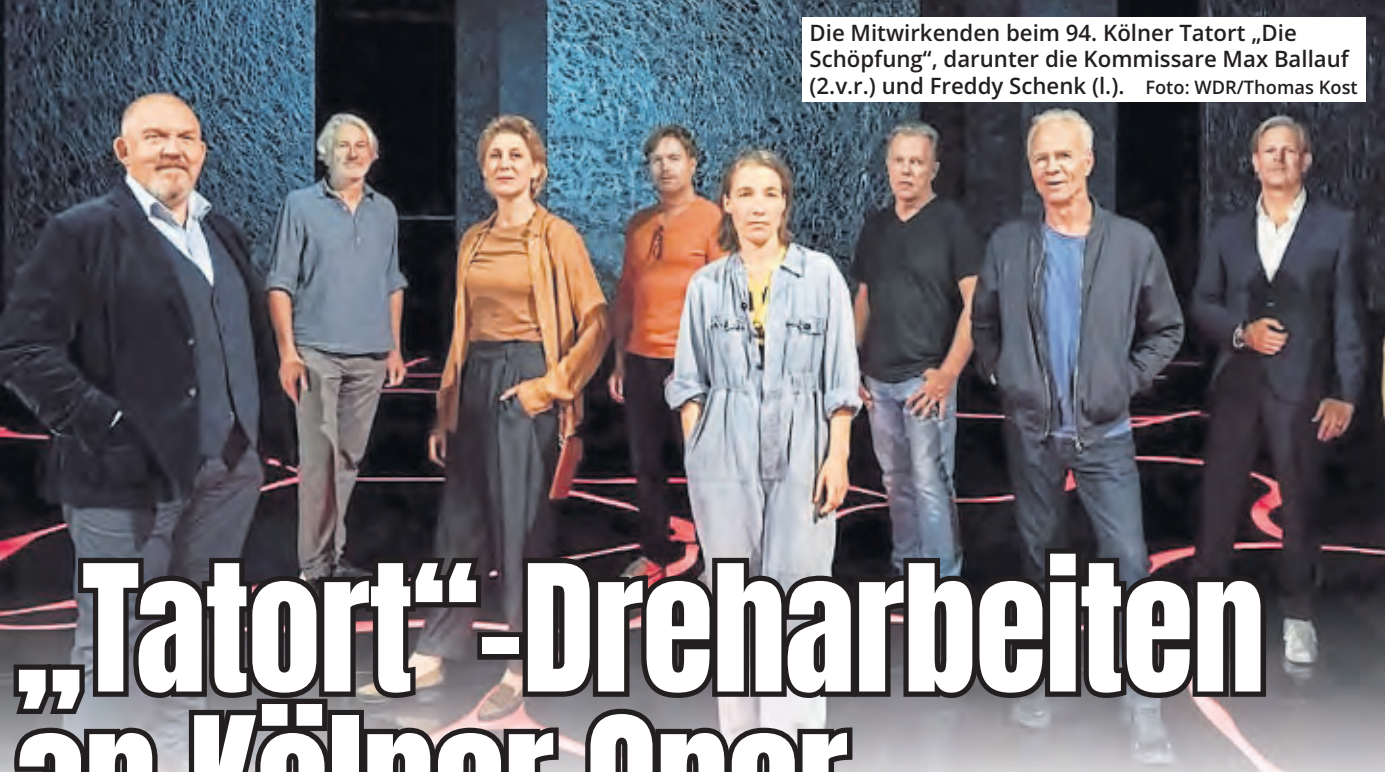
Die Mitwirkenden beim 94. Kölner Tatort „Die Schöpfung“, darunter die Kommissare Max Ballauf (2.v.r.) und Freddy Schenk (l.).