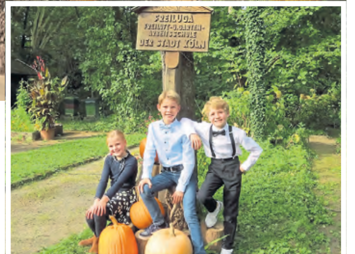
Das Kinderdreigestirn wurde in der Freiluga vorgestellt.