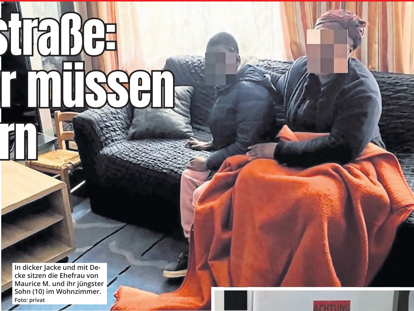
In dicker Jacke und mit Decke sitzen die Ehefrau von Maurice M. und ihr jüngster Sohn (10) im Wohnzimmer.

Damit nicht genug. Die Verwaltung untersagt auch ausdrücklich das Aufstellen von Heizlüftern – aufgrund der veralteten Elektrik in den Häusern! Sie empfiehlt den Bewohnerinnen und Bewohnern daher, sich eine neue Wohnung zu suchen.