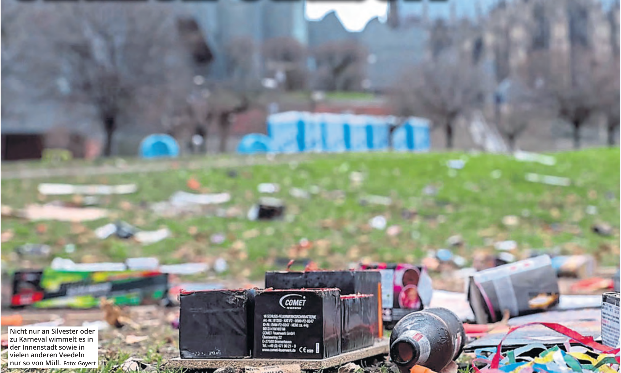
Nicht nur an Silvester oder zu Karneval wimmelt es in der Innenstadt sowie in vielen anderen Vierteln nur so von Müll.