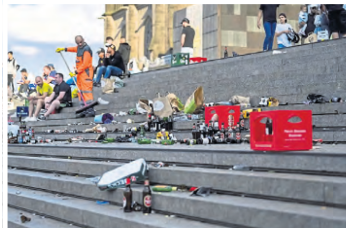
Nach den EM-Spielen sah es am Dom oft so aus.

Um die Domstadt endlich sauberer zu bekommen, haben sich die verantwortlichen Personen zuletzt also einiges einfallen lassen. Mit der Umsetzung des Masterplans soll sich die Situation in Köln dann endlich spürbar verbessern. Doch eines ist dabei klar: Durch kluge Ideen, mehr Geld und öffentlichkeitswirksame Kampagnen alleine wird das Problem nicht behoben werden. Vielmehr sind wir alle gefragt, unsere Stadt möglichst schön aussehen zu lassen, jeden Tag, kontinuierlich, überall.