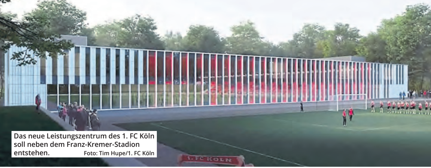
Das neue Leistungszentrum des 1. FC Köln soll neben dem Franz-Kremer-Stadion entstehen.