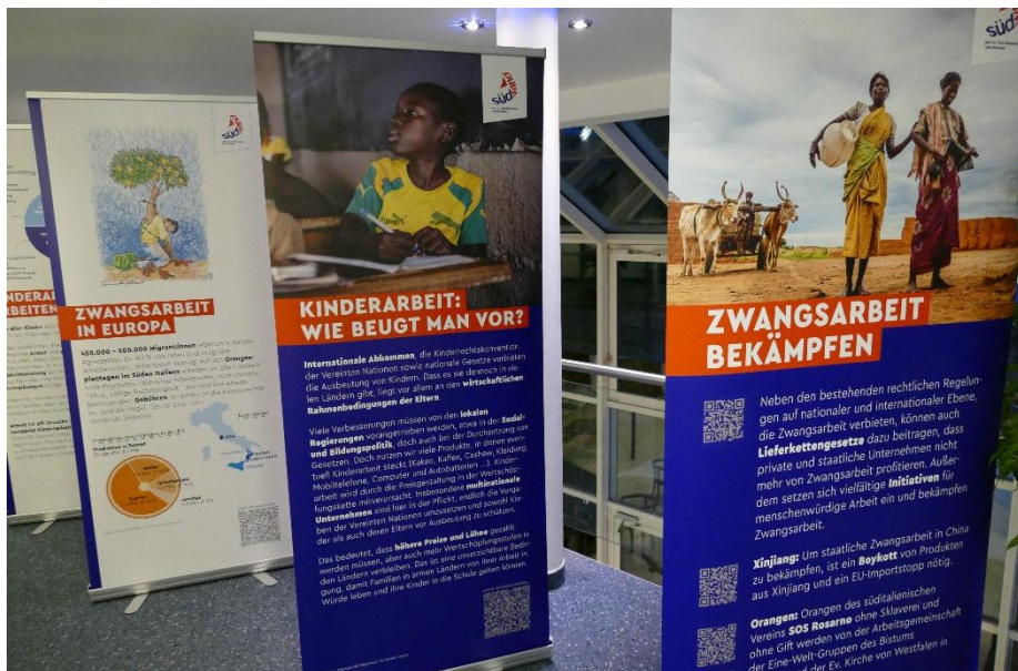
Ausstellungseröffnung im Gustav-Stresemann-Institut in Bonn, November 2022.

Zwangs- und Kinderarbeit in globalen Wertschöpfungsketten – darüber informiert die Ausstellung „Der Freiheit so fern: Kinder- und Zwangsarbeit im 21. Jahrhundert“ mit Fotos und Texten. Sie bietet Zahlen und Zusammenhänge, gibt Einblicke und lässt Betroffene zu Wort kommen.