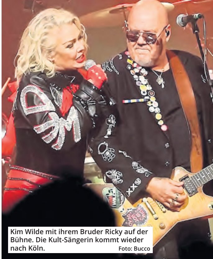
Kim Wilde mit ihrem Bruder Ricky auf der Bühne. Die Kult-Sängerin kommt wieder nach Köln.

Die 80er-Jahre sind wieder mächtig angesagt - zumindest in Sachen Mode, Popkultur und Musik. Jugendliche tragen Vokuhila-Frisur und Oberlippenbart, zudem feiern viele Bands mit 80s-Pop-inspiriertem Sound Riesenerfolge. Die Welle der 80er schwappt derzeit auch durch Köln. Hier sehen Sie, auf welche Stars und auf welche Klassiker sich die Fans freuen können.