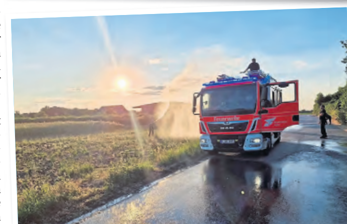
Bei den regelmäßigen Übungen wird auch die Bekämpfung eines Flächenbrandes trainiert.