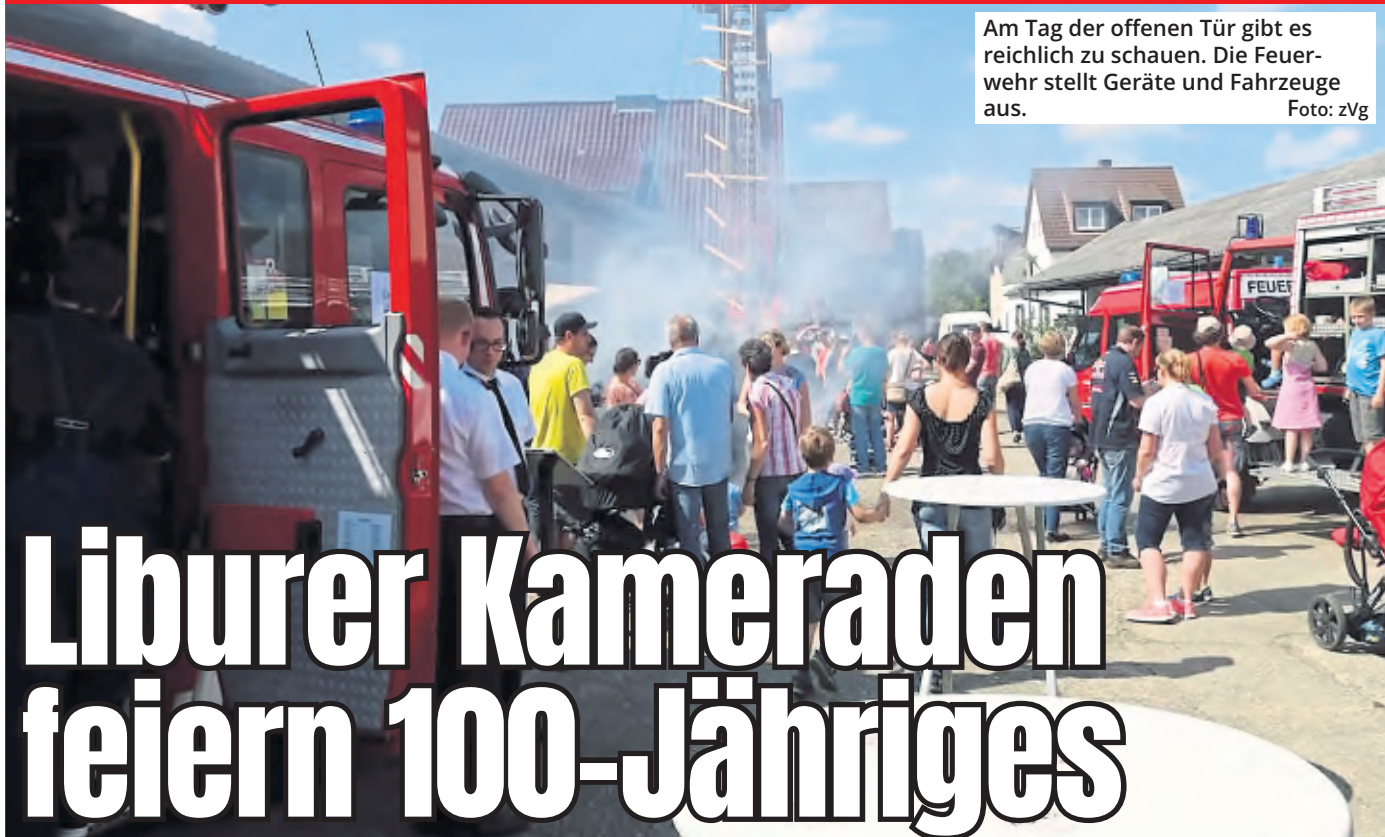
Am Tag der offenen Tür gibt es reichlich zu schauen. Die Feuerwehr stellt Geräte und Fahrzeuge aus.