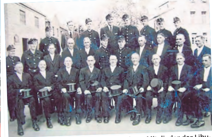
Ein altes Gruppenfoto zeigt die damaligen Mitglieder der Liburer Löschgruppe.