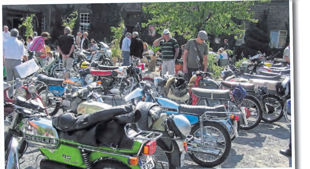
Beim Anblick von Mopeds der Marken Zündapp, Kreidler, Hercules, Victoria, NSU und DKW dürften so einige Besucher in ihre Jugend versetzt werden.