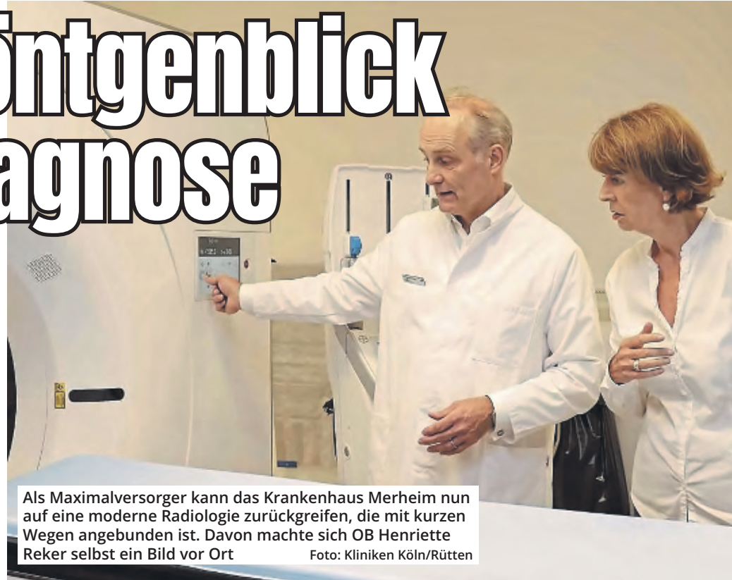
Als Maximalversorger kann das Krankenhaus Merheim nun auf eine moderne Radiologie zurückgreifen, die mit kurzen Wegen angebunden ist. Davon machte sich OB Henriette Reker selbst ein Bild vor Ort.

In dem Neubau, der unmittelbar vor dem Bettenhaus im Parkgelände entstanden ist, sind alle für einen Maximalversorger erforderlichen Röntgengeräte enthalten. Alle Prozesse