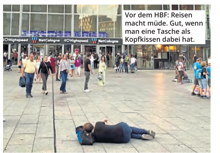
Vor dem HBF: Reisen macht müde. Gut, wenn man eine Tasche als Kopfkissen dabei hat.

Köln. Laissez faire am Dom und sonstwo, so was spricht sich rum: Vielleicht auch deshalb kommt es nun in diesem Sommer und einer zeitweise ausgesprochenen Bullenhitze gehäuft zu solchen Bildern. Leute schlafen bei Tageslicht und umgeben von bisweilen tosendem Alltag einfach auf dem Boden. Die Männer, die wir sehen, halten ein Nickerchen. Es macht nicht den Eindruck, dass es sich um Obdachlose handelt. Der eine Mann hat sich an der KVB-Haltestelle an der Venloer Straße niedergelassen. Ein anderer liegt auf dem Bahnhofsvorplatz und hat sich wohl eine Tasche als Kissen unter den Kopf geklemmt. Einen anderen scheint der Schlaf an der Treppe zur U-Bahnstation Breslauer Platz übermannt zu haben. Stellt sich die Bürgerfrage: Ist das jetzt normal? Oder mit anderen Worten: Ist das eigentlich erlaubt? Kann ich schlafen, wo ich will, vielleicht gleich an Ort und Stelle, wo doch die Sonne den Asphalt ausreichend gewärmt hat? Eine Sprecherin der Stadt klärt darüber auf, was man bei allem Verständnis für schwierige Lebenslagen eigentlich zu beachten hat: „Gemäß Paragraph 11 Kölner Stadtordnung (KSO) stellt solch ein Verhalten eine Ordnungswidrigkeit dar.“