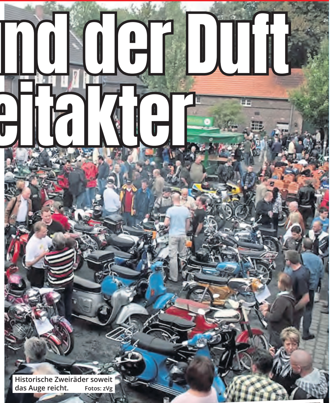
Historische Zweiräder soweit das Auge reicht.

sche Mopeds, Mokicks, Leicht- und Kleinkrafträder aller Marken wie Zündapp, Kreidler, Hercules, Victoria, NSU und DKW werden sich auf den Weg machen, denn das Treffen ist weit über die Stadtgrenzen hinaus bekannt und ebenso be-