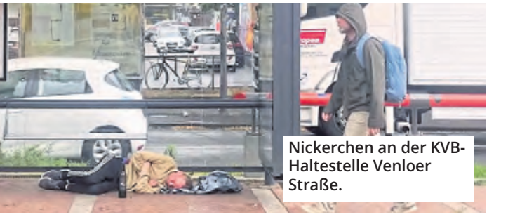
Nickerchen an der KVB-Haltestelle Venloer Straße.