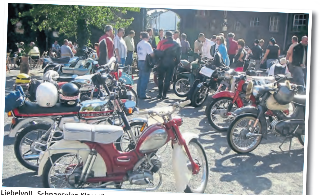
Liebelvoll „Schnapsglas-Klasse“ genannt werden die Zweiräder aufgrund ihres geringen Hubraums.