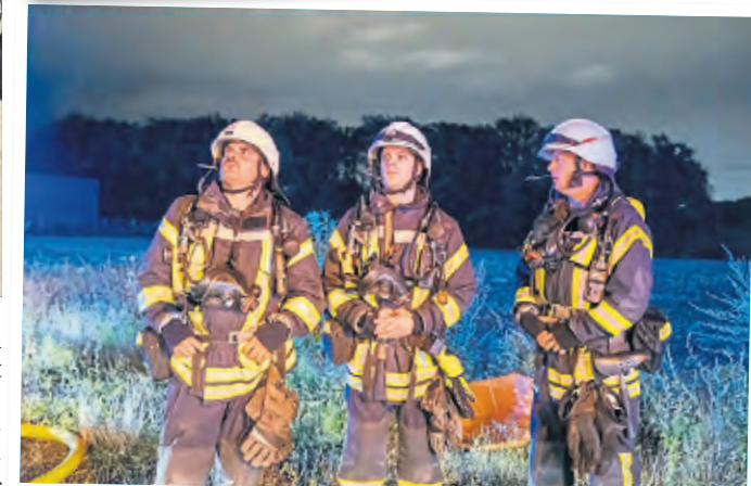
Ein Trupp der heutigen Löschgruppe in ihren Uniformen mit Atemschutzgeräten erkundet die Lage.