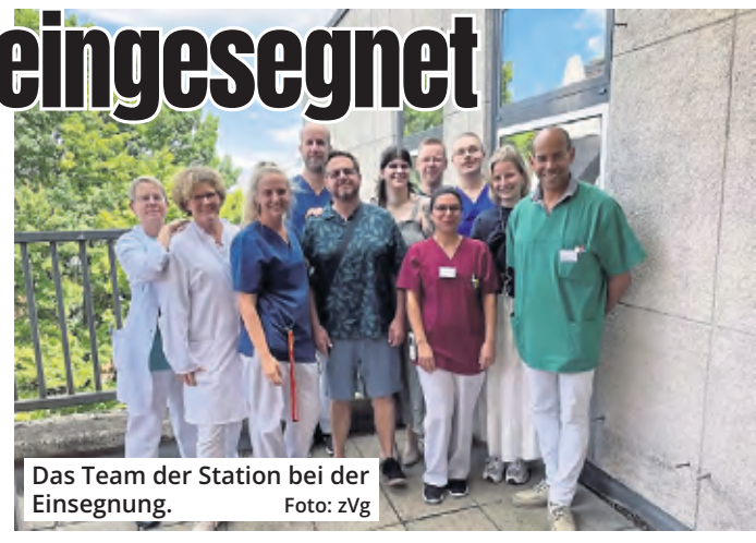
Das Team der Station bei der Einsegnung.

finden Menschen mit chronischen Schmerzen ein interdisziplinäres Behandlungskonzept, das mit Experten der Schmerzmedizin, speziell geschultem Pflegepersonal, Physiotherapeuten, Psychologen, Kunsttherapeuten und Ergotherapeuten auf individuelle Bedürfnisse eingeht und Hilfestellungen gibt, mit den chronischen Schmerzen den Alltag zu meistern.