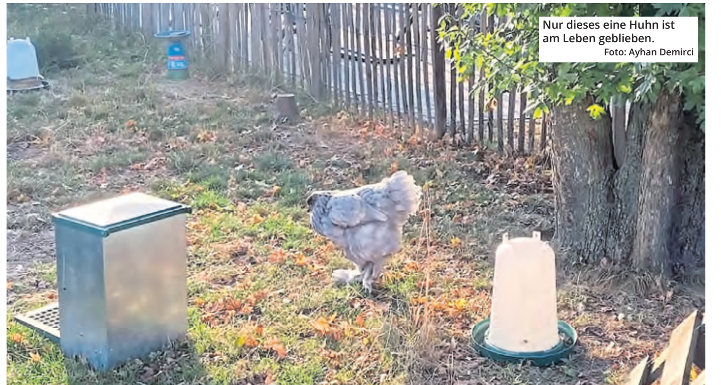
Nur dieses eine Huhn ist am Leben geblieben.