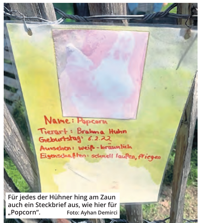
Für jedes der Hühner hing am Zaun auch ein Steckbrief aus, wie hier für „Popcorn“.

„Die Tiere waren für unsere Schüler ein toller pädagogischer Mehrwert“, sagt die Schulleiterin weiter. Daher sei sie froh, dass der Förderverein angekündigt hat, nun für ein größeres und stärkeres Gehege zu sorgen, das den Tieren auch besseren Schutz bieten könne. Es würden jetzt neue Hühner beschafft, um die sich die Gymnasiasten künftig wieder kümmern könnten.