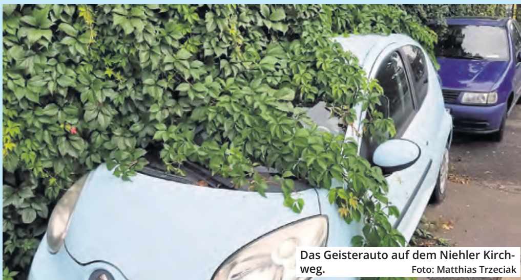
Das Geisterauto auf dem Niehler Kirchweg.

„Es existiert keine Vorschrift, die eine generelle Begrenzung der Parkdauer für Autos festlegt. Somit ist das Dauerparken von Pkw auf öffentlichen Parkplätzen bzw. Straßen erlaubt, sofern dort kein Schild existiert, das die Parkzeit beschränkt“, so das Portal. Allerdings muss das Kennzeichen sichtbar sein und das ist bei dem Kölner Geisterauto nur zum Teil gegeben.