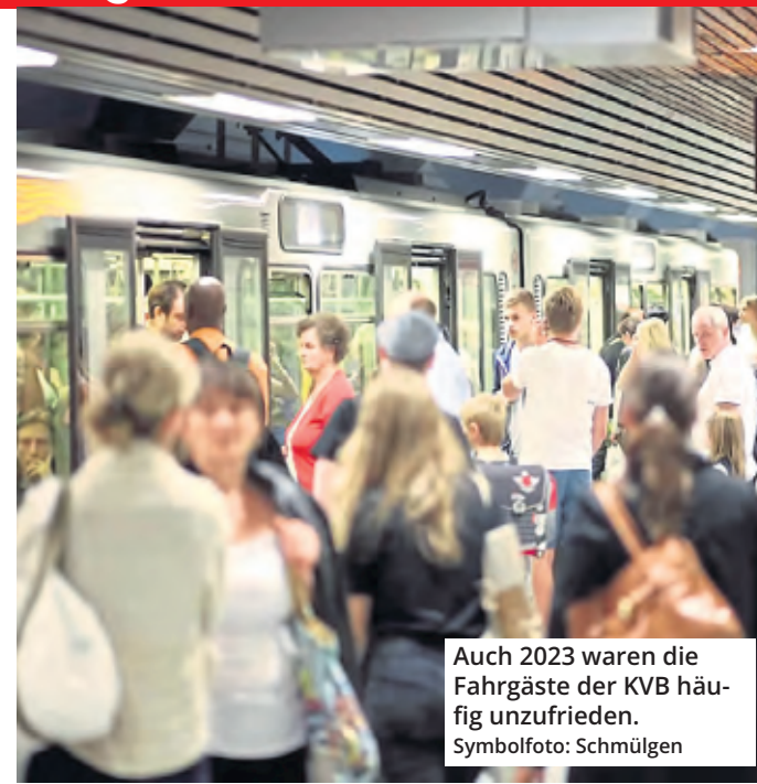
Auch 2023 waren die Fahrgäste der KVB häufig unzufrieden.