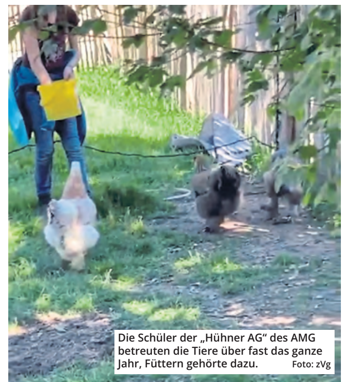
Die Schüler der „Hühner AG“ des AMG betreuen die Tiere über fast das ganze Jahr, Füttern gehörte dazu.