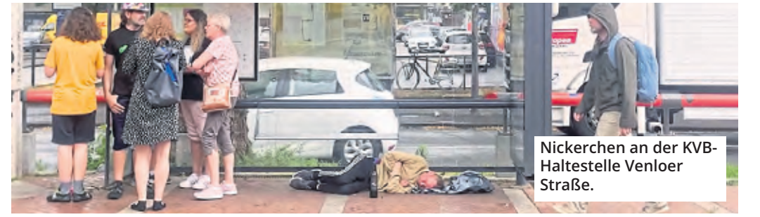
Nickerchen an der KVB-Haltestelle Venloer Straße.