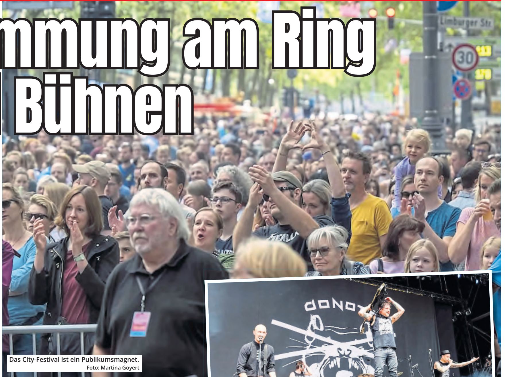
Das City-Festival ist ein Publikumsmagnet.