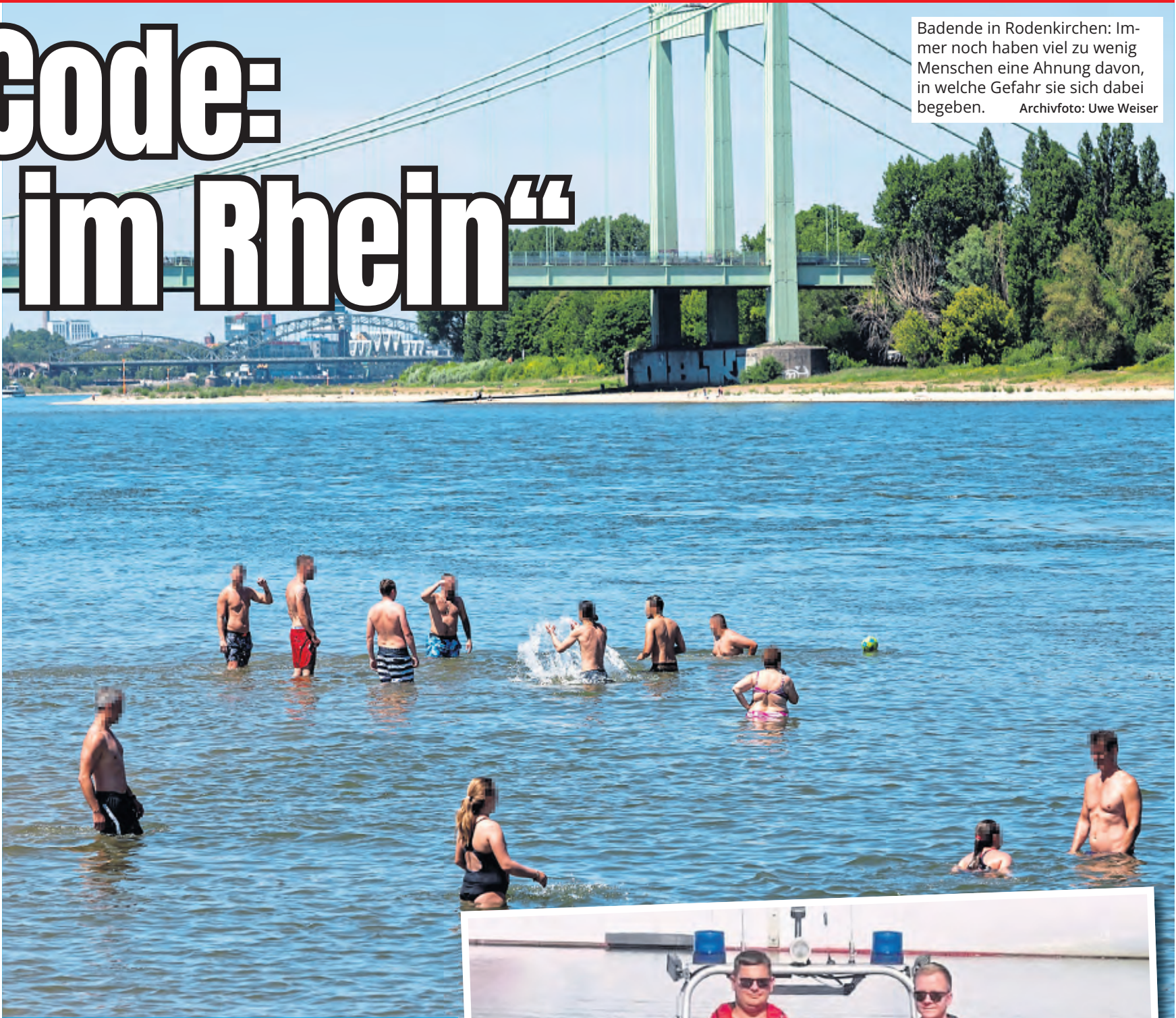
Badende in Rodenkirchen: Immer noch haben viel zu wenig Menschen eine Ahnung davon, in welche Gefahr sie sich dabei begeben.

Auf ihren Patrouillenfahrten stellen die Wasserretter immer wieder fest, dass viele Menschen diese starke Strömung des Rheins unterschätzen. „Selbst geübte Schwimmer kommen nicht dagegen an“, so Lustig. Hinzu komme, dass die großen Rheinschiffe beim Vorbeifahren einen gefährlichen Sog verursachen.