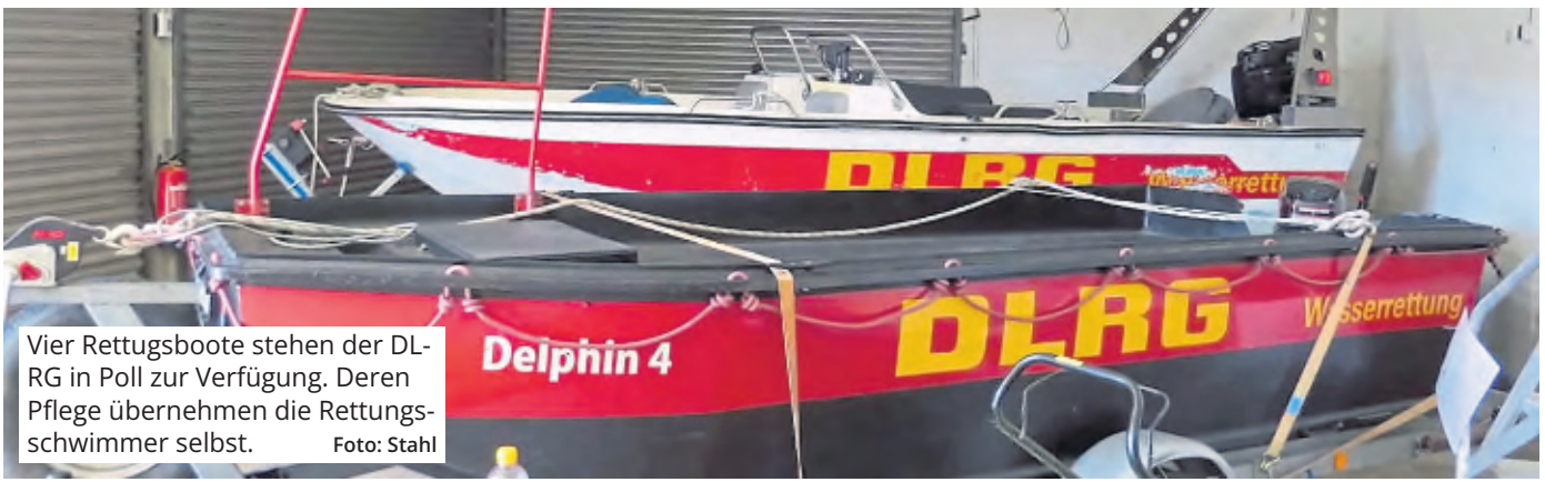
Vier Rettungsboote stehen der DLRG in Poll zur Verfügung. Deren Pflege übernehmen die Rettungsschwimmer selbst.