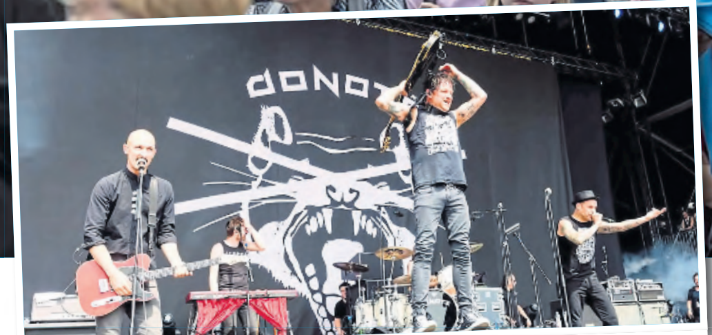
30 Jahre Donots: Die Punkrockers aus Ibbenbüren werden dem Ring einheizen. Mit dabei sind außerdem Brings, Eko Fresh, Cat Ballou, Miljö und die Kölner Musikerinitiative „Arsch huh – Zäng Ussenander“.

garten und die Westseite in eine Tanzfläche verwandelt. Auf dem „Open Deck“ (Doppeldecker-)Bus Cologne finden zweitägige DJ-Sessions statt: Am Samstag legt das Hamburger Duo E.Q.T. auf, am Sonntag ab