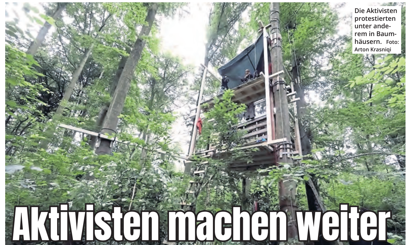
Die Aktivisten protestierten unter anderem in Baumhäusern.