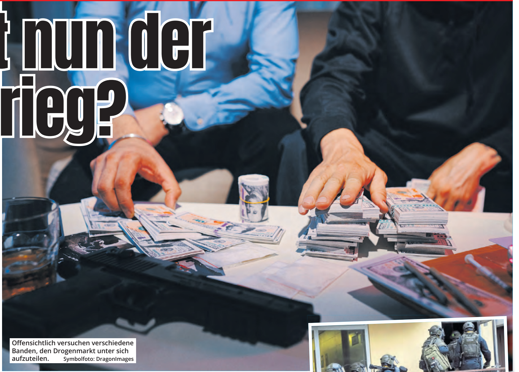
Offensichtlich versuchen verschiedene Banden, den Drogenmarkt unter sich aufzuteilen.

Zuvor hatte es mehrere Explosionen in Köln (29. und 30. Juni) und Engelskirchen (1. Juli) gegeben, unter anderem knallte es auf der Keupstraße. Die Polizei ging schnell davon aus, dass die Taten in Zusammenhang stehen. Verletzt wurde zum Glück niemand. Wenige Tage später dann die Befreiungsaktion der beiden Geiseln in Rodenkirchen. Direkt anschließend war es zu weiteren Einsätzen – überwiegend im rechtsrheinischen Köln – gekommen, bei denen Spezialein-