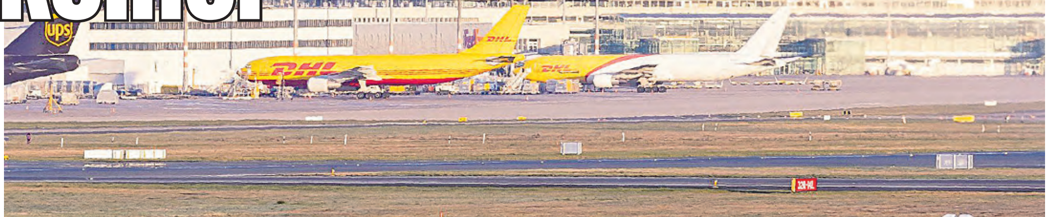
Besonders viele Flugzeuge heben in den Sommerferien von Köln aus Richtung Antalya ab.

Köln. Klar wird mit einem Blick auf die Daten des Flughafens Köln/Bonn: Die Domstädter zieht es ins Warme. Schließlich werden die Ziele Antalya, Mallorca, Istanbul oder Barcelona besonders häufig angesteuert. Wenig überraschend sind bei den Kölner Fluggästen die Reiseländer Türkei und Spanien besonders beliebt. Zudem stehen Italien, Griechenland und Marokko hoch im Kurs. Komplettiert wird die Top 10 der beliebtesten Kölner Flugreise-Länder letztlich von Kroatien, Portugal, Ägypten, Bulgarien und Albanien, wo es in den Ferien ebenfalls besonders warm ist.