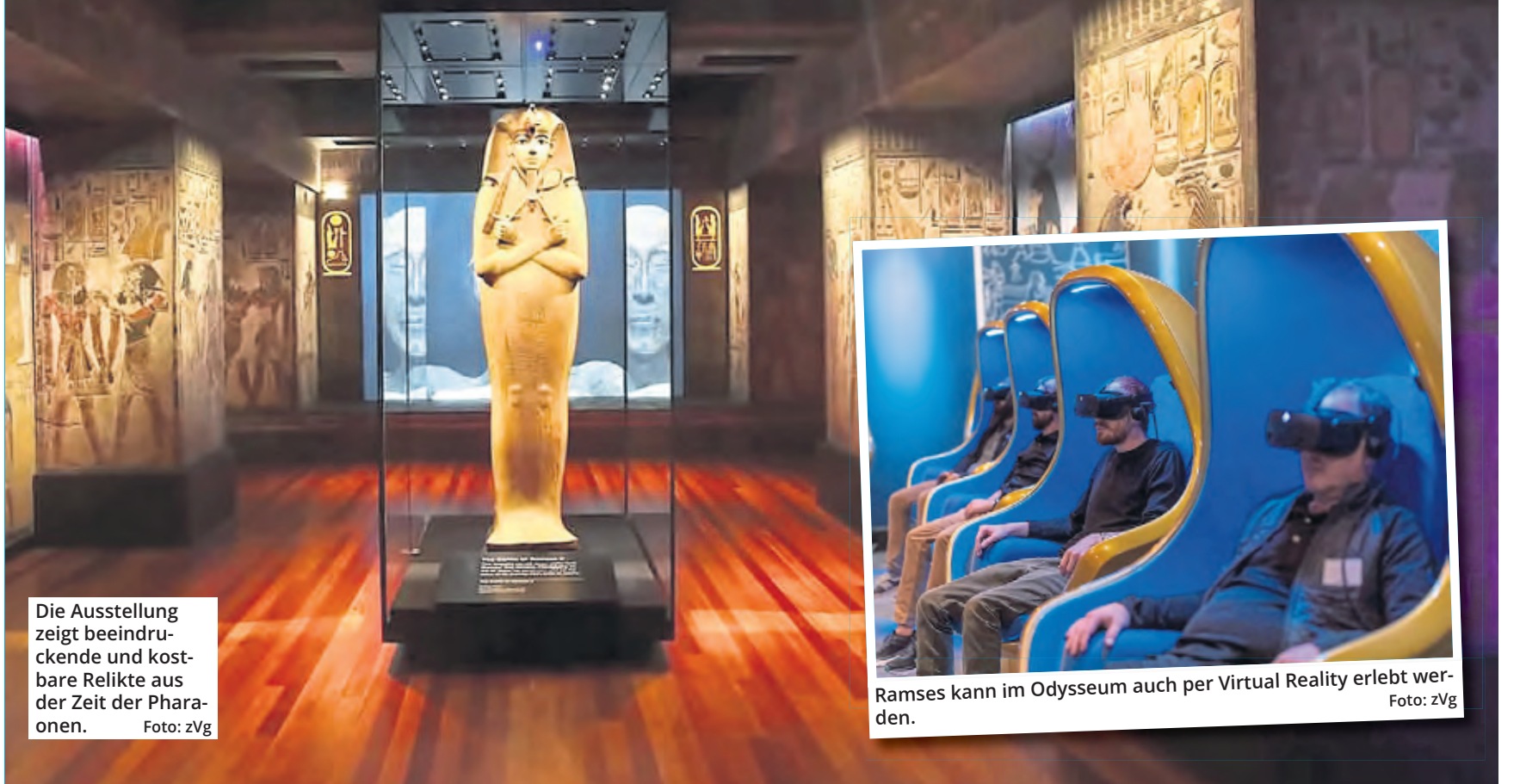
Die Ausstellung zeigt beeindruckende und kostbare Relikte aus der Zeit der Pharaonen.