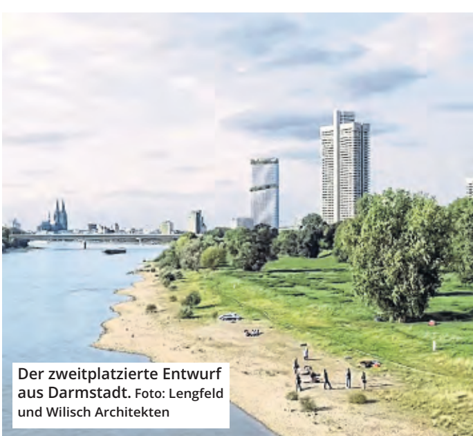
Der zweitplatzierte Entwurf aus Darmstadt. Foto: Lengfeld und Wilsch Architekten

Bis dahin könnte die Sanierung der alten DEVK Zentrale am heutigen Standort fast abgeschlossen sein. Ab Juli ziehen die Beschäftigten vorübergehend in die Rheinpark-Metropole nach Deutz, während das Gebäude in der Riehler Straße 190 renoviert wird. Um die Hochhaus-Pläne am Rheinufer wird seit Jahren in der Politik gerungen und gestritten. Klares Signal: Zwischenzeitlich drohte die DEVK, ihren neuen Firmensitz in einer anderen Stadt zu bauen.