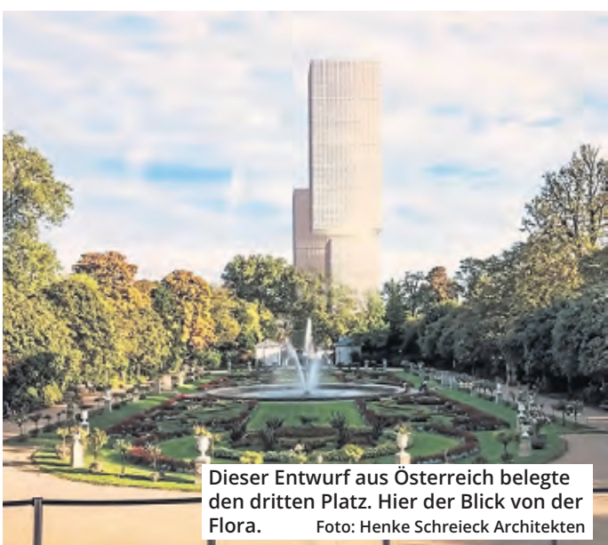
Dieser Entwurf aus Österreich belegte den dritten Platz. Hier der Blick von der Flora.