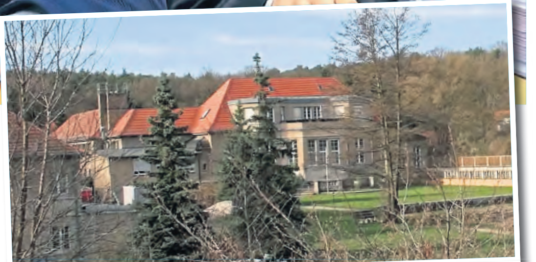
In der Villa Adlon am Lehnitzsee in Potsdam fand das rechte Geheimtreffen statt.