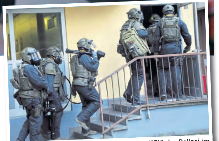
Ein Einsatz des Sondereinsatzkommandos (SEK) der Polizei im Juni 2018 in Köln-Chorweiler.

on in Duisburg-Hochemmerich in der Nacht zu vergangenen Freitag. Ob Verbindungen zu einer Explosion in Solingen am 25. Juni bestehen, sei ebenfalls Gegenstand der Ermittlungen, heißt es. Der Polizeisprecher: „Die intensiven Ermittlungen, die auch in die Niederlande führen, dauern an.“