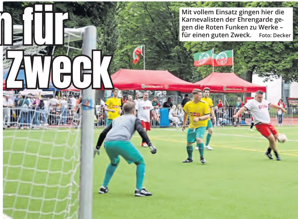
Mit vollem Einsatz gingen hier die Karnevalisten der Ehrengarde gegen die Roten Funken zu Werke – für einen guten Zweck.

Köln. Auch wenn die deutsche Nationalmannschaft gegen Spanien im Viertelfinale der EM ausgeschieden ist, haben vergangene Wochenenden in Köln jede Menge Fußballbegeisterte alles gegeben, um die „Traditions-Cup-Meisterschale“ mit nach Hause zu nehmen.