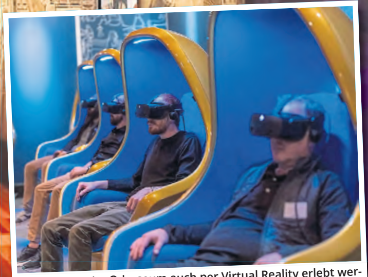
Ramses kann im Odysseum auch per Virtual Reality erlebt werden.

Kalk. Zusammen mit dem ägyptischen Ministerium für Tourismus und Altertümer sowie Neon Global wird die einzigartige Ausstellung „Ramses & das Gold der Pharaonen“ erstmals in Deutschland in Köln präsentiert.