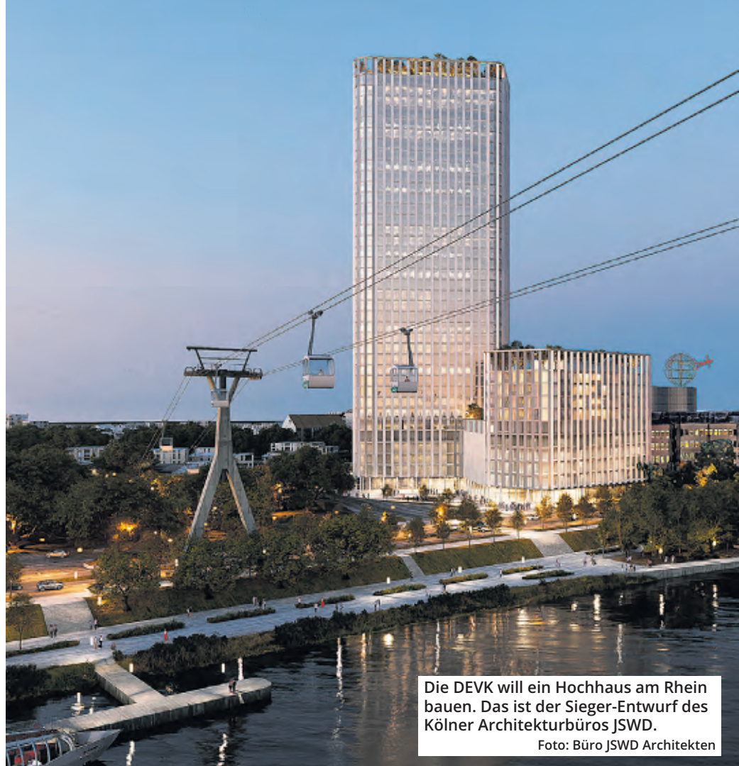
Die DEVK will ein Hochhaus am Rhein bauen. Das ist der Sieger-Entwurf des Kölner Architekturbüros JSWD. Foto: Büro JSWD Architekten

Wichtige Kriterien sind außerdem die harmonische In-