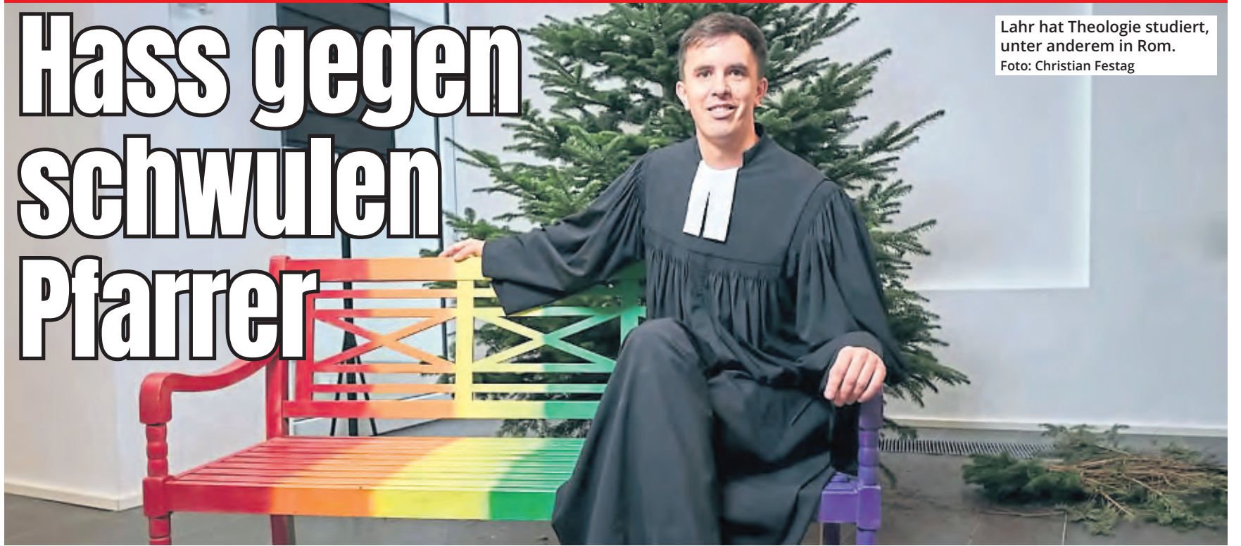
Lahr hat Theologie studiert, unter anderem in Rom.