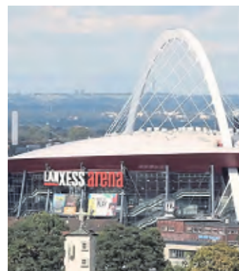
Saisonstart von Kroos' Hallenfußball-Liga wird in der Kölner Arena sein.

Seit dem 8. Juli ist auch offiziell, dass die Icon League in der größten Veranstaltungshalle Deutschlands starten wird: Der erste Spieltag findet am 1. September in der Kölner Lanxess-Arena statt (Tickets sind ab sofort im VVK zu haben). Die weiteren Spieltage sollen dann, genau wie bei der Baller League, montags ausgetragen werden.