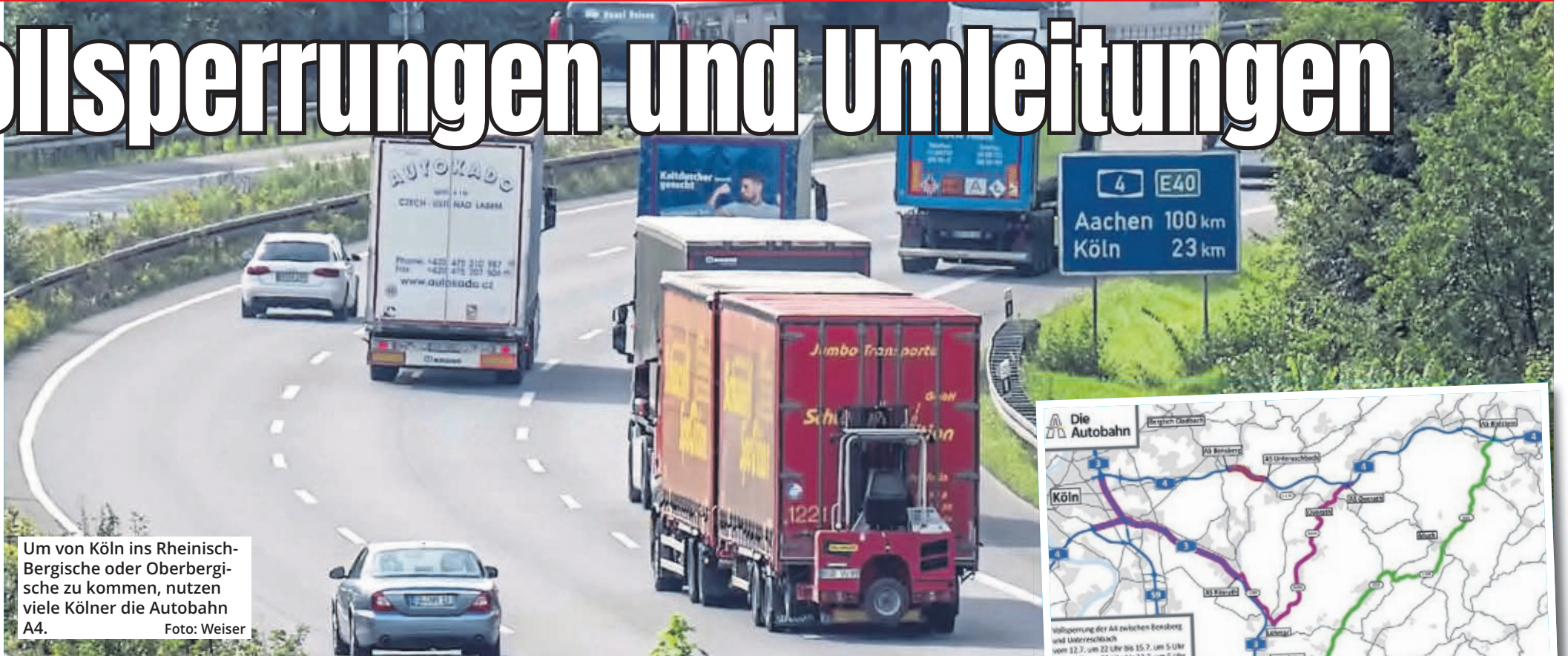
Um von Köln ins Rheinisch-Bergische oder Oberbergische zu kommen, nutzen viele Kölner die Autobahn A4.

sind Arbeiten an einer alten Brücke der A4. Diese muss gestützt werden, bevor sie abgerissen wird. Daher darf es keine Erschütterungen geben, die durch den Verkehr verursacht werden könnten.