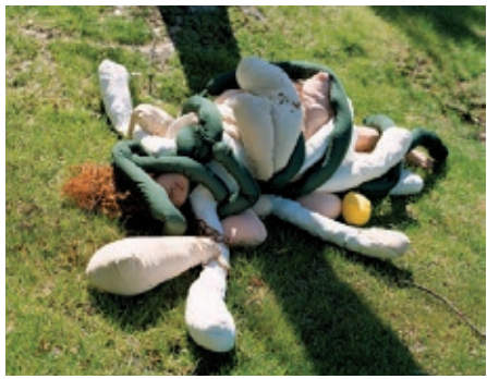
Janaina Tschäpe, „Ovalaria“ SOS-Edition 2011, Auflage: 20+3, nummeriert und signiert, Digitaler C-Print, 40,8 x 33 cm

Bekannte Künstler haben exklusiv für die SOS-Kinderdörfer Werke geschaffen. Mit dem Kauf eines limitierten Kunstwerks auf www.sos-edition.de unterstützen Sie Projekte der SOS-Kinderdörfer weltweit.