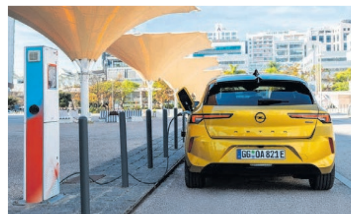
Animieren, auf die E-Mobilität umzusteigen

„Wir bringen die E-Mobilität auf die Straße – mit einer breiten Auswahl an vollelektrischen und elektrifizierten Modellen für alle Bedürfnisse und Anforderungen. Genauso wichtig sind aber auch attraktive Angebote, die Käufer dazu animieren, auf die Elektromobilität umzusteigen. Mit der Gratis-Zugabe einer Wallbox zum Laden zuhause oder am Arbeits-