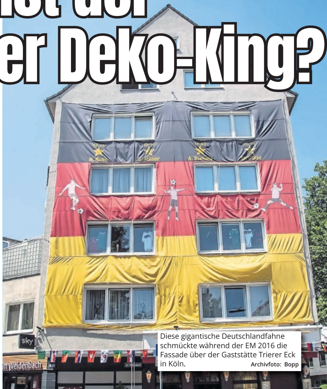
Diese gigantische Deutschlandfahne schmückte während der EM 2016 die Fassade über der Gaststätte Trierer Eck in Köln.

wichtig: Wir suchen nicht nur Deutschland-Deko! In Köln leben Menschen aus 180 verschiedenen Nationalitäten. Auch von den jetzt noch verbliebenen 16 Mannschaften