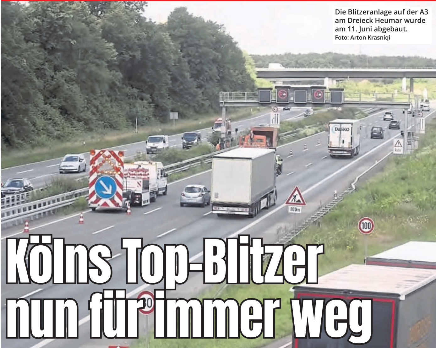
Die Blitzeranlage auf der A3 am Dreieck Heumar wurde am 11. Juni abgebaut.

Sie hat eine bewegte Geschichte – jetzt ist sie selbst Vergangenheit. Die Radaranlage auf der A3 am Dreieck Heumar, Kölns wohl bekanntester Blitzer, ist nicht mehr da. Am 11. Juni wurde die Anlage abgebaut. Arbeiter hatten dafür vor Ort teilweise eine Spur gesperrt und den Verkehr vorbeigeleitet.