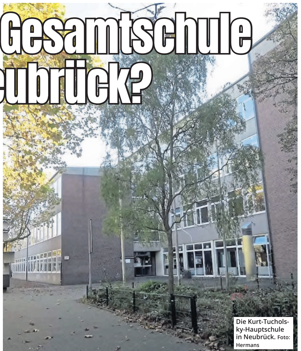
Die Kurt-Tucholsky-Hauptschule in Neubrück.

Sollten diese gar nicht oder zentrumsnah in Hum-