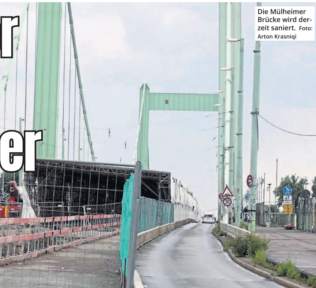
Die Mülheimer Brücke wird derzeit saniert.

Seit dem 5. Februar 2024 ist die Brücke in Fahrtrichtung Mülheim für neun Monate für den Autoverkehr gesperrt. Das Gesamtprojekt soll erst 2026 abgeschlossen sein. Teile der Brücke werden abgerissen und neu gebaut, alle übrigen Bereiche der 1951 eingeweihten Brücke werden grundhaft saniert und verstärkt. (mit tw.)