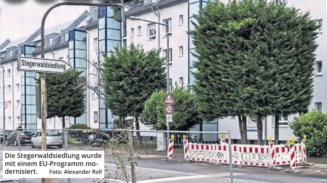
Die Stegerwaldsiedlung wurde mit einem EU-Programm modernisiert.

Mit dem EU-Projekt „Grow Smarter“ (EU-Haushalt 2015