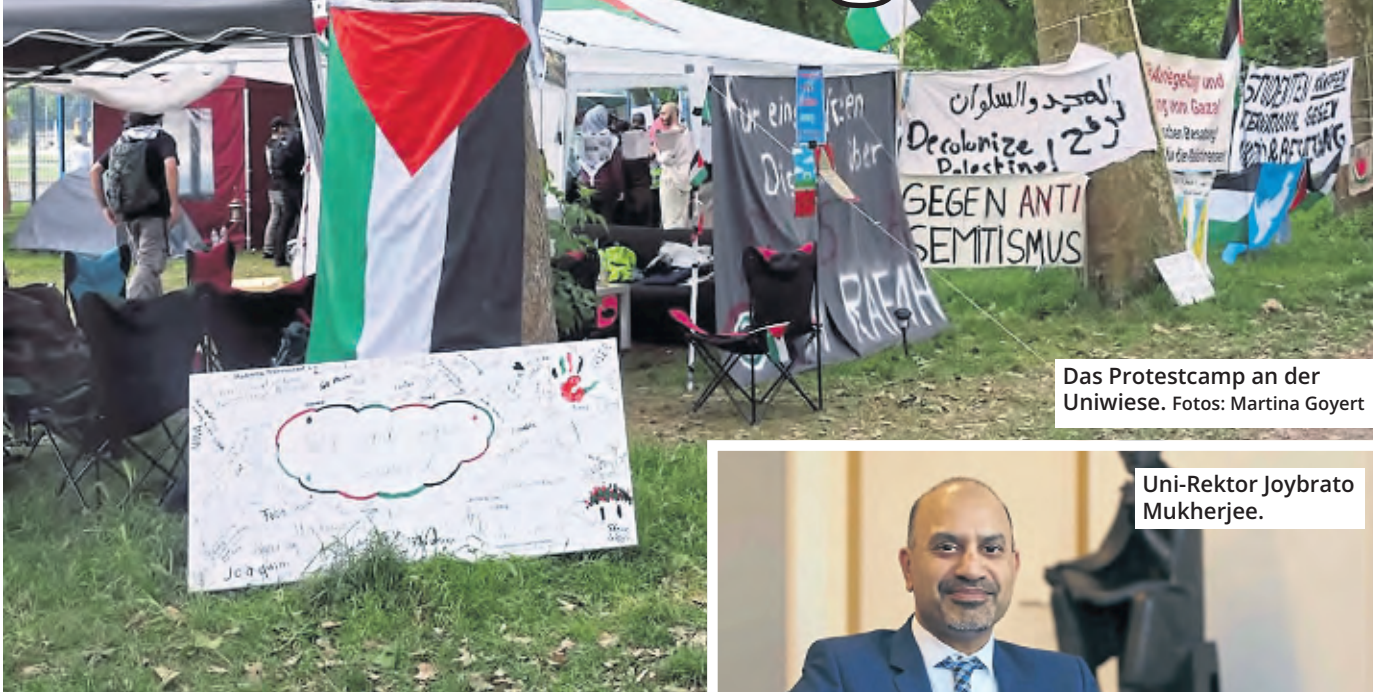
Das Protestcamp an der Uniwiese.

Mehrere Bündnisse wie Kölner und Kölnerinnen gegen Antisemitismus, Bündnis gegen Antisemitismus Köln und Klare Kante Köln fordern einen Stopp des Pro-Palästina-Camps an der Uniwiese. In einem offenen Brief werfen sie der Universitätsleitung und der Stadtspitze um Oberbürgermeisterin Henriette Reker Untätigkeit vor.