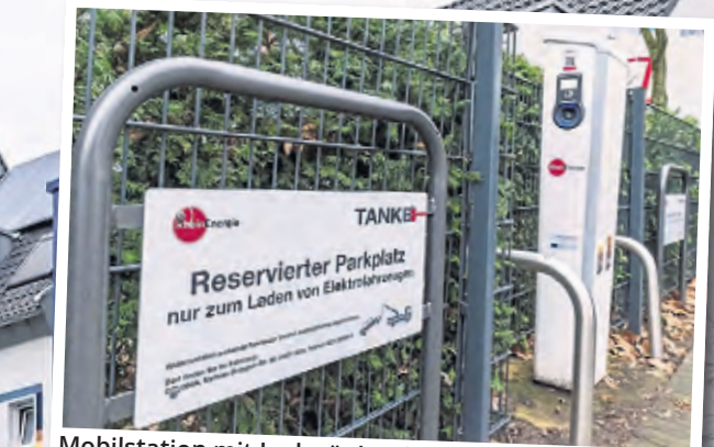
Mobilstation mit Ladesäulen für E-Autos. Die Ladesäulen werden durch die Solarzellen auf den Dächern der Wohnsiedlung mit Strom versorgt.

Neben relativ einfachen Angeboten, wie das Austauschprogramm ERASMUS für Studierende, bietet die EU Zuwendungen aus den sogenannten Struktur- und Kohäsionsfonds an. Lukrativer ist die Teilnahme an reinen EU-Projekten wie „Grow Smarter“. Katja Reuter: „Reine EU-Anträge sind sehr aufwendig und die Erfolgsquote ist sehr gering. Die Antragstellung erfordert viel Know-how und viele Zeit- und Personalressourcen. Aus diesem Grund haben sich bereits mehrere Agenturen gegründet, die sich darauf spezialisiert haben, bei der Antrag-