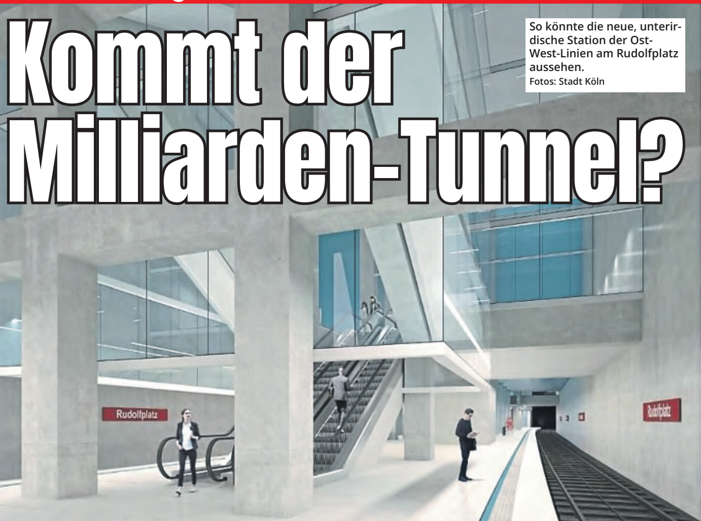
So könnte die neue, unterirdische Station der Ost-West-Linien am Rudolfplatz aussehen.

In Köln steht eine „Jahrhundert-Entscheidung“ an, die prägend ist für das Aussehen der Innenstadt und für die Zukunft der Mobilität in der ganzen Stadt. Soll in der Innenstadt zwischen Heumarkt und Aachener Weiher ein neuer U-Bahn-Tunnel gebaut werden? Oder sollen sich die dann 90 Meter langen KVB-Bahnen oberirdisch durch das Stadtzentrum schlängeln? Köln. Ein Expertengremium kommt in seiner Untersuchung jetzt zu dem Schluss, dass mehr Argumente für einen Tunnelbau als für die alternative oberirdische Lösung sprechen. Das geht aus der von Oberbürgermeisterin Henriette Reker vorgestellten Beschlussvorlage für den Ausbau auf der Ost-West-Achse hervor. Das Expertenteam – bestehend aus 20 Mitarbeitern von Stadt Köln und Kölner Verkehrs-Betrieben (KVB) sowie 70 Experten externer Gutachter- und Ingenieurbüros – hat beide Varianten gleichberechtigt untersucht und auch Bürger und Anwohner über öffentliche Veranstaltungen einbezogen. Insgesamt nahmen sie 33