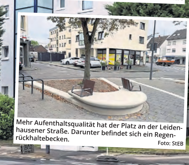
Mehr Aufenthaltsqualität hat der Platz an der Leidenhausener Straße. Darunter befindet sich ein Regenrückhaltebecken.

stellung und Formulierung zu unterstützen.“ Trotz der vagen Erfolgsaussichten hebt die Stadt einen Nebeneffekt als positiv hervor: EU-Projekte bieten immer die Gelegenheit zum direkten Austausch mit anderen Kommunen in Europa. Eine willkommene Gelegenheit, sich zu vernetzen, Synergien zu schaffen und voneinander zu lernen. Fraglich, ob sich Köln und andere Metropolen des Kontinents zum Netzwerk EUROCITIES ohne den Rahmen der EU zusammengefinden hätten.