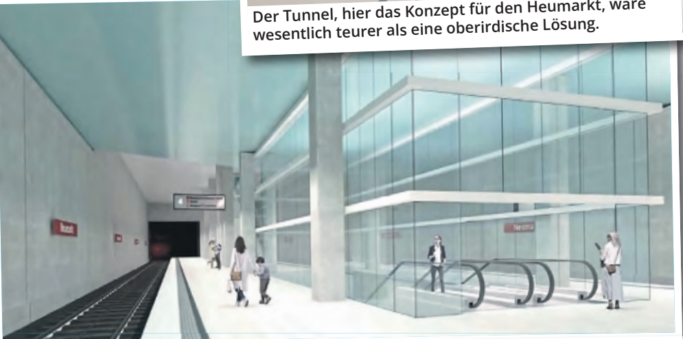
Für die neue U-Bahn-Haltestelle am Neumarkt sieht der Entwurf eine luftige, helle Bauweise mit vielen Glasflächen vor.