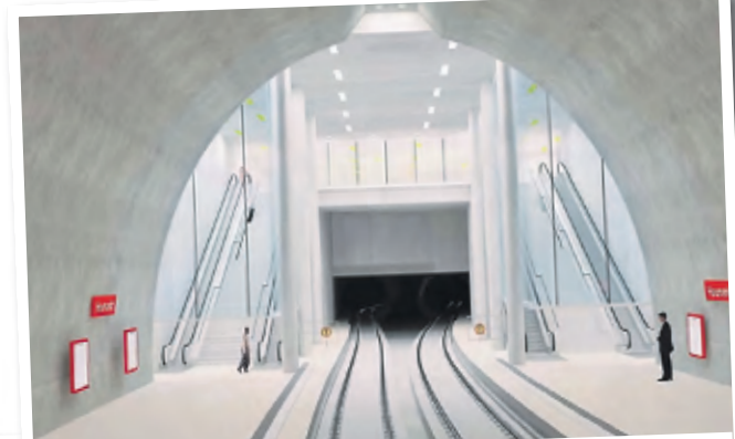
Der Tunnel, hier das Konzept für den Heumarkt, wäre wesentlich teurer als eine oberirdische Lösung.