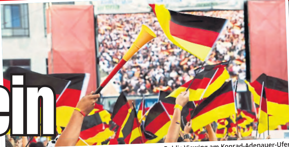
Die Anwohner fühlen sich durch die Planungen zum Public Viewing am Konrad-Adenauer-Ufer überrumpelt, nun haben sie ihren Frust ausgesprochen.

Zusätzlich könnte auch eine EM-Euphorie rund um die deutsche Mannschaft zu weiteren Public-Viewing-Events am Rheinufer führen – wenn unsere Elf weit kommt.