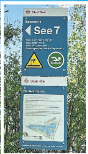
Hinweisschild für eine Badestelle am Fühlinger See.