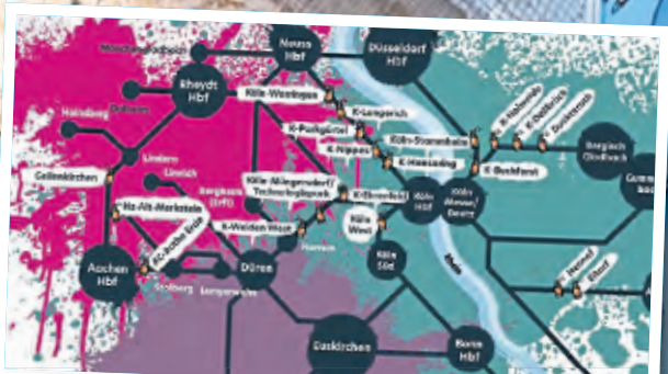
Eine bunte Karte gibt Überblick und ist auf der neuen Homepage zu finden. Grafik: go.Rheinland