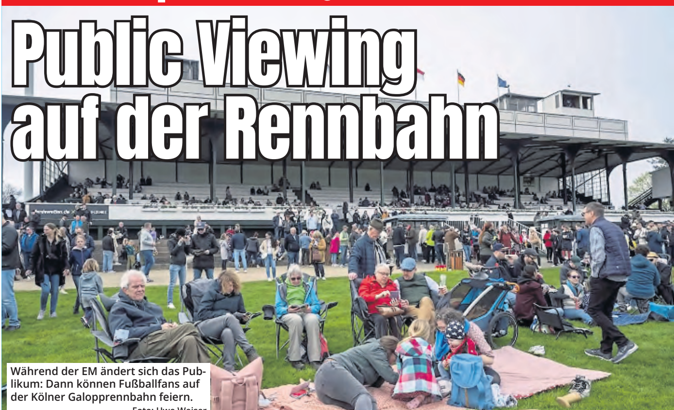
Während der EM ändert sich das Publikum: Dann können Fußballfans auf der Kölner Galopprennbahn feiern.

Es werden immer mehr EM-Partys. Köln bekommt neben den offiziellen Fanparty-Zonen am Heumarkt, Tanzbrunnen und Rheinufer ein weiteres Public Viewing zur Fußball-Europameisterschaft: Auch auf der Galopprennbahn in Weidenpesch wird das „Rudelgucken“ möglich sein. Der Vorverkauf ist bereits gestartet.