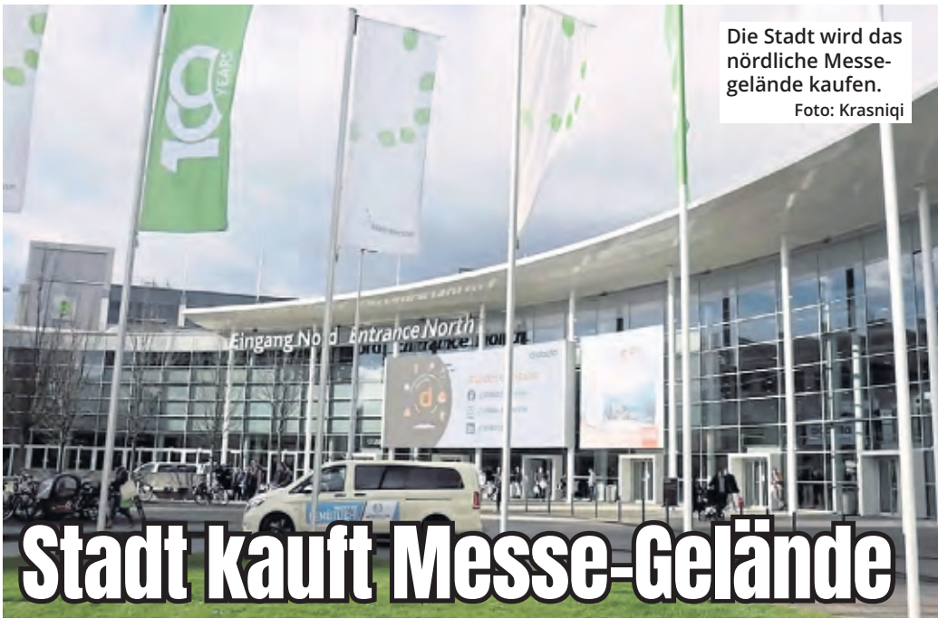
Die Stadt wird das nördliche Messengelände kaufen.

Dementsprechend wäre die logische Konsequenz für den Klub, dass er jetzt in der zweiten Liga den nächsten Schritt seiner Entwicklung gehen kann. Doch die Hallensituation in Köln lässt dieses Wachstum womöglich nicht zu - wieder einmal.