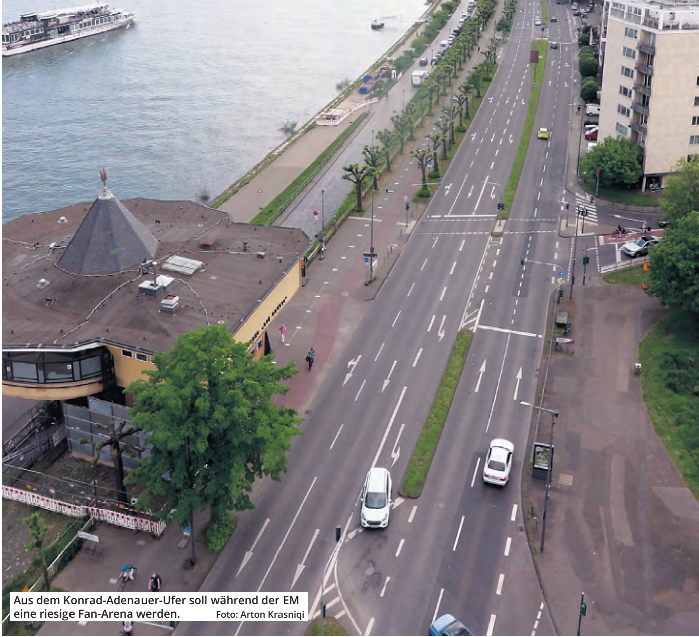
Aus dem Konrad-Adenauer-Ufer soll während der EM eine riesige Fan-Arena werden.

Es war ein Überraschungs-Knaller in den EM-Planungen der Stadt Köln: Relativ kurzfristig musste eine weitere Public-Viewing-Fläche her. Und die wurde am Konrad-Adenauer-Ufer gefunden. Gegen die riesige Fan-Arena gibt es allerdings Proteste.