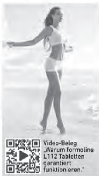
Video-Beleg „Warum formoline L112 Tabletten garantiert funktionieren.“

Das bewährte Schlankheitsmittel aus der Apotheke – formoline L112 – ist das einzige Medizinprodukt zum Abnehmen mit