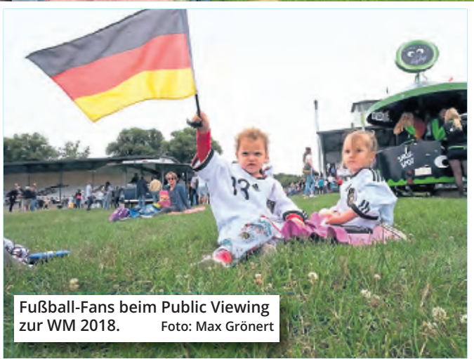
Fußball-Fans beim Public Viewing zur WM 2018.

Tickets für die Zuschauer-Wiese gibt es für 5 Euro, für 10 Euro kann man einen Platz auf der Tribüne buchen. Eine Vier-