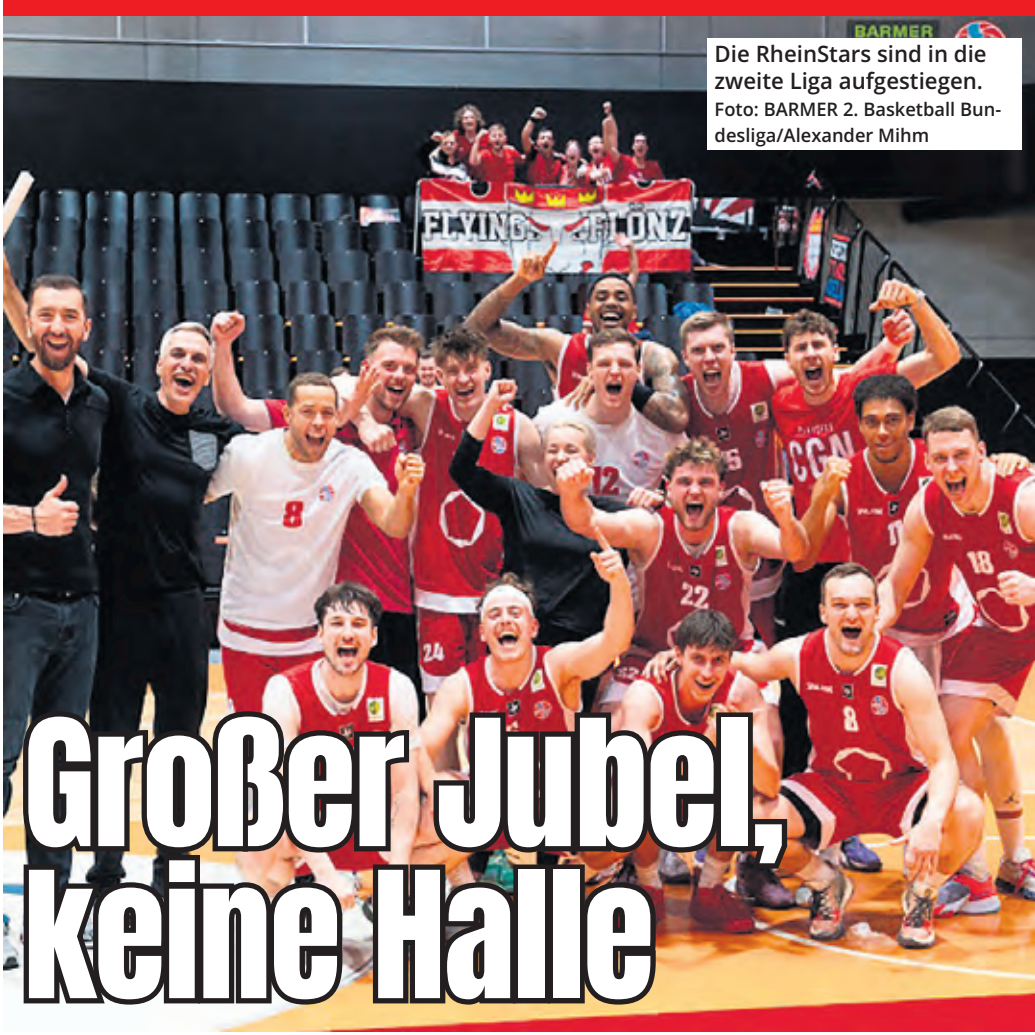
Die RheinStars sind in die zweite Liga aufgestiegen.