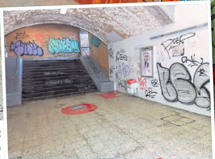
Diesen verschmierten und versifften Vorher-Anblick kennt man auch von anderen Bahnhöfen.