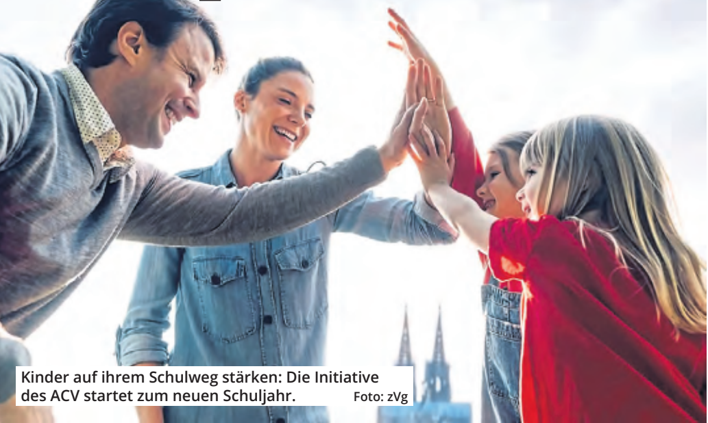
Kinder auf ihrem Schulweg stärken: Die Initiative des ACV startet zum neuen Schuljahr.

Der Automobil-Club Verkehr (ACV) verfolgt den Anspruch, nachhaltigster Automobilclub Deutschlands zu sein. Dabei stehen nicht nur ökologische Ziele im Fokus. Der Club setzt sich auch für eine Steigerung der Verkehrssicherheit auf den Straßen ein.