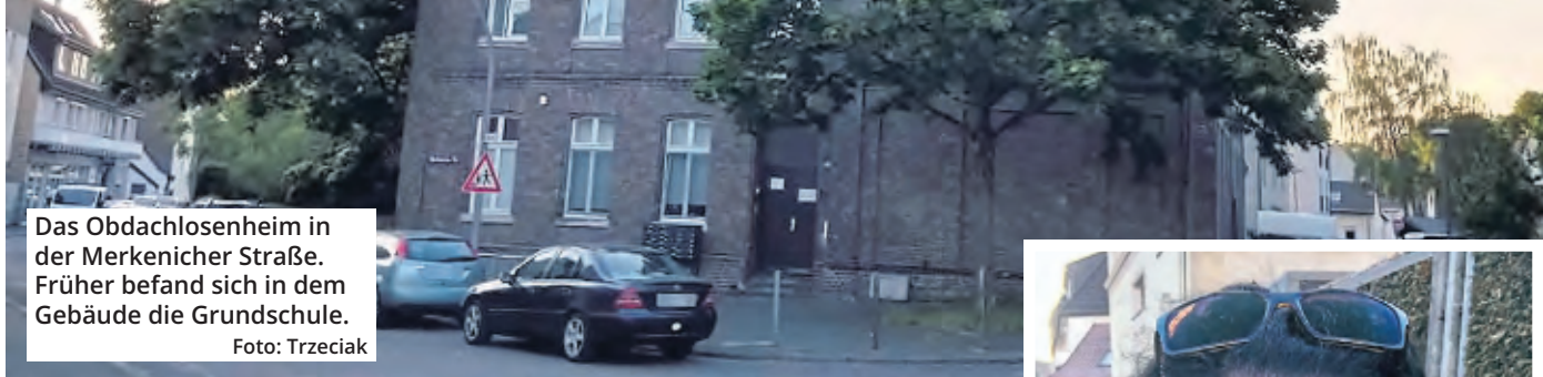
Das Obdachlosenheim in der Merkenicher Straße. Früher befand sich in dem Gebäude die Grundschule.

Was für ein nächtlicher Horror in für eine Kölner Familie in Niehl. Morgens um 5 Uhr steht plötzlich ein Obdachloser am Schlafzimmerbett eines Ehepaars. Zuvor hat er im Wohnzimmer auf dem Sofa gelegen und eine Zigarette geraucht. Im EXPRESS schildert Sylvia Grunert, wie sie diese Nacht erlebte.