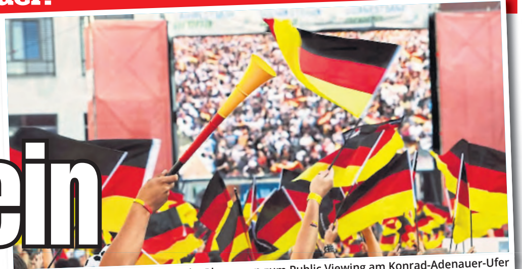
Die Anwohner fühlen sich durch die Planungen zum Public Viewing am Konrad-Adenauer-Ufer überrumpelt, nun haben sie ihren Frust ausgesprochen.

Zusätzlich könnte auch eine EM-Euphorie rund um die deutsche Mannschaft zu weiteren Public-Viewing-Events am Rheinufer führen – wenn unsere Elf weit kommt.