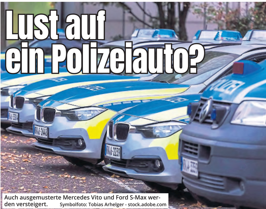
Auch ausgemusterte Mercedes Vito und Ford S-Max werden versteigert.