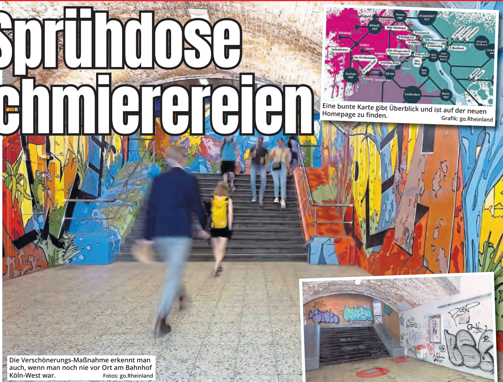
Die Verschönerungs-Maßnahme erkennt man auch, wenn man noch nie vor Ort am Bahnhof Köln-West war.

bereits Kunstgraffiti zu finden sind, gibt es eine eigene Unterseite. Dort können die Interessierten anhand von Bildern einen Vorher-Nachher-Vergleich anstellen. Zudem gibt es jeweils ein Faktenblatt mit den wichtigsten Eckdaten wie den Namen der Künstler oder dem Zeitpunkt der Graffiti-Realisierung. Wo genau sich das Projekt in der Region befindet, zeigt eine künstlerisch gestaltete Übersichtskarte (kleines Foto oben) – und der Link zur Fahrplanauskunft, um mit dem Zug den direkten Weg zum „bunten Bahnhof“ zu finden, ist ebenfalls eingebaut. Einen besonderen Einblick in die Streetart-Szene bieten die Interviews, die go.Rheinland mit mehreren Künstlern geführt hat. Neue Projekte, die in Zukunft umgesetzt werden sollen, werden nach und nach auf der Website ergänzt. Neben den einzelnen Bahnhofprojekten wird die Beziehung zwischen Graffiti-Kunst