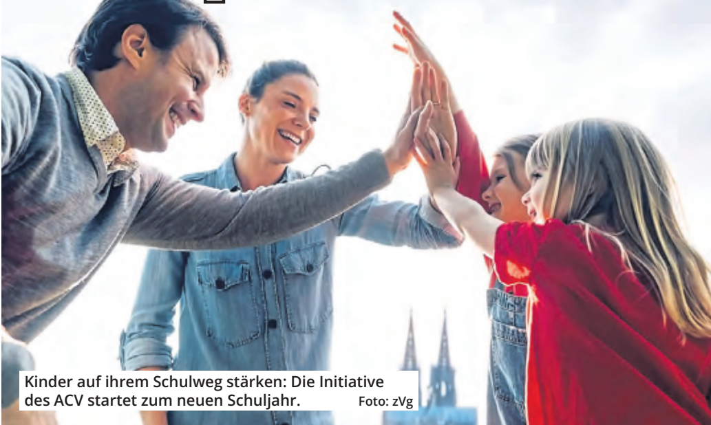
Kinder auf ihrem Schulweg stärken: Die Initiative des ACV startet zum neuen Schuljahr.

Der Automobil-Club Verkehr (ACV) verfolgt den Anspruch, nachhaltigster Automobilclub Deutschlands zu sein. Dabei stehen nicht nur ökologische Ziele im Fokus. Der Club setzt sich auch für eine Steigerung der Verkehrssicherheit auf den Straßen ein.