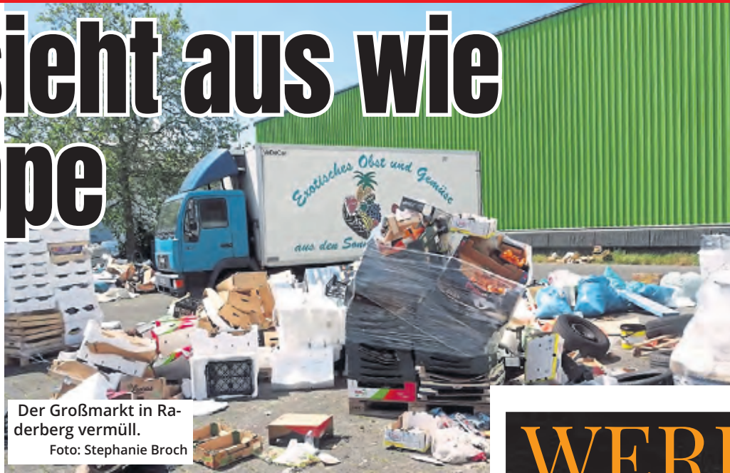
Der Großmarkt in Raderberg vermill.