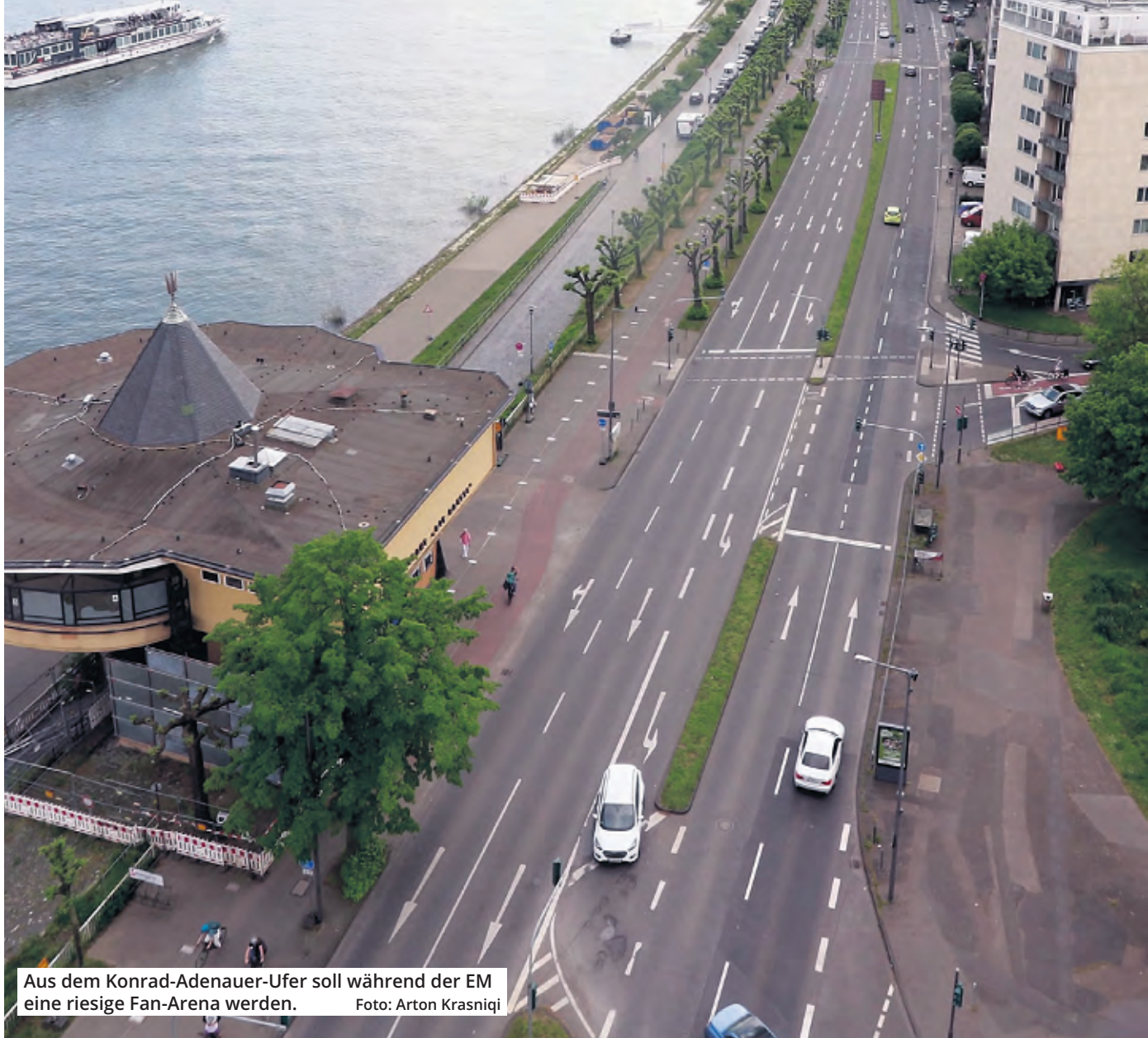
Aus dem Konrad-Adenauer-Ufer soll während der EM eine riesige Fan-Arena werden.

Es war ein Überraschungs-Knaller in den EM-Planungen der Stadt Köln: Relativ kurzfristig musste eine weitere Public-Viewing-Fläche her. Und die wurde am Konrad-Adenauer-Ufer gefunden. Gegen die riesige Fan-Arena gibt es allerdings Proteste.