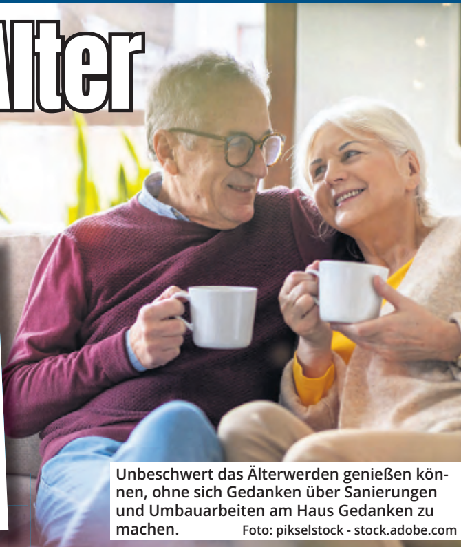
Unbeschwert das Älterwerden genießen können, ohne sich Gedanken über Sanierungen und Umbauarbeiten am Haus Gedanken zu machen.

Köln. Bei diesen Überlegungen hilft ein Blick auf die Zahlen. Bundesweit sind die Preise für Wohnimmobilien im vergangenen Jahr um durchschnittlich 8,4 Prozent gesunken. Das geht aus den aktuellen Zahlen des Statistischen Bundesamts hervor. Hauptgrund dafür sind die steigenden Zinsen, die die Finanzierung eines Immobilienkaufs erheblich verteuert haben. Für Köln verzeichnet auch der NRW-Preisspiegel 2024 des Immobilienverbands Deutschland (ivd) in einigen Segmenten des Wohnimmobilienmarkts leichte Preisrückgänge.