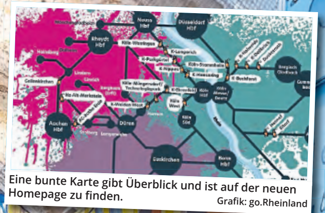
Eine bunte Karte gibt Überblick und ist auf der neuen Homepage zu finden.

Was erst mal absurd klingt, funktioniert tatsächlich und soll zur Steigerung der Aufenthaltsqualität und der Vandalismusprävention dienen. Statt verschmierter dreckiger Bahnhöfe erwartet Bahnreisende eine buntes und künstlerisches Streetart-Highlight nach dem anderen. Eine Webseite zeigt nun, wie weit das Projekt fortgeschritten ist.