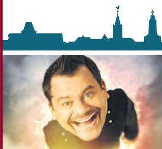
Ingo Appelt mit „STARTSCHUSS! – Auf die Kacke, fertig, los!“ Sa., 28. September 2024, 20 Uhr