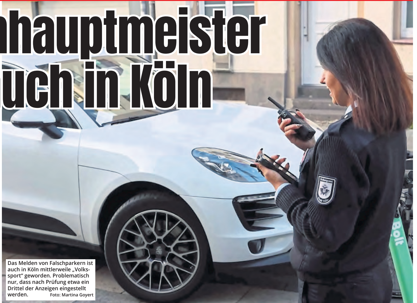
Das Melden von Falschparkern ist auch in Köln mittlerweile „Volksport“ geworden. Problematisch nur, dass nach Prüfung etwa ein Drittel der Anzeigen eingestellt werden.

Ob es sich um Ausnahmefälle oder das Werk eines Kölner „Anzeigenhauptmeisters“ handelt, dazu lassen sich aus den gestellten Fremdanzeigen keine Rückschlüsse ziehen. Bekannter ist da ein Fall aus Bielefeld. Dort stellte die Stadtverwaltung nach einer Analyse für das Jahr 2020 fest, dass von