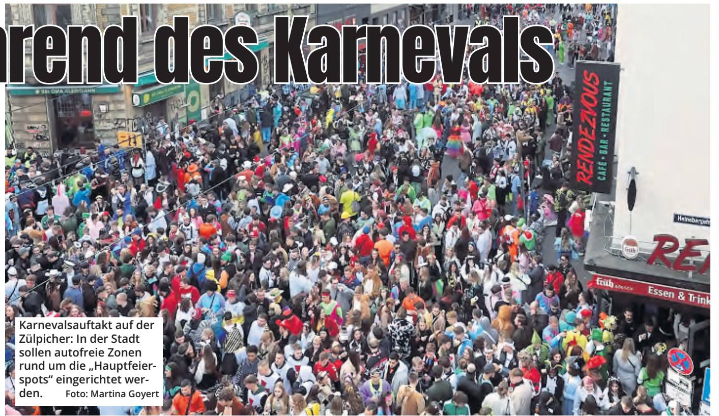
Karnevalsauftakt auf der Zulpicher: In der Stadt sollen autofreie Zonen rund um die „Hauptfeierspots“ eingerichtet werden.