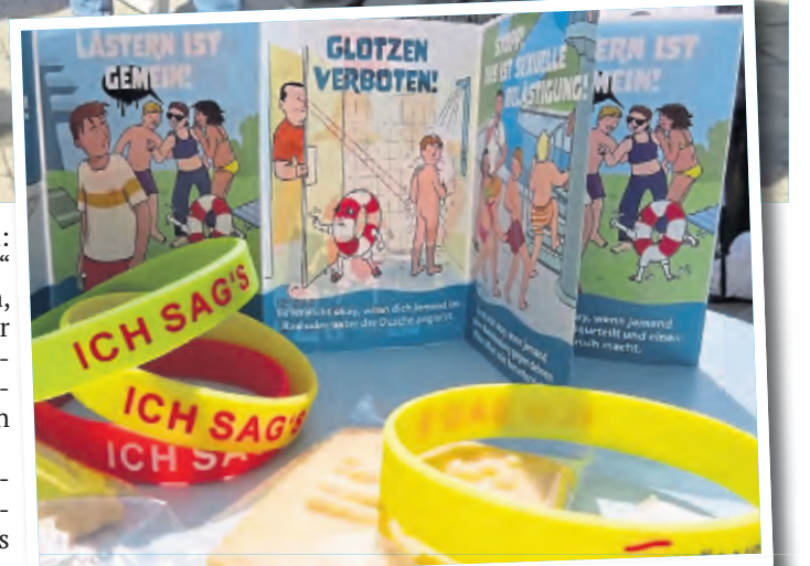
Es wird mit Postern, Flyern und Armbändern für den Schutz von Kindern und Jugendlichen in Schwimmbädern geworben.

Laut Angabe der Kölner Polizei sind in Kölner Schwimmbädern in diesem Jahr bereits zehn Sexualdelikte aufgenommen worden. Im vergangenen Jahr waren es 26.