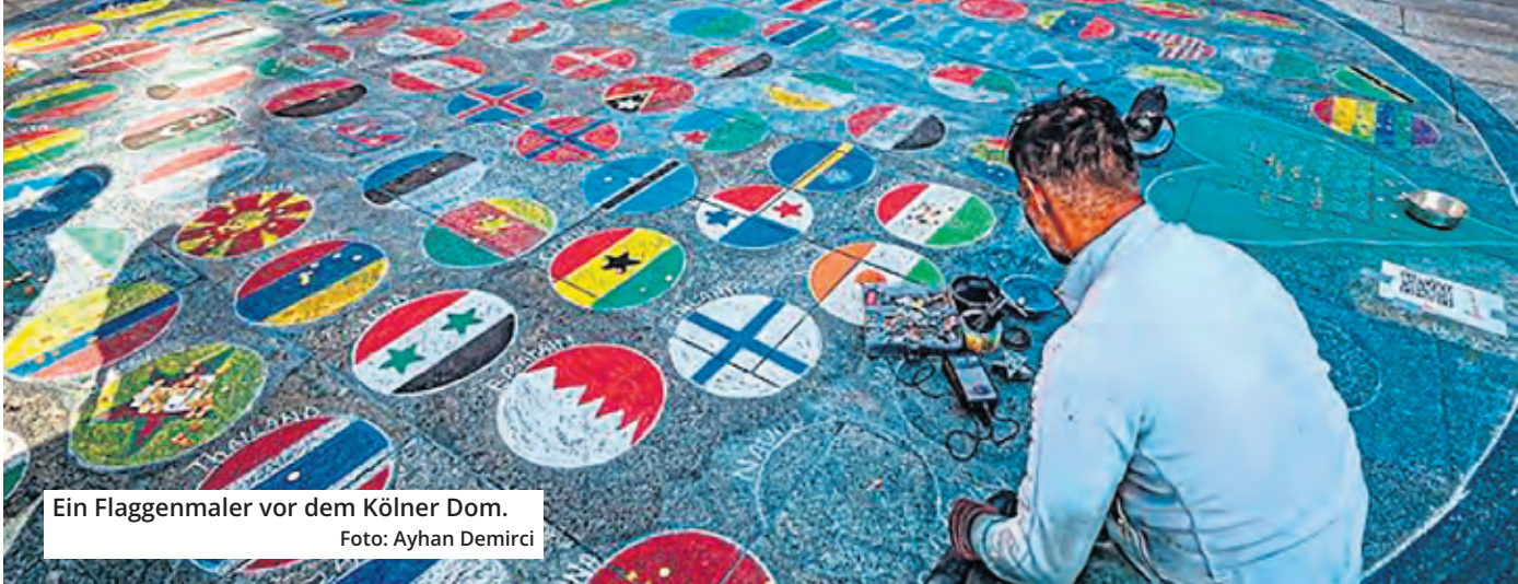
Ein Flaggenmaler vor dem Kölner Dom.

Zur Fußball-EM erwartet die Stadt viele tausend internationale Gäste. Um diesen auch „einen aufgeräumten und sauberen Stadtraum“ bieten zu können, will die Verwaltung die Kölner Stadtordnung verschärfen. Im Kern geht es darum, dass Verbote für Straßenmusik und Straßenmalerei ausgeweitet werden – speziell in der Dom-Umgebung und in der Altstadt sieht die Stadt Handlungsbedarf.