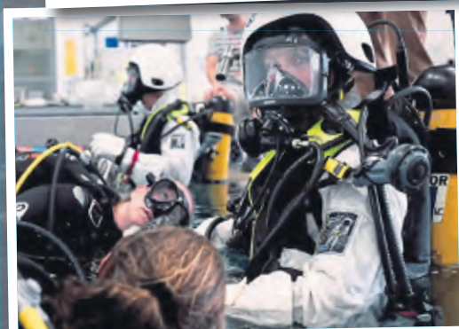
Training für den Außenbordeinsatz: Sophie Adenot in Houston.