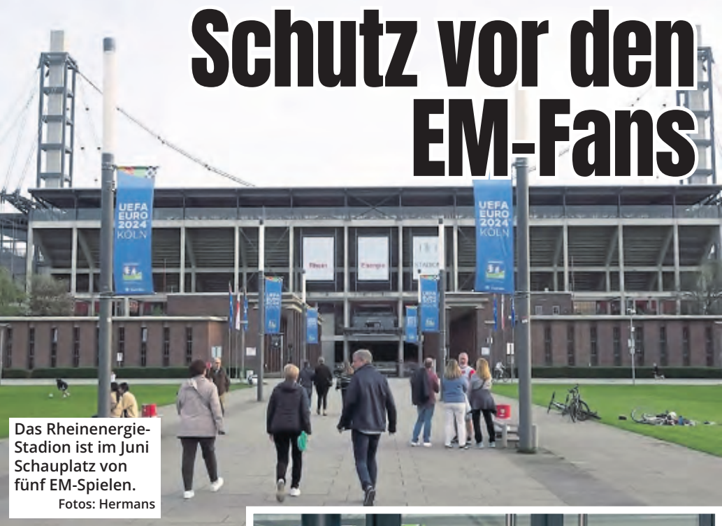
Das Rheinenergie-Stadion ist im Juni Schauplatz von fünf EM-Spielen.

Köln ist zwischen dem 15. und 30. Juni Gastgeber der UEFA- Euro 2024. Organisatoren diskutierten nun mit Anwohnern des Stadions über das Schutzkonzept für die Fußball-Europameisterschaft.