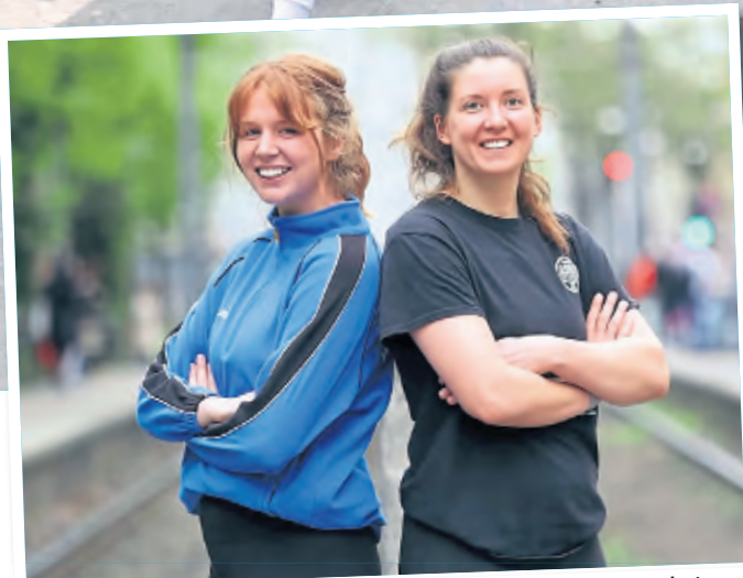
Das Duo lebt zwar schon einige Zeit in Köln, doch so richtig kennen sie die Stadt noch nicht. Das soll sich nun ändern.

Wenn eine von beiden die Kräfte verlassen sollten, könne man schließlich immer in die Bahn einsteigen, zurückfahren und es an einem anderen Tag erneut probieren. (red.)