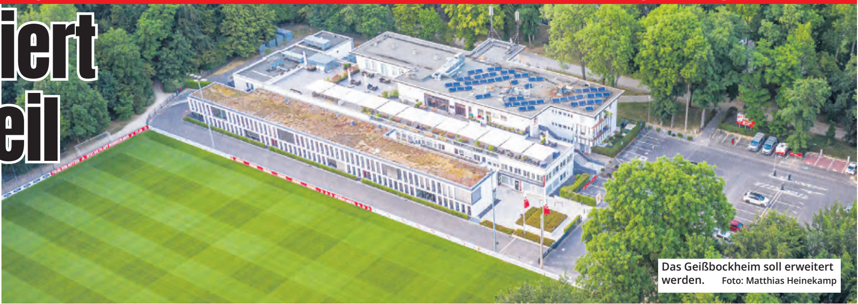
Das Geißbockheim soll erweitert werden.