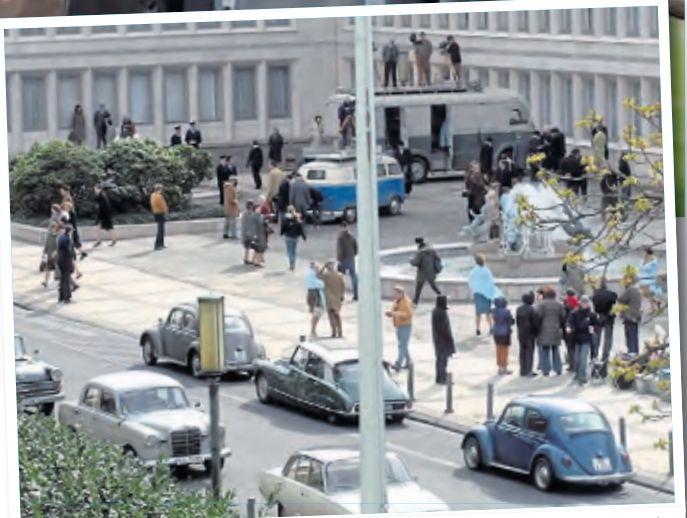
Am Set zu „Rubinrot“ im Kölner Grüngürtel.

Aber auch internationale Kinofilme entstehen hier. Um Hotelkosten und Zeit zu sparen soll Leuck immer wieder Orte in Köln und Umgebung suchen, die nicht nach Köln aussehen. „Köln bietet sehr viel“, sagt Leuck, trotzdem stoße sie