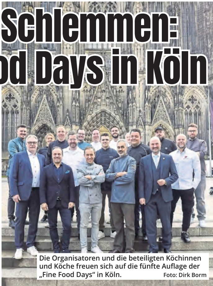
Die Organisatoren und die beteiligten Köchinnen und Köche freuen sich auf die fünfte Auflage der „Fine Food Days“ in Köln.