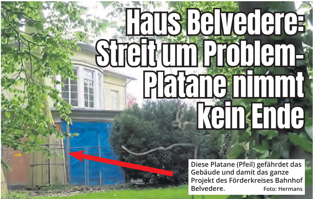
Diese Platane (Pfeil) gefährdet das Gebäude und damit das ganze Projekt des Förderkreises Bahnhof Belvedere.

Alle wichtigen Informationen zum Event finden sich online unter vogelsanger-mailauf.de