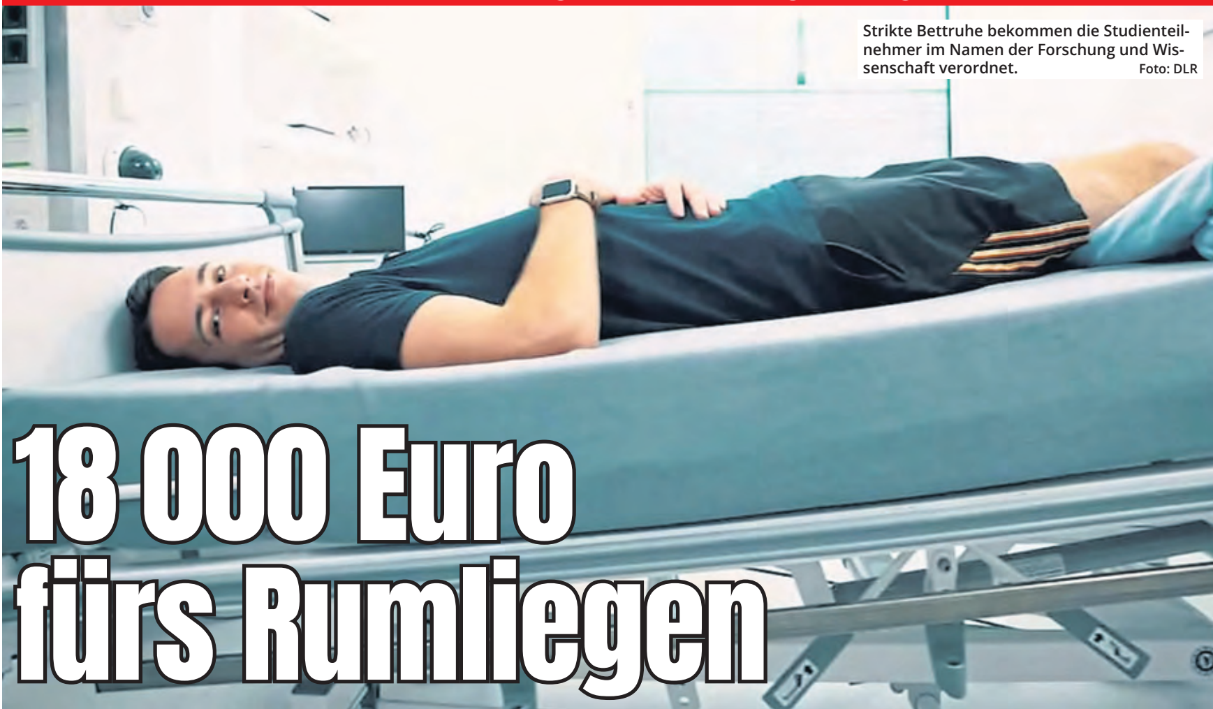
Strikte Bettruhe bekommen die Studienteilnehmer im Namen der Forschung und Wissenschaft verordnet.