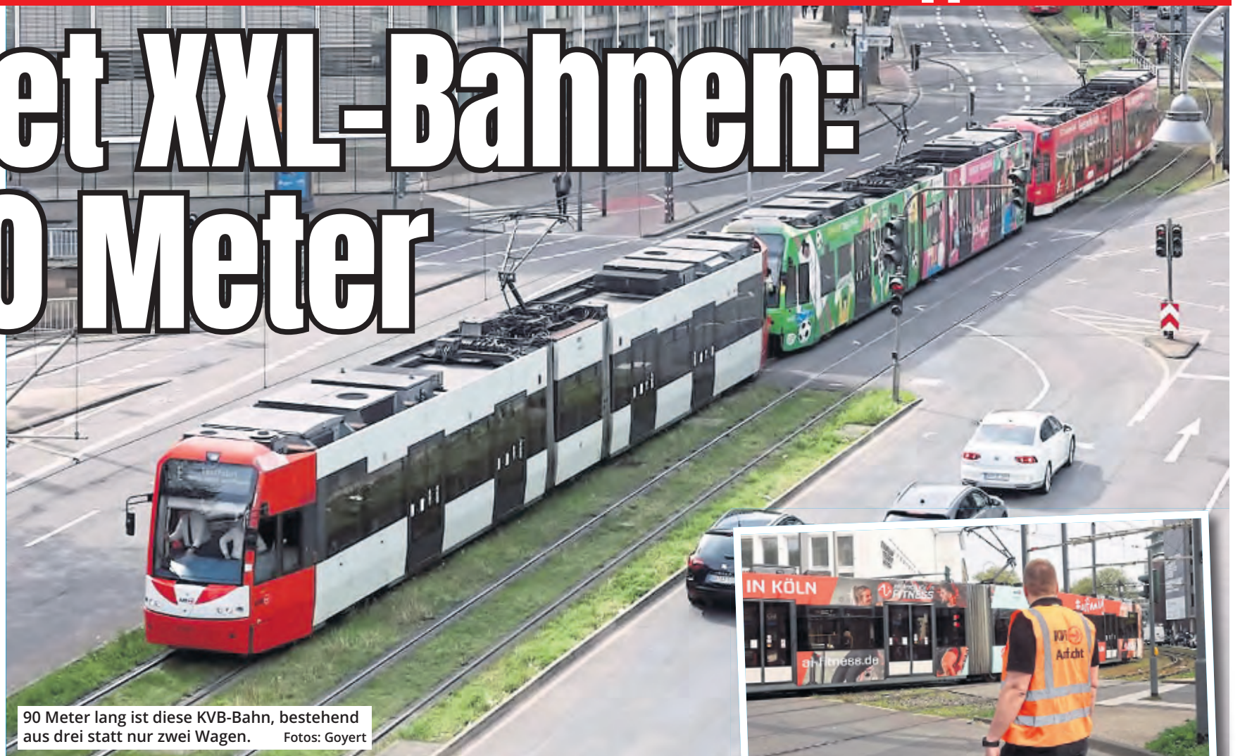
90 Meter lang ist diese KVB-Bahn, bestehend aus drei statt nur zwei Wagen.

fahrende, Zufußgehende und des übrigen ÖPNV – dargestellt und auf normale Verkehrszeiten hochgerechnet werden. Die