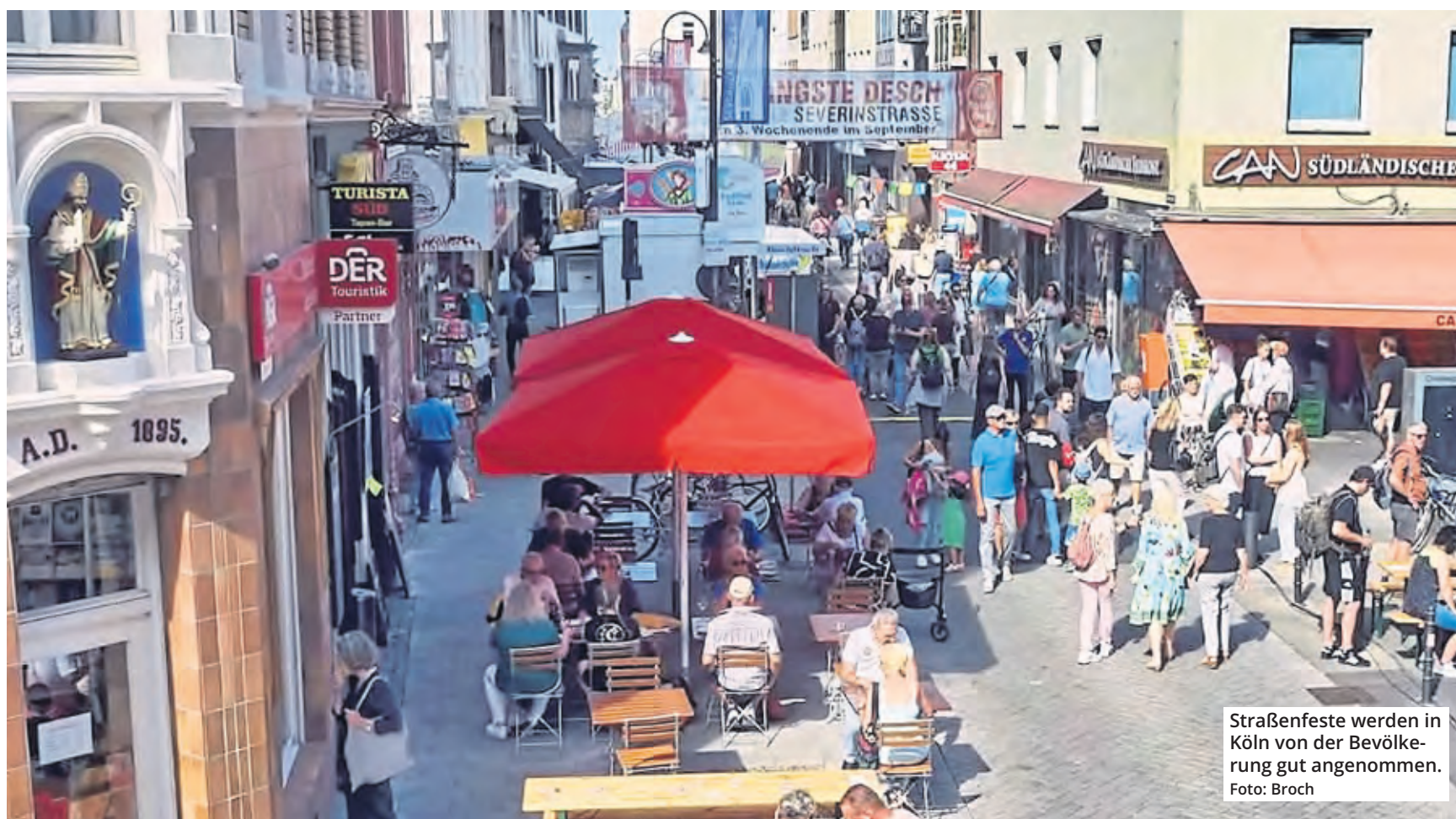
Straßenfeste werden in Köln von der Bevölkerung gut angenommen.

Die Kölner Einzelhändler müssen unbedingt auch im Netz aktiv sein. Gerade bei der Social-Media-Arbeit ist noch viel Luft nach oben. Dabei muss es sich nicht immer nur um spezielle Events handeln, wie den Tag des Veedels. Auch abseits davon können Einzelhändler durch besondere Aktionen auf sich aufmerksam machen, und das am besten ideenreich und kontinuierlich. Das kostet zwar einiges an Zeit, doch es lohnt sich, in jedem Fall.