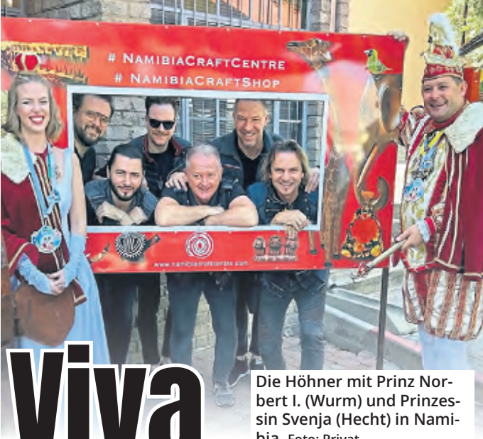
Die Höhner mit Prinz Norbert I. (Wurm) und Prinzessin Svenja (Hecht) in Namibia.