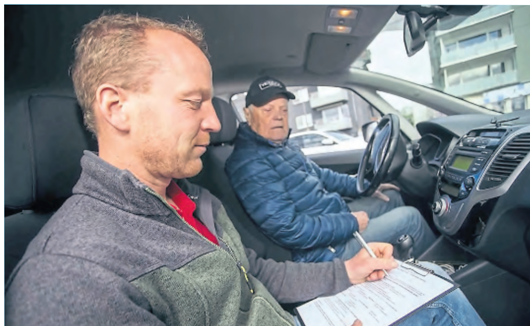
Nach der Fahrt werden die wichtigsten Erkenntnisse gemeinsam in Ruhe besprochen, auf Wunsch wird auch eine Teilnehmerurkunde ausgestellt.