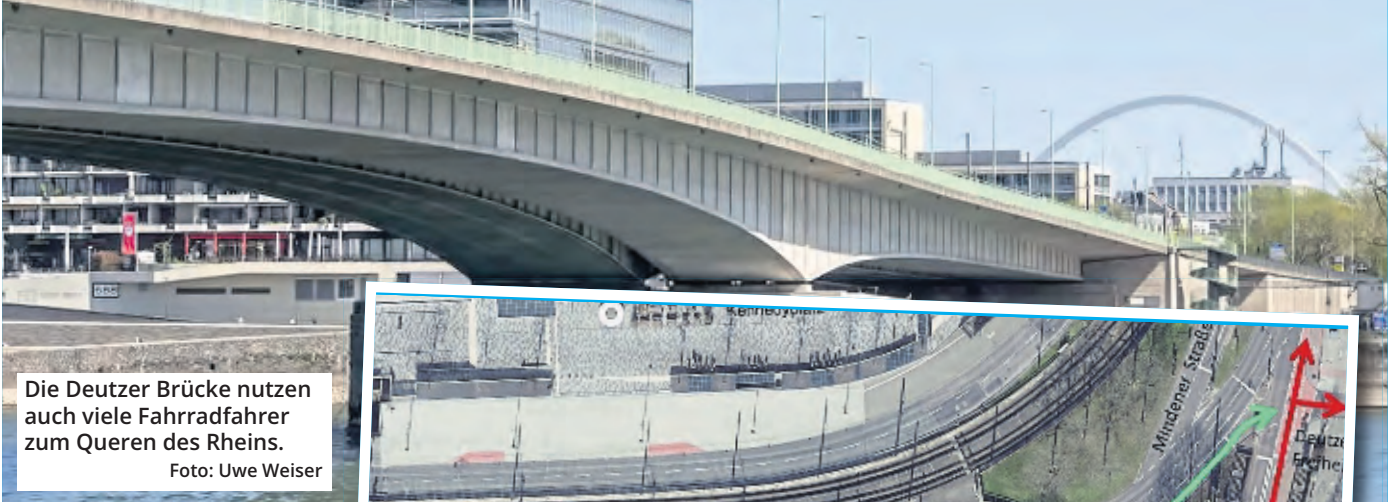
Die Deutzer Brücke nutzen auch viele Fahrradfahrer zum Queren des Rheins.

Die Pläne sehen vor, die bestehende Rechtsabbiegespur für den Autoverkehr von der Deutzer Brücke in Richtung Siegburger Straße um rund 50 Meter zu verkürzen. Damit werde ausreichend Platz für einen neuen Radfahrstreifen geschaffen, der Radfahrer vom Geh- und Radweg auf der Brückenrampe auf die Fahrbahn führt. Die neue Radverbindung im Rechtsrheinischen