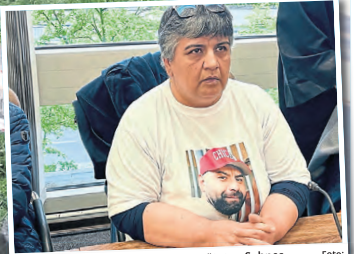
Die Mutter mit einem Foto ihres getöteten Sohnes.

Laut Verteidiger gäbe es viele Gerüchte, dass er den Mord in Auftrag gegeben haben soll. Der Verteidiger: „Nur die gerichtliche Überprüfung kann für Klarheit sorgen.“ Unter den Zeugen, die aussagen werden, ist auch die Freundin des Opfers. Auch sie tritt als Nebenklägerin auf. Ihre Anwältin Funda Bicakoglu stellte den Antrag, dass ihre Mandantin per Videovernehmung aussagen kann, da diese erheblich traumatisiert sei.