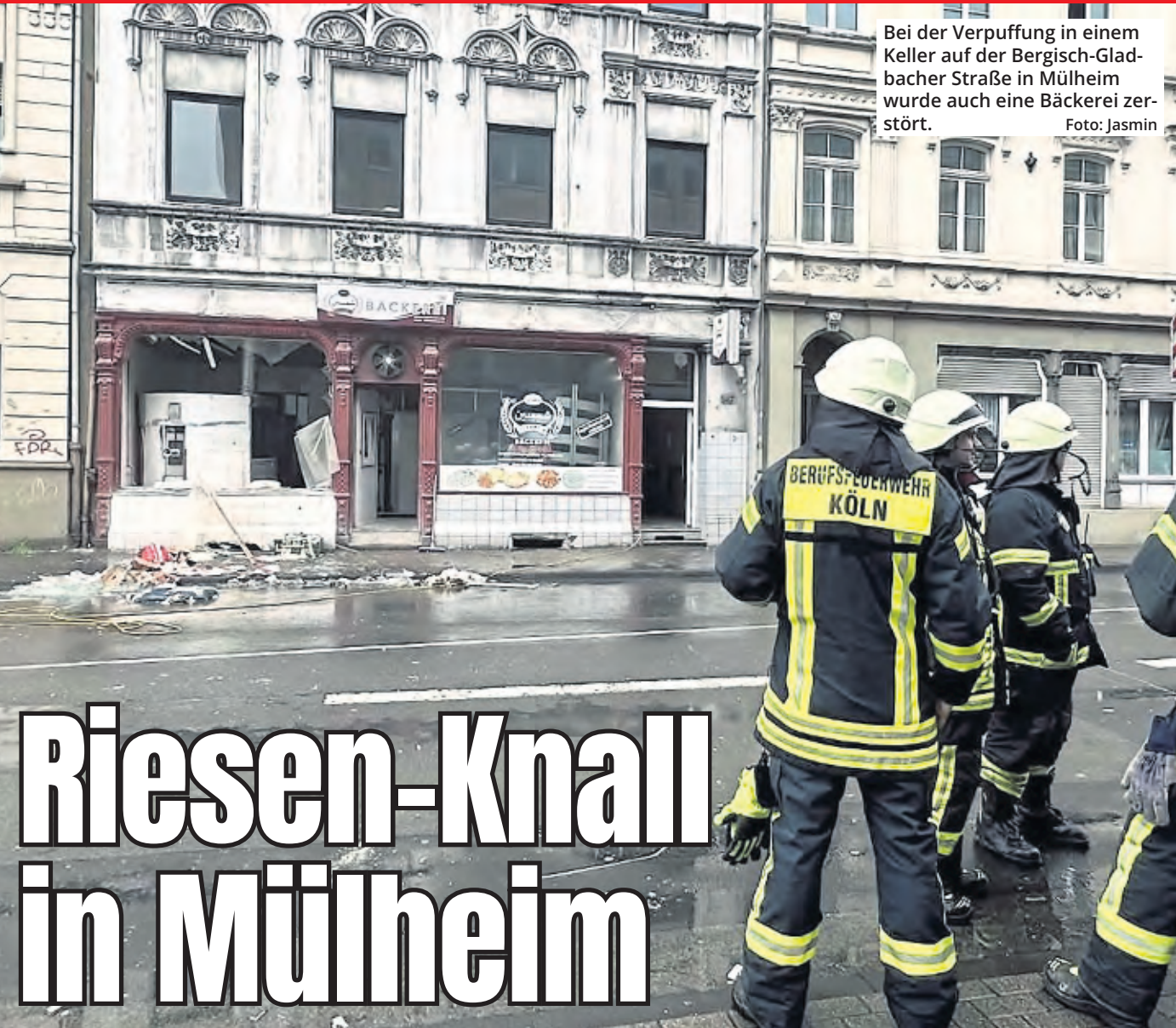
Bei der Verpuffung in einem Keller auf der Bergisch-Gladbacher Straße in Mülheim wurde auch eine Bäckerei zerstört. Foto: Jasmin

Berliner Straße 988 51069 Köln-Dünnwald Telefon 0221-60 15 79