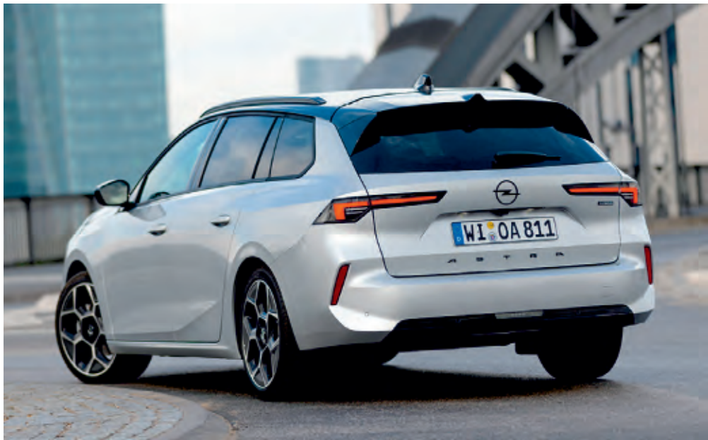
Sportlich, eleganter Kombi: Opel Astra Sports Tourer Hybrid