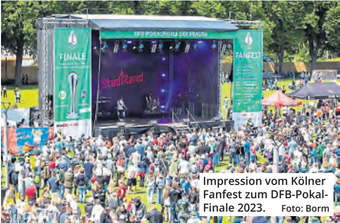
Impression vom Kölner Fanfest zum DFB-Pokal-Finale 2023.