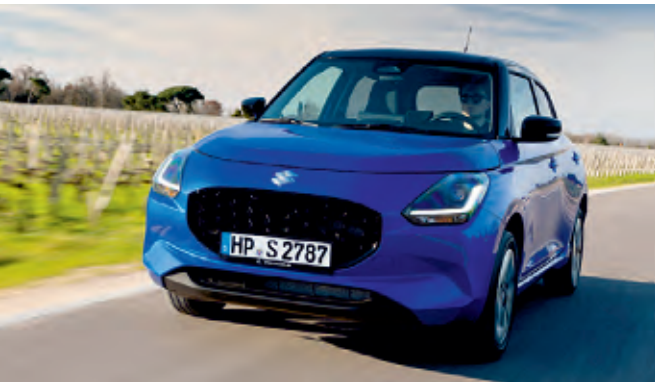
Suzuki Swift bietet wahlweise drei Ausstattungen