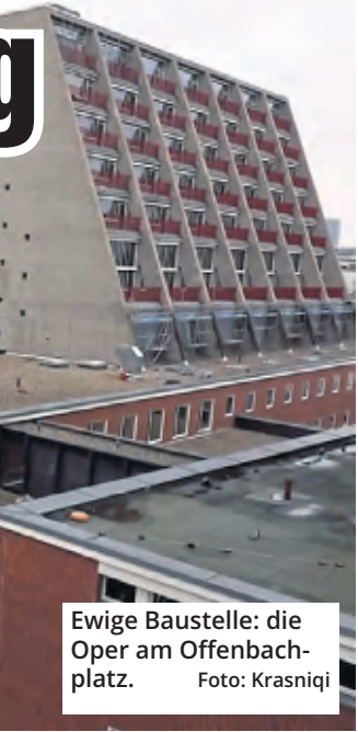
Ewige Baustelle: die Oper am Offenbachplatz.

Oper, Schauspiel, Kinderoper und Kleinem Haus 2015 beendet sein, doch diverse Probleme sorgten für eine nahezu komplette Neuplanung. Die geplante Fertigstellung wurde immer wieder verlegt, zuletzt korrigierte Streitberger den Termin vom 22. März auf den 28. Juni – doch auch dieser Termin wackelt nun. Aktuell werden die Baukosten auf 703 Millionen Euro beziffert. Dazu kommen 371 Millionen Euro Kosten für Kredite und weitere Kosten. So steht das Gesamtprojekt mittlerweile bei rund 1,204 Milliarden Euro. (mhe.)