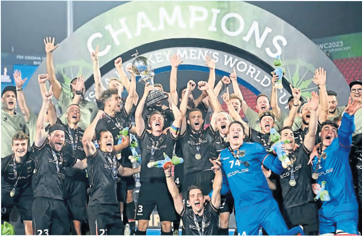
Die deutschen Hockey-Herren wurden im vergangenen Jahr mit vielen kölnern Spielern Weltmeister. Auch bei den Olympischen Spielen gehören sie zu den Medaillenfavoriten.