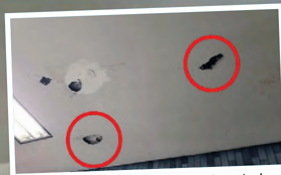
Zwei dieser Löcher hatte die Kreuz-Aktion in der Decke der KVB-Station hinterlassen.