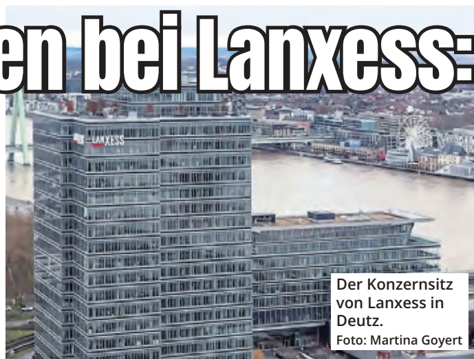
Der Konzernsitz von Lanxess in Deutz.

Deutz. Der Kölner Chemiekonzern Lanxess durchlebt schwierige Zeiten. Energiekosten und Kaufzurückhaltung der industriellen Kunden machen dem MDax-Konzern zu schaffen. „Wir blicken auf ein hartes Jahr zurück“, sagte der Vorstandsvorsitzende Matthias Zachert bei der Bilanzpressekonzferenz am Konzernsitz in Deutz. „Wir beobachten eine sehr schwache Nachfrage, einen anhaltenden Lagerabbau bei unseren Kunden