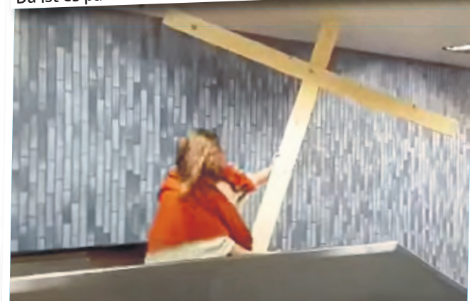
Jesus rüttelt und zieht am Holzkreuz.