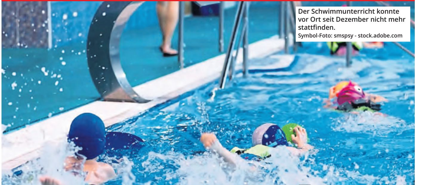
Der Schwimmunterricht konnte vor Ort seit Dezember nicht mehr stattfinden.