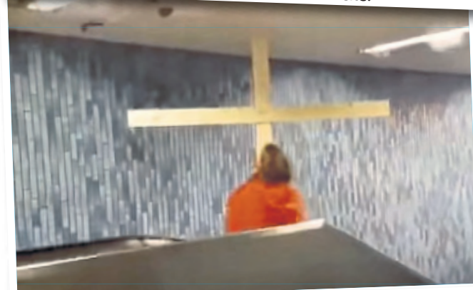
Da ist es passiert – das Kreuz hängt fest.