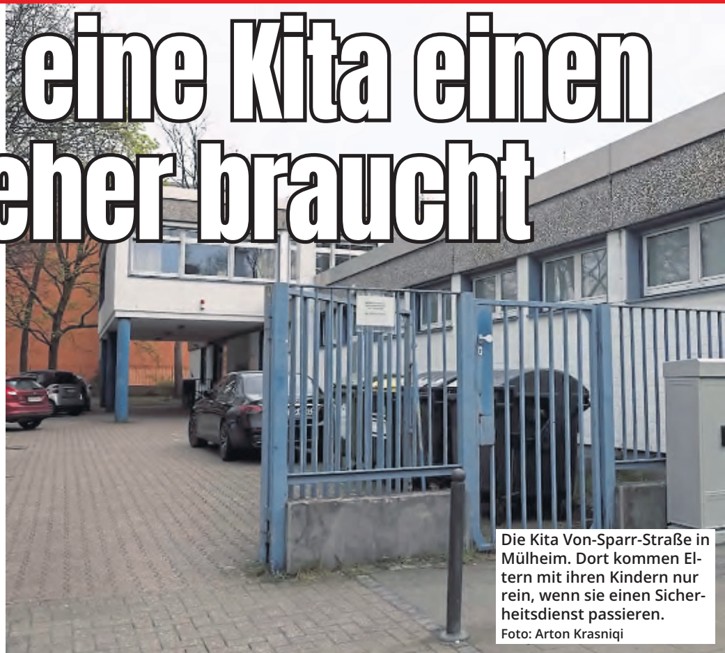
Die Kita Von-Sparr-Straße in Mülheim. Dort kommen Eltern mit ihren Kindern nur rein, wenn sie einen Sicherheitsdienst passieren.