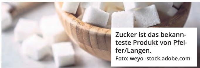
Zucker ist das bekannteste Produkt von Pfeifer/Langen.