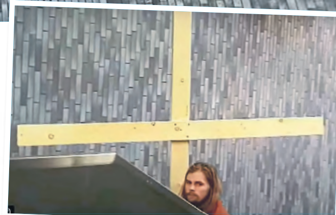
Der Jesus von Köln fährt mit dem großen Kreuz die Rolltreppe hoch – in diesem Moment ahnt er noch nichts, aber in der nächsten Sekunde gerät das Kreuz in die Decke.