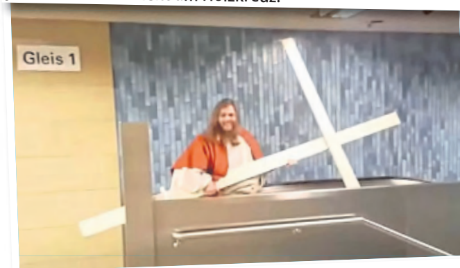
Erleichterung: Das Kreuz liegt wieder frei.