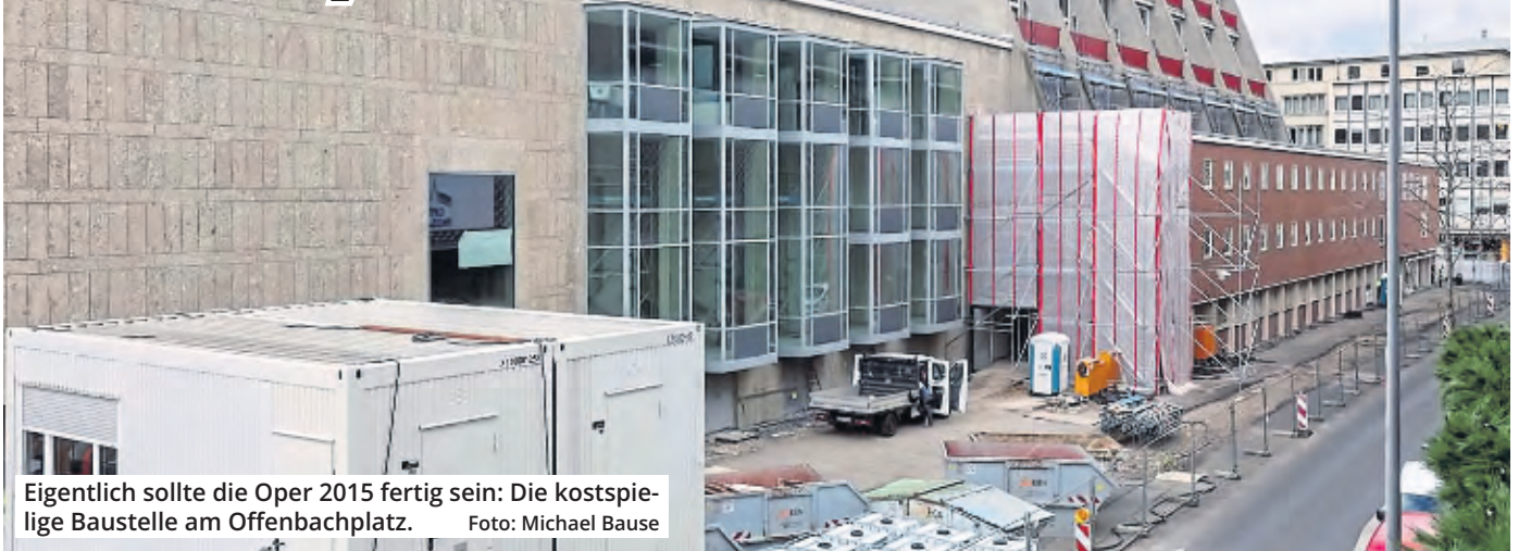
Eigentlich sollte die Oper 2015 fertig sein: Die kostspielige Baustelle am Offenbachplatz.

Es ist der nächste Akt in dem Opern-Debakel. Die dreimonatige Verzögerung bei der Sanierung der Bühnen am Offenbachplatz kostet die Stadt Köln nach aktuellem Stand 30 Millionen Euro mehr. Die Verantwortlichen der Sanierung begründeten dies jetzt neben der Verzögerung bis zur geplanten Fertigstellung am 28. Juni 2024 mit Baupreissteigerungen und mehr Personal.