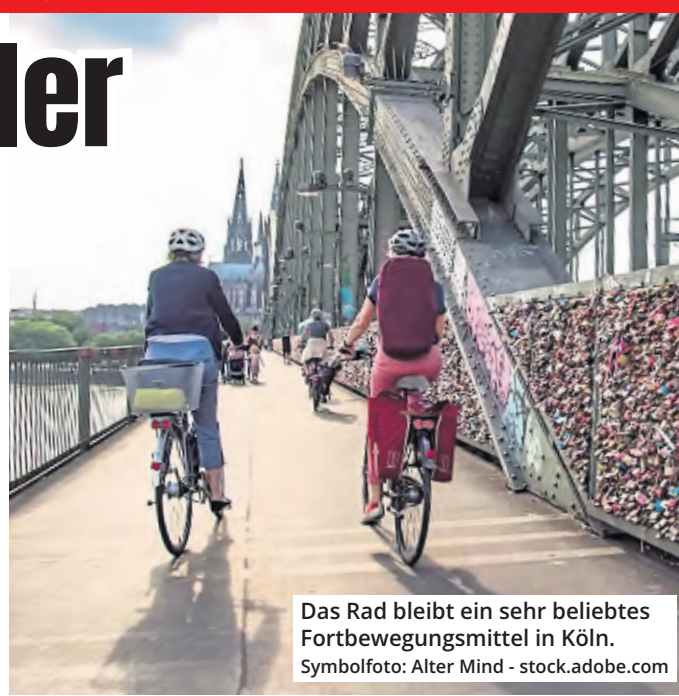
Das Rad bleibt ein sehr beliebtes Fortbewegungsmittel in Köln.

Seit 2023 werden an 20 Standpunkten in Köln dauerhaft Radverkehrszählungen durchgeführt. Im Jahr 2023 sind zwei weiteren Standpunkte an Auenweg und Elisabeth-Schäfer-Weg hinzugekommen. Diese neuen Zählstellen befinden sich derzeit in der Testphase und werden voraussichtlich im ersten Quartal 2024 in den regulären Betrieb übergehen. Alle Zählstellen ermöglichen eine noch genauere Erfassung und Analyse für die weitere Förderung des Radverkehrs.