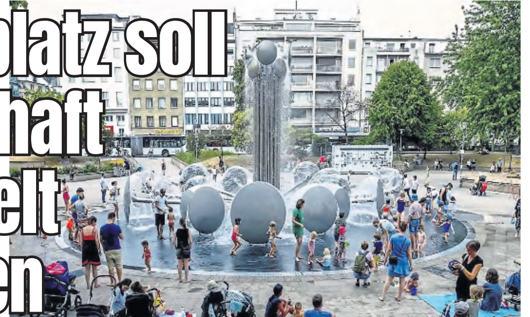
Der Ebertplatz mit seinem Brunnen, hier beim Sommerfest.

Innenstadt. Seit mehr als 20 Jahren wird über den Umbau des Ebertplatzes diskutiert. Vieles wurde gesprochen, wenig ist passiert. Jetzt heißt es: Der Ebertplatz soll auch nach einem möglichen Umbau dauerhaft mit einem Programm bespielt werden. Das hat die Stadt mitgeteilt. Doch noch ist völlig unklar, wer das bezahlt.