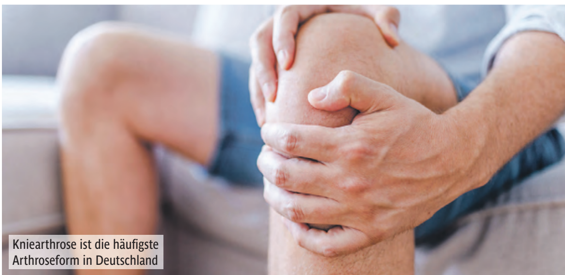
Knierarthrose ist die häufigste Arthroseform in Deutschland