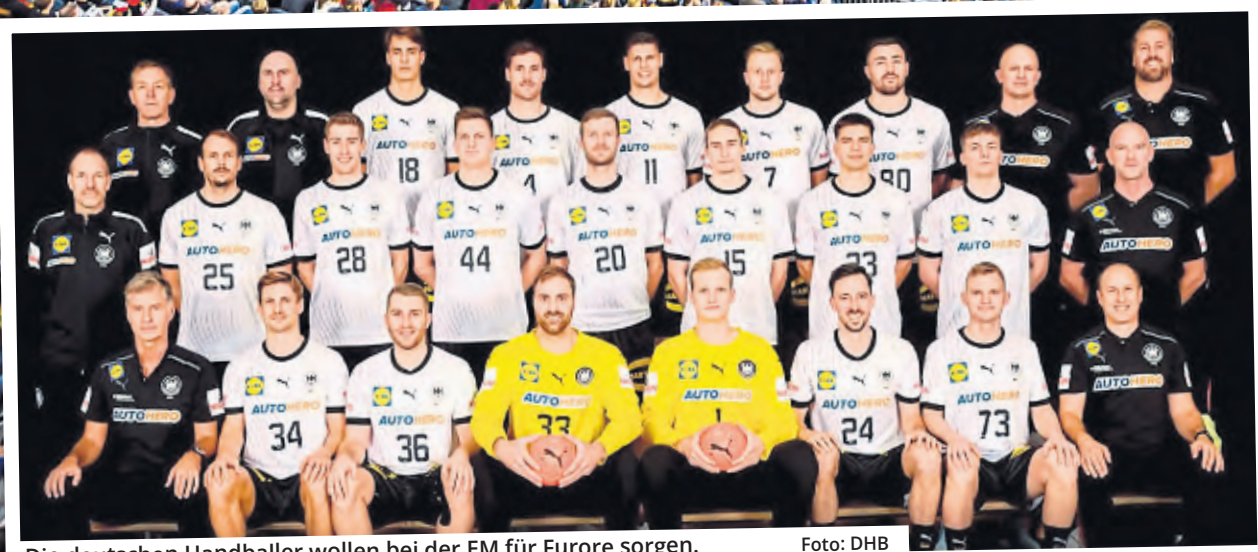
Die deutschen Handballer wollen bei der EM für Furore sorgen.