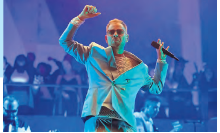
Peter Fox tourt 2024 auch durch Köln.