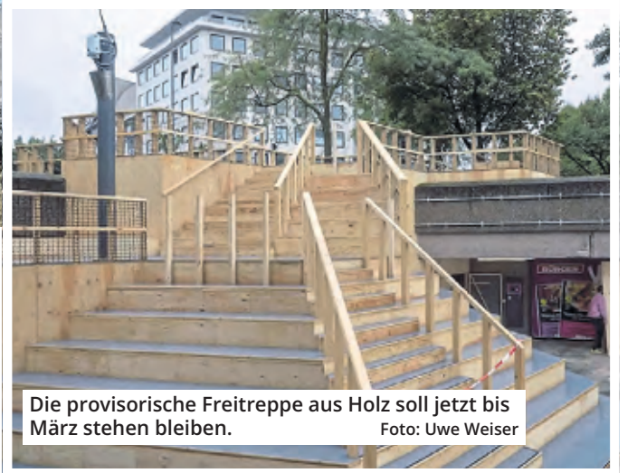
Die provisorische Freitreppe aus Holz soll jetzt bis März stehen bleiben.

„Entgegen der zunächst diskutierten zwei Varianten (Variante Komplettumbau und Variante Bestandserhalt) wurde in die Aufgabenstellung für die angefragten Büros eine dritte Variante zur Prüfung aufgenommen. Bei dieser Variante soll ein Teilumbau des Platzes geschätzt, doch Kämmerin Dörte Diemert hatte angesichts der schlechter werdenden finanziellen Lage der Stadt die