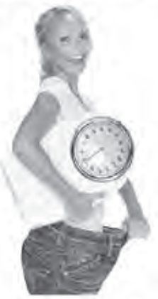
Glücklich dank Wohlfühlfigur, mit der Nr. 1 Empfehlung aus der Apotheke.

formoline L112 gibt Ihnen die Freiheit beim Abnehmen auch Ihre Lieblingsgerichte zu genießen, strenger Verzicht ist nicht notwendig. Nehmen Sie einfach formoline L112 zu Ihren beiden Hauptmahlzeiten ein. Der Wirk-Ballaststoff L112 vermindert die Kalorienaufnahme aus den Nahrungsfetten. So erleben Sie Abnehmen mit Genuss und bleiben motiviert.