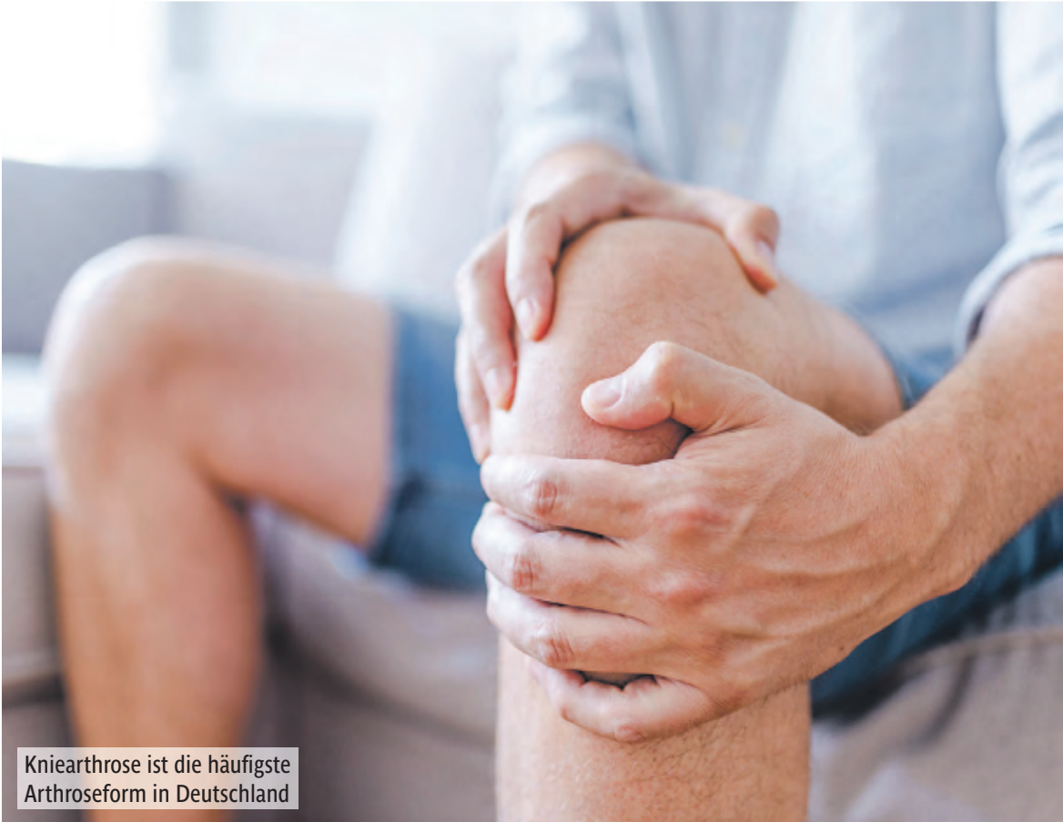
Kniearthrose ist die häufigste Arthroseform in Deutschland