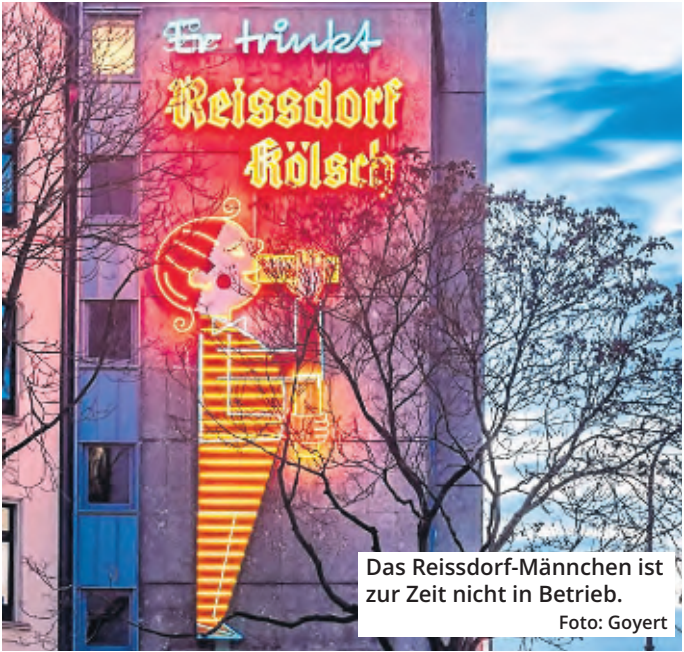
Das Reissdorf-Männchen ist zur Zeit nicht in Betrieb.