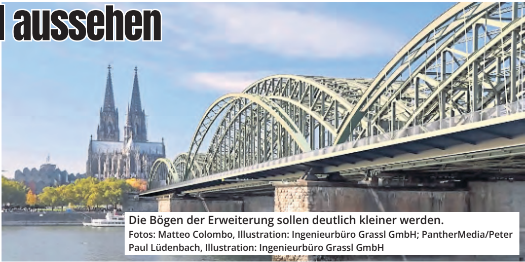
Die Bögen der Erweiterung sollen deutlich kleiner werden.

Am 21. März soll der Stadtrat über die Vorlage abstimmen und entscheiden, ob der kleine Bogen gebaut wird.