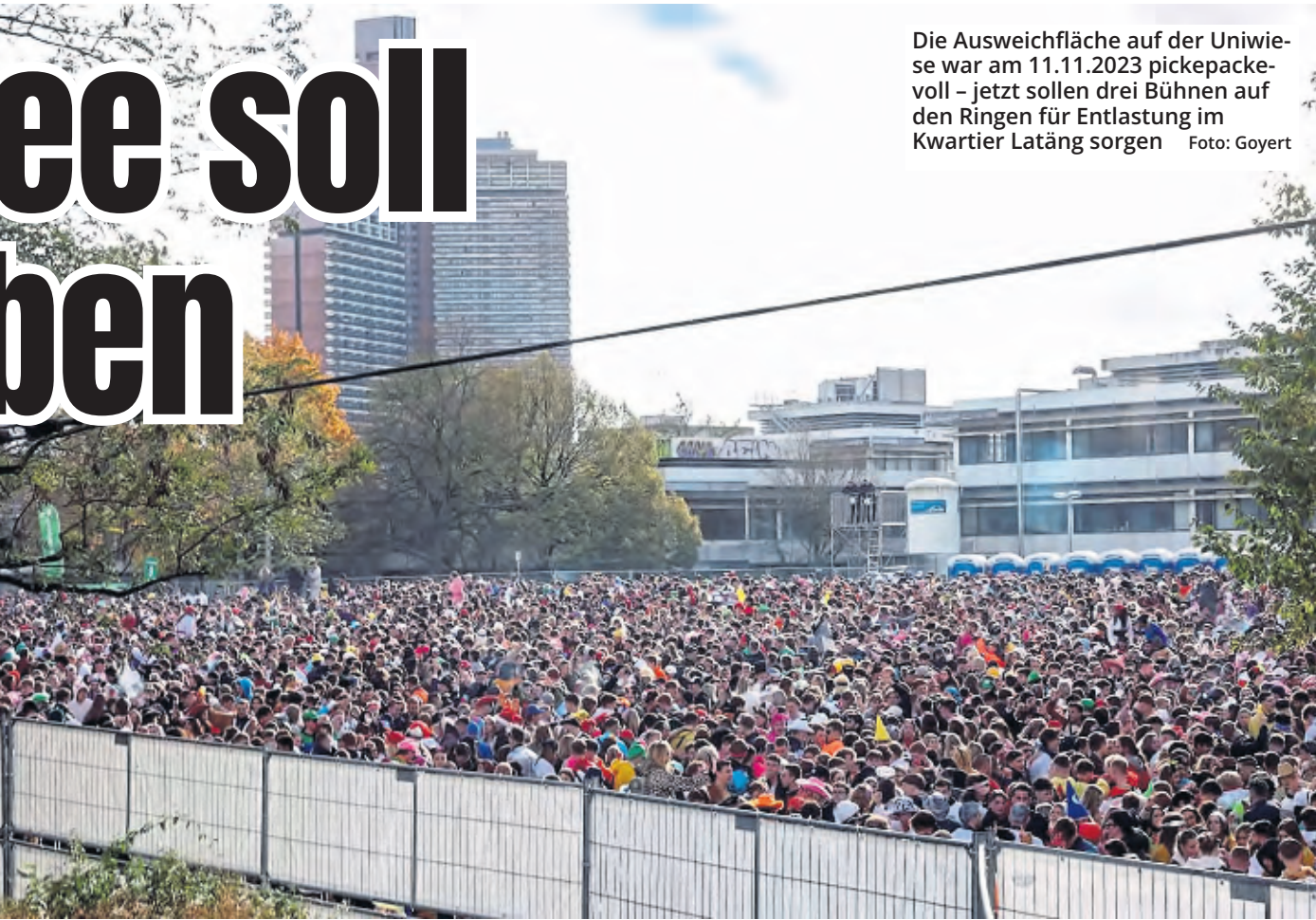
Die Ausweichfläche auf der Uniwiese war am 11.11.2023 pickpackevoll – jetzt sollen drei Bühnen auf den Ringen für Entlastung im Quartier Latäng sorgen

Irgendwo müssen die immer zahlreicher anreisenden Partywilligen schließlich hin – und der zur Verfügung stehende Raum im Quartier Latäng ist endlich. Da kam die Idee für eine neue, zusätzliche Ausweichfläche gerade recht: Eine Partyzone auf dem Hohenstaufenring, gleich angrenzend an die Zülpicher Straße. Diesen Plan hat die Karnevalsgesellschaft „Die Grosse von 1823“ als Veranstalter gefasst. In den vergangenen Wochen hat die KG in einer Hau-Ruck-Aktion ein umfassendes Veranstaltungskonzept gestemmt und an dessen Umsetzung gearbeitet. „Zu 99 Prozent wird an Weiberfastnacht alles so stattfinden wie geplant“, er-