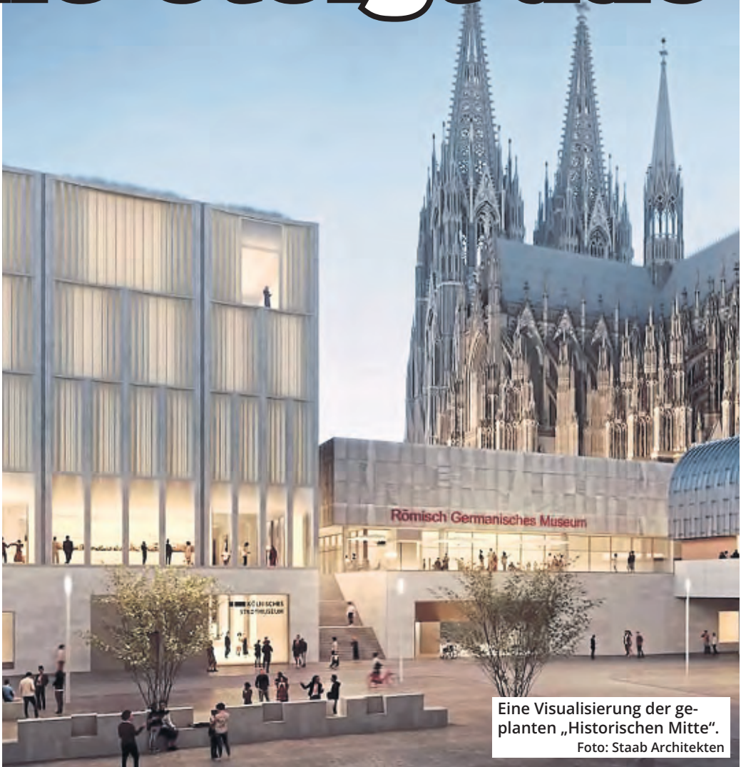
Eine Visualisierung der geplanten „Historischen Mitte“. Foto: Staab Architekten

Sowohl Stadt als auch Hohe Domkirche haben Gespräche für die nächsten Wochen angekündigt, denn es bleiben viele Fragen, wie es nun weitergeht. Das Stadtmuseum öffnet im März in seinem Interim im umgebauten früheren Modehaus Sauer, weil das denkmalgeschützte Zeughaus als frühere Heimat ein Sanierungsfall ist. Eine Sanierung samt Erweiterung hatte die Verwaltung mal auf 91 Millionen Euro geschätzt. Laut Dombaumeister Peter Füssenich ist eine abgespeckte Version der Historischen Mitte am Roncalliplatz inklusive einer Sanierung des Kurienhauses denkbar: „Ich