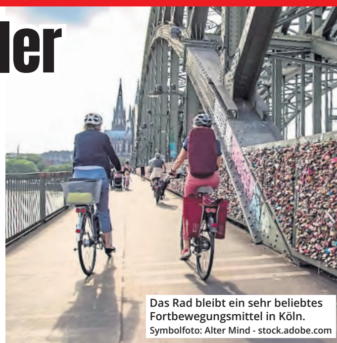
Das Rad bleibt ein sehr beliebtes Fortbewegungsmittel in Köln.

Seit 2023 werden an 20 Standpunkten in Köln dauerhaft Radverkehrszählungen durchgeführt. Im Jahr 2023 sind zwei weiteren Standpunkte an Auenweg und Elisabeth-Schäfer-Weg hinzugekommen. Diese neuen Zählstellen befinden sich derzeit in der Testphase und werden voraussichtlich im ersten Quartal 2024 in den regulären Betrieb übergehen. Alle Zählstellen ermöglichen eine noch genauere Erfassung und Analyse für die weitere Förderung des Radverkehrs.