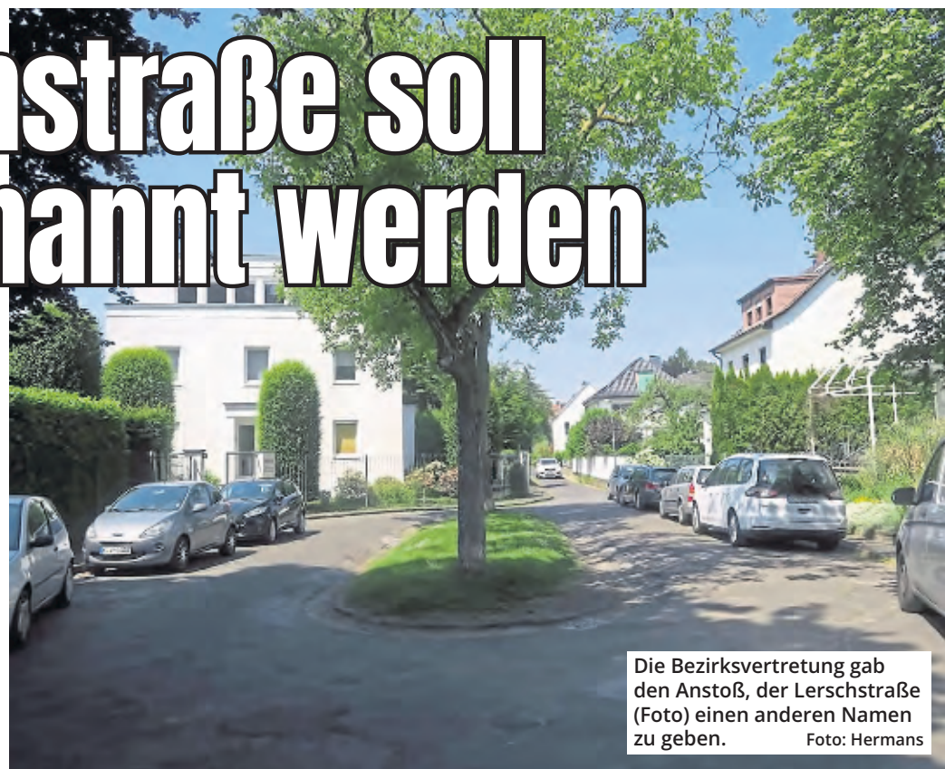
Die Bezirksvertretung gab den Anstoß, der Lerschstraße (Foto) einen anderen Namen zu geben.

Den Namen Heinrich Lersch allerdings hört man in letzter Zeit wieder öfter, und zwar in einem ungenuten Zusammenhang. Denn der Historische Beirat der Stadt, der die Straßennamen auf Verbindungen zu Kolonialismus oder Nationalsozialismus hin abklopft, hat mit Unterstützung des NS-Dokumentationszen-