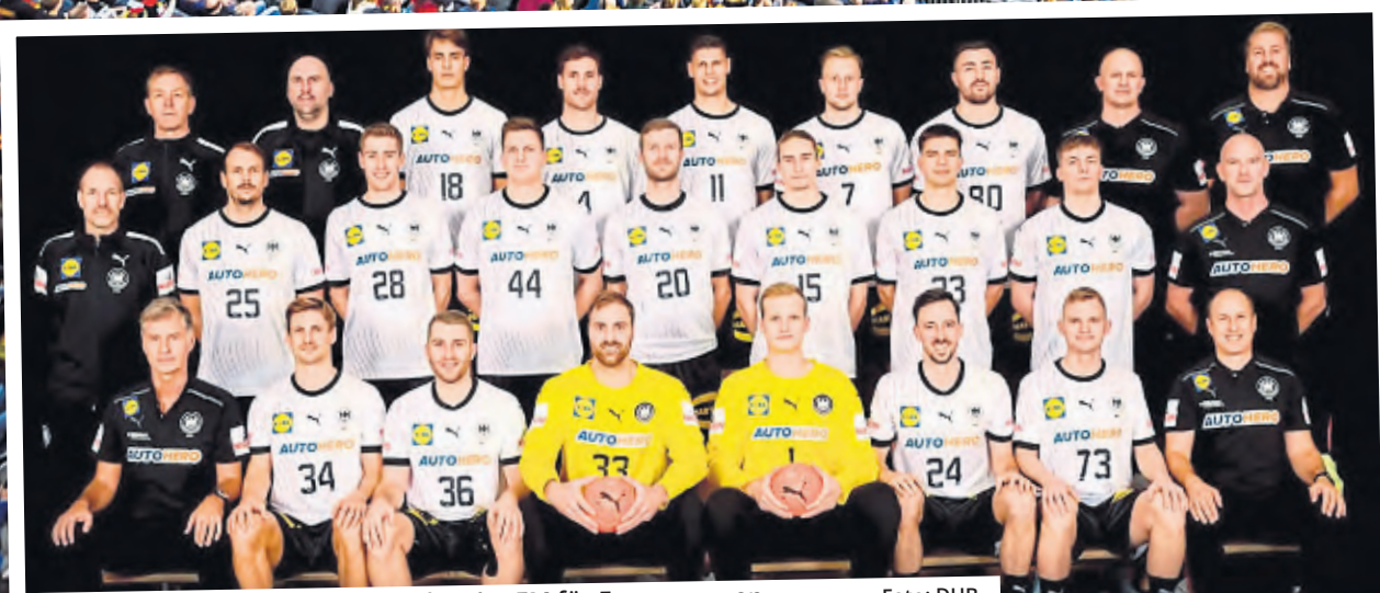
Die deutschen Handballer wollen bei der EM für Furore sorgen.