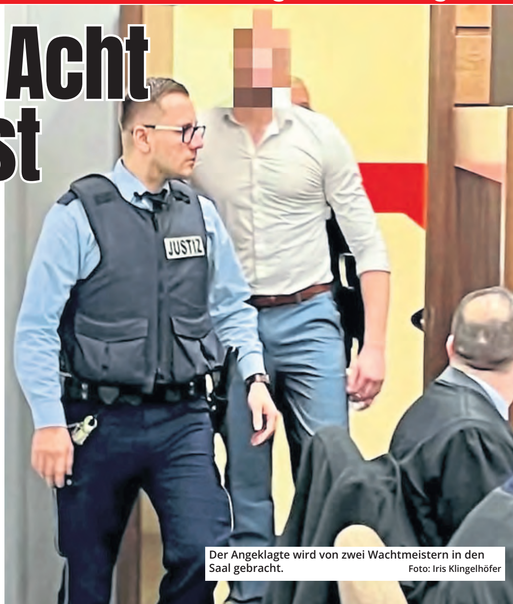
Der Angeklagte wird von zwei Wachtmeistern in den Saal gebracht.

würfe der versuchten Tötung in Einheit mit schwerer und gefährlicher Körperverletzung im Raum. Der Vorsitzende Richter Alexander Fühling und die Schöffen ließen den Vorwurf der versuchten Tötung dabei aber nicht zu und begründeten dies mit den Aussagen verschiedener Zeugen der Tat. Durch die Faustschläge und Tritte hatte das Opfer zahlreiche Knochenfrakturen erlitten, vor allem aber schwere Schädigungen des Gehirns. Er war nach der Tat zwar noch kurz aufgestanden, dann aber zusammengebrochen und nach Angaben von Sanitätern und Notarzt kurz darauf sogar klinisch tot gewesen und