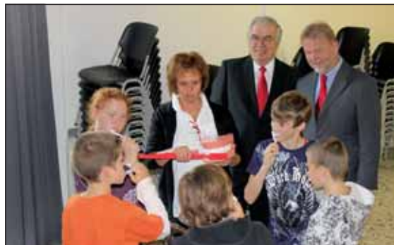
Die Kinder erhielten praktische Tipps zur Zahnpflege.

An dieser Veranstaltung haben die vierten Klassen der beiden Grundschulen und die jeweiligen Klassen fünf und sechs der Real- und Hauptschule mit insgesamt ca. 320 Schüler/-innen und ihren Lehrer/-innen teilgenommen. Nach der Begrüßung durch eine Prophylaxe-Beraterin erhielten die Schüler/-innen im Klassenverband altersgerecht Informationen über richtige Zahn-