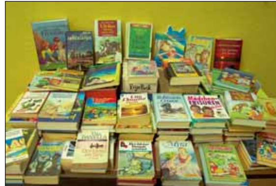
Auch beim diesjährigen Andreasmarkt werden wieder Bücher zugunsten des „Eine-Welt-Projekts“ verkauft.

Ansprechpartner für das „Eine-Welt-Projekt“ und die diesjährige Aktion zum Andreasmarkt ist Stefan Helm, den Sie im Rathaus Zimmer 011 oder telefonisch unter 02462/9908-512 erreichen können.