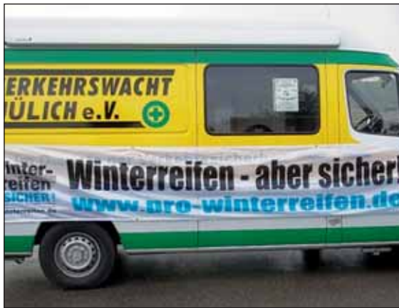
Mit Spanntüchern wollen die Verkehrswachten die Autofahrer für das Thema Winterreifen sensibilisieren.