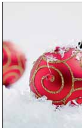
Weihnachtsdekoration kann ebenfalls beim Andreasmarkt erstanden werden.