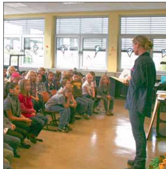
Die Schüler der KGS Linnich lauschten gebannt den Erzählungen.