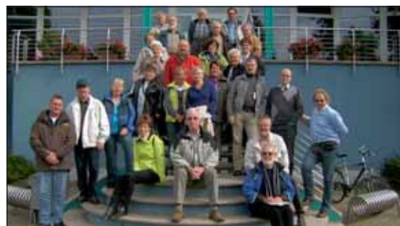
Die ehrenamtlichen Mitarbeiter der Pfarrgemeinden St. Gereon/Boslar, St. Agatha/Glimbach, St. Georg/Hottorf, St. Hermann-Josef/Floßdorf und St. Lambertus Tetz verbrachten schöne, gemeinsame Stunden.

derern ein ausgezeichnetes Mittagessen serviert.