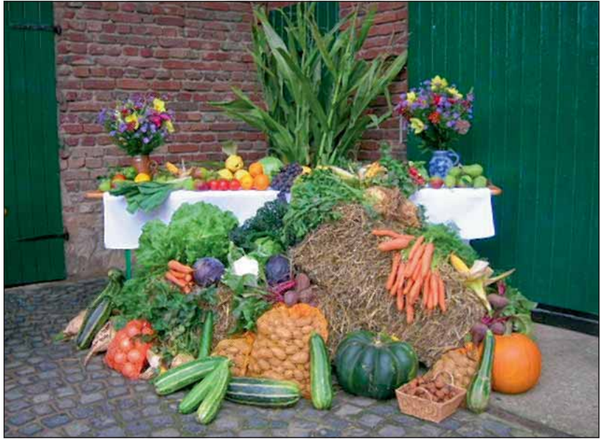
Aus den Gärten, von den Bauernhöfen und von Kindern und Erwachsenen mitgebrachte Gaben wurden zu einem Erntetisch zusammengestellt.

„Ich bin dankbar für die Ehrenamtler/innen, die regelmäßig diese Wortgottesdienste mit mir vorbereiten und den Kontakt zu den Kindern vor Ort halten, damit auch den jungen Menschen das Evangelium in kindgerechter Art und Weise nahe gebracht wird. Gleichzeitig freue ich mich auch über die vielen älteren Mitchristen, die an unseren