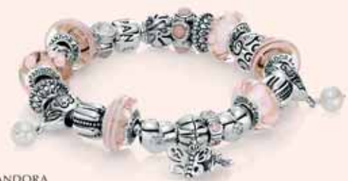
PANDORA SILBERARM BAND AB € 49,-