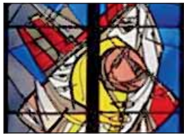
Hubert Spierling Cherubim - Eines der vier Wesen aus der Apokalypse, 1957 Probescheibe für St. Liebfrauen, Dortmund Glasmalereiwerkstatt Wilhelm Derix, Düsseldorf

Hubert Spierling - Malerei und Glasmalerei vom 25.09.2010 bis 23.01.2011 Aus Anlass des 85. Geburtstages von Hubert Spierling zeigt das Deutsche Glasmalerei-Museum Linnich mit zahlreichen Glasmalereien, Gemälden, Entwurfskartons und Zeichnungen einen facettenreichen Querschnitt durch das Werk des Krefelder Künstlers. Hubert Spierling gehört seit der Nachkriegszeit zu den bestimmenden Glasmalern in Deutschland. 1925 in Minden-Börsperde/Westfalen geboren, studierte er in Hamburg, Dortmund, Düsseldorf und Krefeld. Seit 1954 ist Spierling in Krefeld als freischaffender Künstler tätig. Er arbeitete mit den bedeutendsten Kirchenbaumeistern des 20. Jahrhunderts, u. a. mit Rudolf Schwarz, Hans Schilling, Hans Schwippert und Emil Steffann. Parallel immer als Maler tätig, schuf Spierling in eindringlicher, kraftvoller Formensprache aus differenzierten Farbflächen und freien Lineaturen abstrakte und figürliche Fenster. Kontrastreiche Farben bestimmen die sachlich kühne Atmosphäre der Fenster, für die meist milchig opake Gläser mit der Malerei nahe stehenden Farbverläufen Verwendung finden. In einem Kirchenfenster erschließt sich dem Betrachter Spierlings Farbpalette sowohl in der Reduktion auf