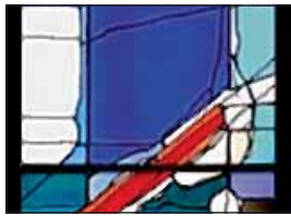
Hubert Spierling, mit rotem Keil, 1984/86, Deutsches Glasmalerei-Museum Linnich, Dauerleihgabe der NRW-Stiftung.

Lesung „Dichter, die malen; Maler, die dichten“ Freitag, 19. November 2010, 19 Uhr In der Lesereihe „Dichter, die malen; Maler, die dichten“