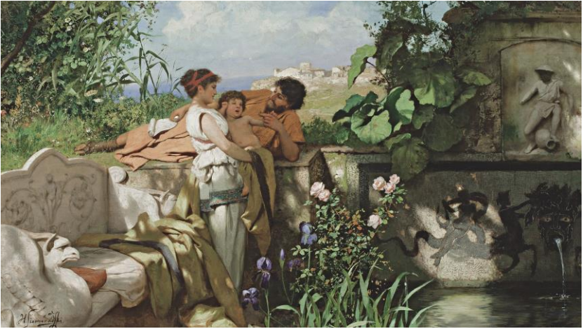
„Ländliche Idylle“ Bild: Henryk Siemieradzki vor 1900, gemeinfrei