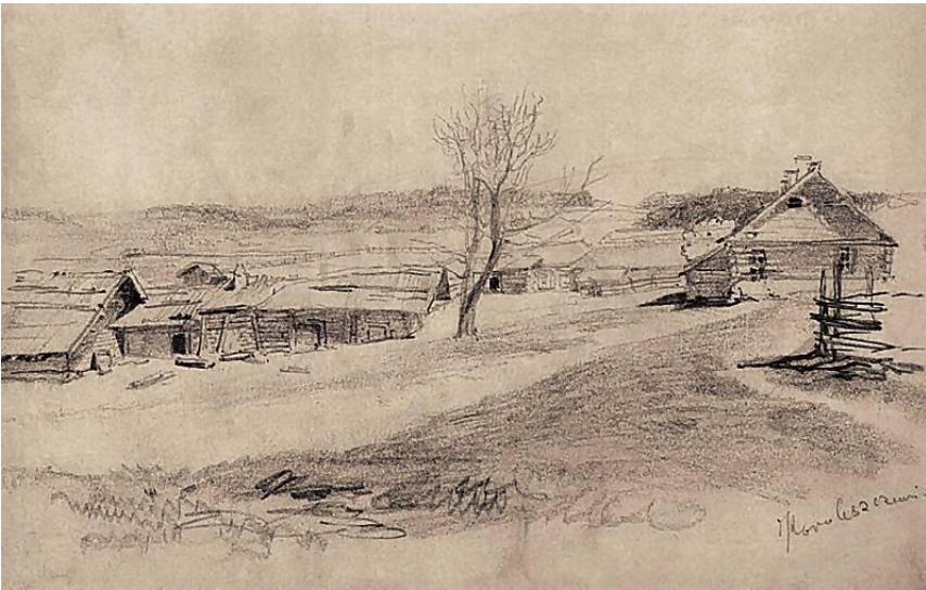
So ungefähr können wir uns Udilos Hof vorstellen

Die jungen Leute schufteten gewaltig, um das Land urbar zu machen, aber die günstige Lage und guter Boden begünstigen sie. Trotzdem bleibt es mit den Baumstümpfen und den Disteln eine arge Plackerei. Aurelia schenkt ihren Männern noch eine Silvana und einen Rufus. Dank der Genmischung ihrer schwarzhaarigen Mutter und des blonden Vaters haben sie alle rote Haare.