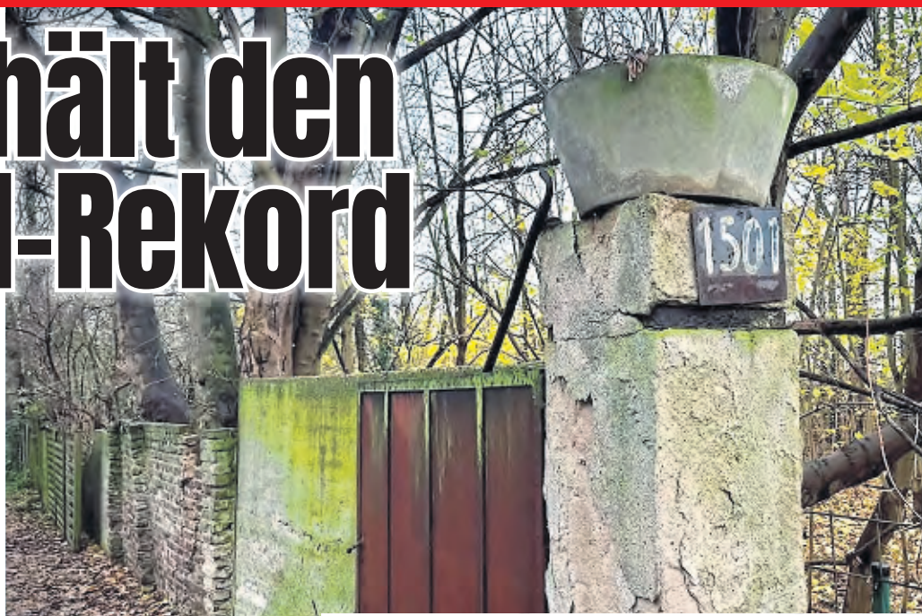
Die Adresse Venloer Straße 1501 sichert sich den Rekord als höchste Hausnummer in ganz Deutschland.

EXPRESS hat sich bei der Rekord-Hausnummer umgesehen: Ein altes Schild mit der ausgebliebenen 1501, eine lange Einfahrt, ein Klingelschild – so weit, so normal, Rekord-Stimmung kommt hier nicht so richtig auf. Eine weitere kuriose Anekdote: Es gab auch mal