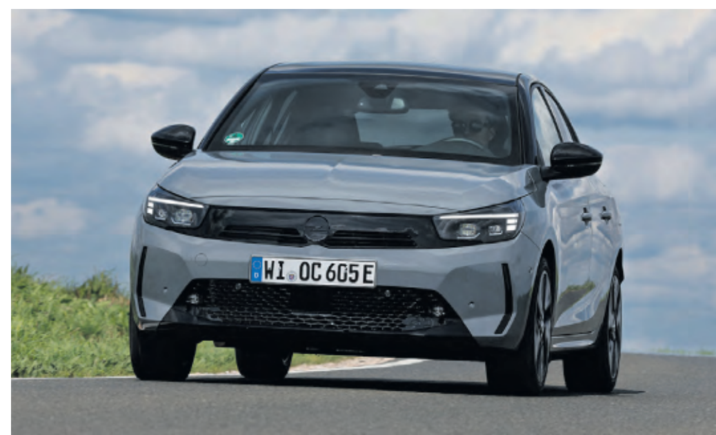
Eine elektrifizierte Alternative bietet der Corsa Hybrid