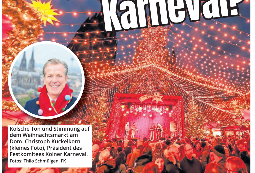
Kölsche Tön und Stimmung auf dem Weihnachtsmarkt am Dom. Christoph Kuckelkorn (kleines Foto), Präsident des Festkomitees Kölner Karneval.

Ähnlich klingt das - mit Blick auf das jecke Treiben - bei Christoph Kuckelkorn, dem Präsidenten des Festkomitees Kölner Karneval: „Der Karneval ist Jahrhunderte altes Brauchtum mit festen Abläufen, die sich nach dem christlichen Kalender richten: