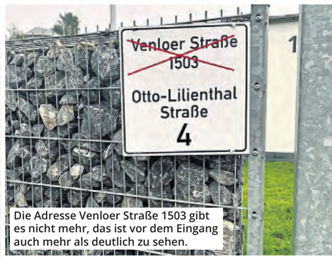
Die Adresse Venloer Straße 1503 gibt es nicht mehr, das ist vor dem Eingang auch mehr als deutlich zu sehen.

die Hausnummer 1503, diese wurde jedoch im Laufe der Zeit ins Gewerbegebiet der Otto-Lilienthal-Straße integriert, sodass das Gebäude nun die Nummer 4 trägt. Vor dem Eingang wird das jedem klargemacht: Ein großes Schild mit der durchgestrichenen Adresse „Venloer Straße 1503“ ist zu sehen. Verrückt!