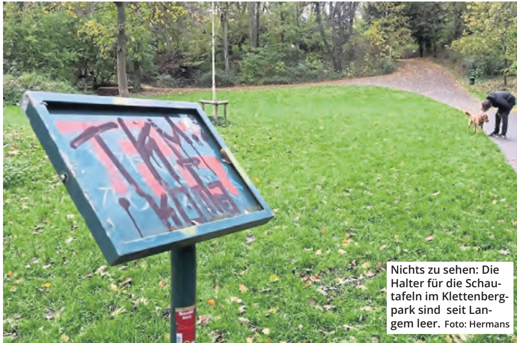
Nichts zu sehen: Die Halter für die Schautafeln im Klettenbergpark sind seit Langem leer.

Doch mit dem Lernen ist das seit Längerem so eine Sache. Zwar stehen im Park noch massenweise Schautafelhalter für die entsprechenden Erklärungen herum, doch die Inhalte über Flora & Fauna selbst sind längst verschwunden. Das möchte die Bezirksvertretung Lindenthal sowie an der Blumenallee in Junkersdorf für 11000 beziehungsweise 10000 Euro artenreiche Wiesen angelegt werden, für die Pflege des Junkersdorfer Felsengartens sind noch einmal 18000 Euro vorgesehen. Auch in Weiden