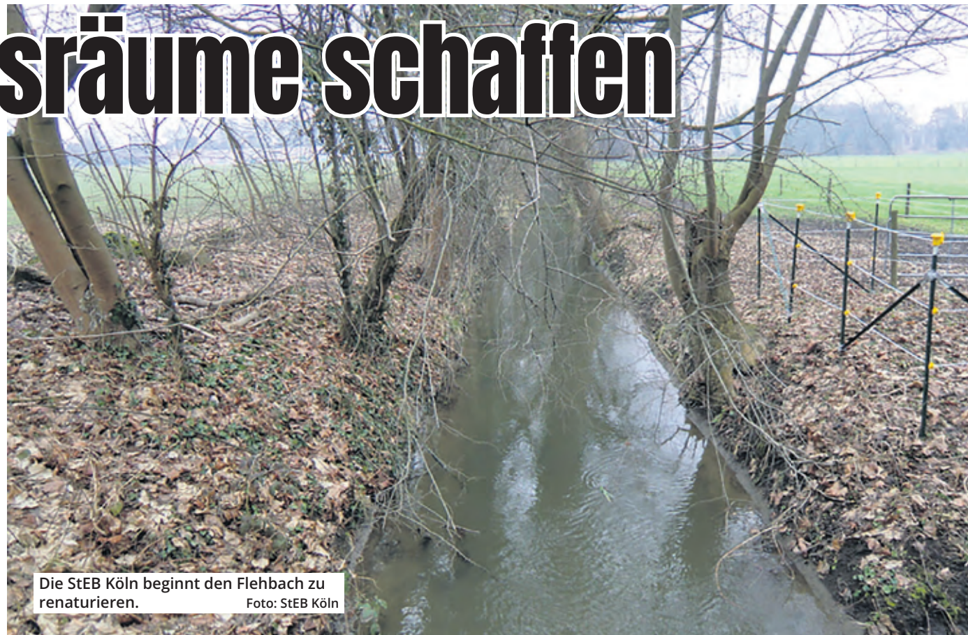
Die StEB Köln beginnt den Flehbach zu renaturieren.

Die ersten vorbereitenden Maßnahmen haben bereits begonnen und umfassen Gehölzrückschnitt, vereinzelt Baumfällungen und die Anlage einer Baustraße. Um die Betonschalen zu entfernen, wird das Wasser des Flehbachs vorübergehend umgeleitet. Vor dieser entscheidenden Phase findet eine sorgfältige Befischung und Umsiedlung der Gewässerlebewesen statt. So wird sichergestellt, dass sie keinen Schaden nehmen. „Sicherheit und Umwelt-