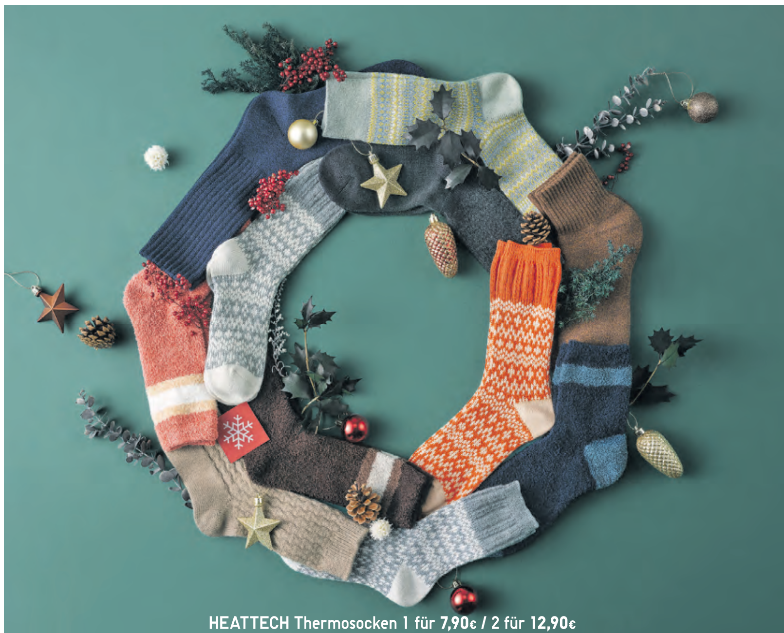
HEATTECH Thermosocken 1 für 7,90€ / 2 für 12,90€