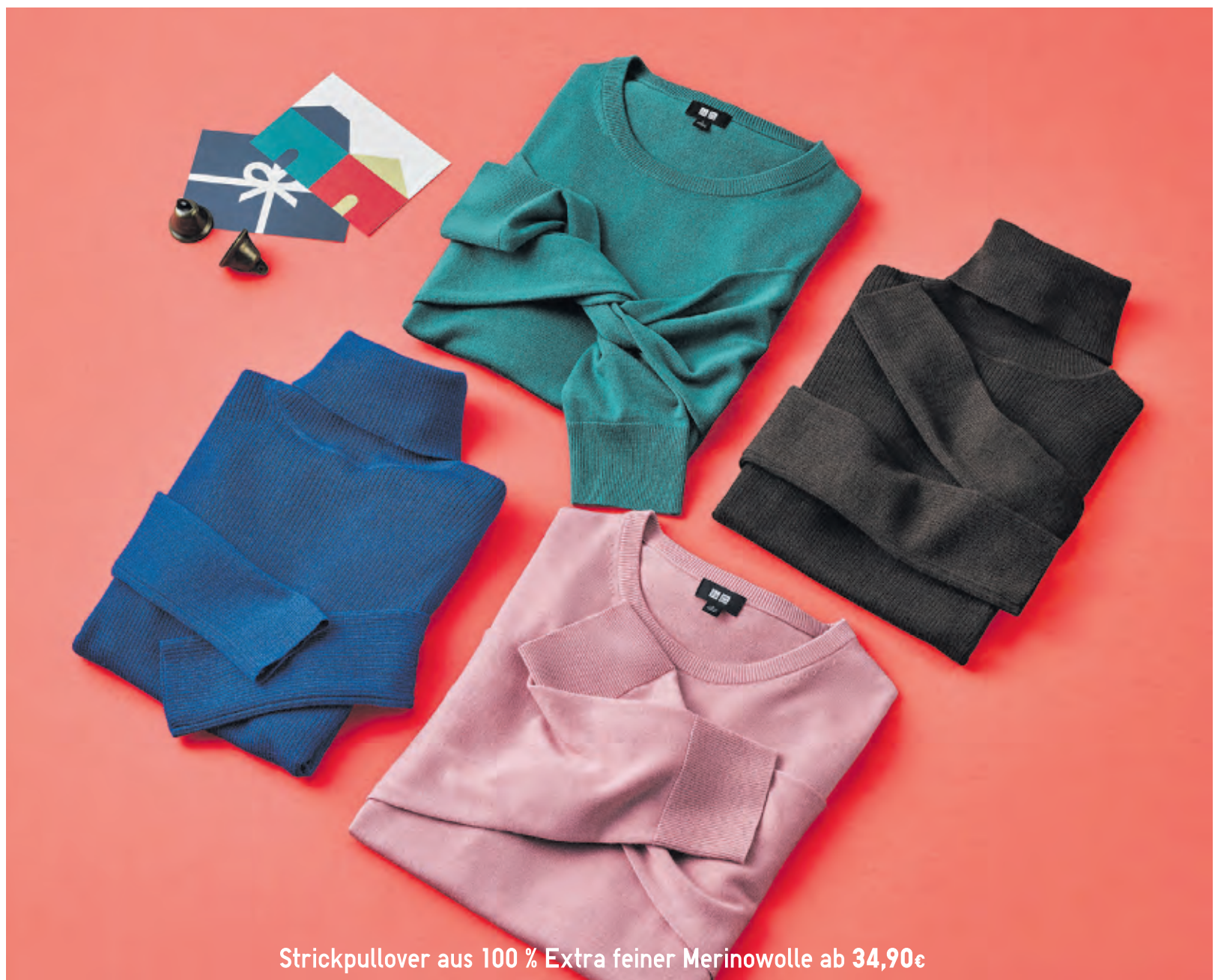
Strickpullover aus 100 % Extra feiner Merinowolle ab 34,90€