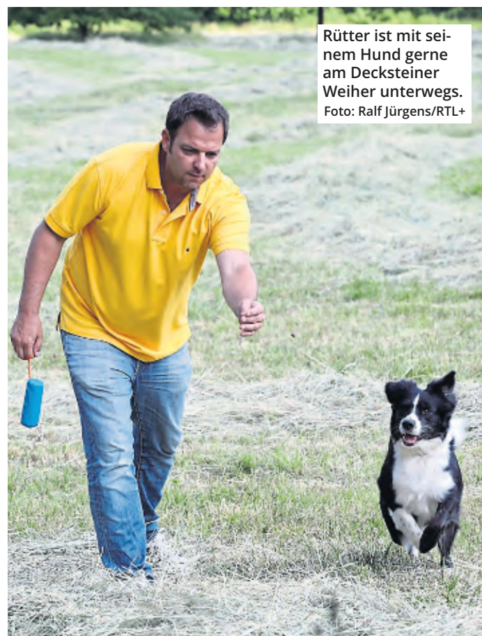
Rütter ist mit seinem Hund gerne am Decksteiner Weiher unterwegs.

„Der Hund von unseren Großeltern nervt uns total, deswegen möchten wir ihnen zwei Unterrichtsstunden bei dir schenken.“ Daraufhin bin ich dort hingefahren und die Leute waren 92 und 91 Jahre alt. Sie hatten einen winzigen Toy-Pudel, der ganz freundlich durchs Haus wuselte. Er war nicht aggressiv, hatte keine Angst. Und das Ehepaar hatte sich sehr auf meinen Besuch gefreut und extra einen Kuchen gebacken. Nach der Begrüßung haben wir uns aber erst mal hingesetzt und geplaudert, gar nicht über den Hund. Plötzlich hüpfte er auf den Stuhl, dann auf den Tisch und knabbert wie selbstverständlich am Kuchen. Daraufhin habe ich zunächst gar nicht reagiert, sondern das Ganze einfach laufen lassen. Zwei Minuten später hat die Frau dann zu mir gesagt: „Ich weiß ganz genau, warum Sie hier sind. Unsere Enkel nervt es, dass der Hund auf dem Tisch steht. Uns stört das aber überhaupt nicht, wir finden es eigentlich sogar ganz nett. Wir nehmen ihn ja auch nicht mit ins Restaurant.“