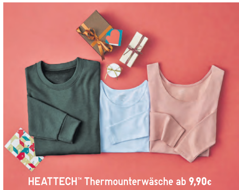
HEATTECH™ Thermounterwäsche ab 9,90€