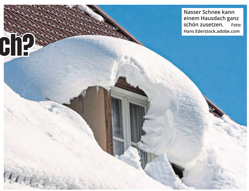
Nasser Schnee kann einem Hausdach ganz schön zusetzen.

Die zulässige Belastung für ihr Dach finden Besitzer in der Statik ihres Hauses. Der Nachweis zur Standsicherheit ist in der Regel Teil der Unterlagen, die Hausbesitzer von einem Bauunternehmen oder vom Verkäufer des Gebäudes erhalten. Wer diese Unterlagen nicht hat, kann sich an das örtliche Bauamt wenden, Mieter von Häusern an ihre Ver-