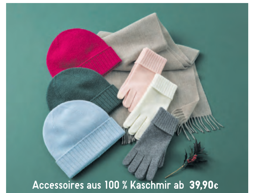
Accessoires aus 100 % Kaschmir ab 39,90€