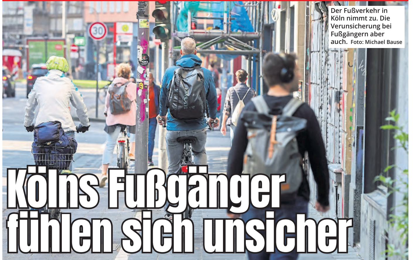
Der Fußverkehr in Köln nimmt zu. Die Verunsicherung bei Fußgängern aber auch.