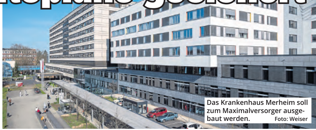
Das Krankenhaus Merheim soll zum Maximalversorger ausgebaut werden.

Der von den Kliniken der Stadt Köln für das Geschäftsjahr 2024 vorgelegte Wirtschaftsplan weist ein Planergebnis für 2024 von minus 114,24 Millionen Euro aus und bleibt damit auf dem Niveau der bisherigen Entwicklung. Diese ist geprägt von einer deutschlandweit angespannten Finanzsituation der Kranken-