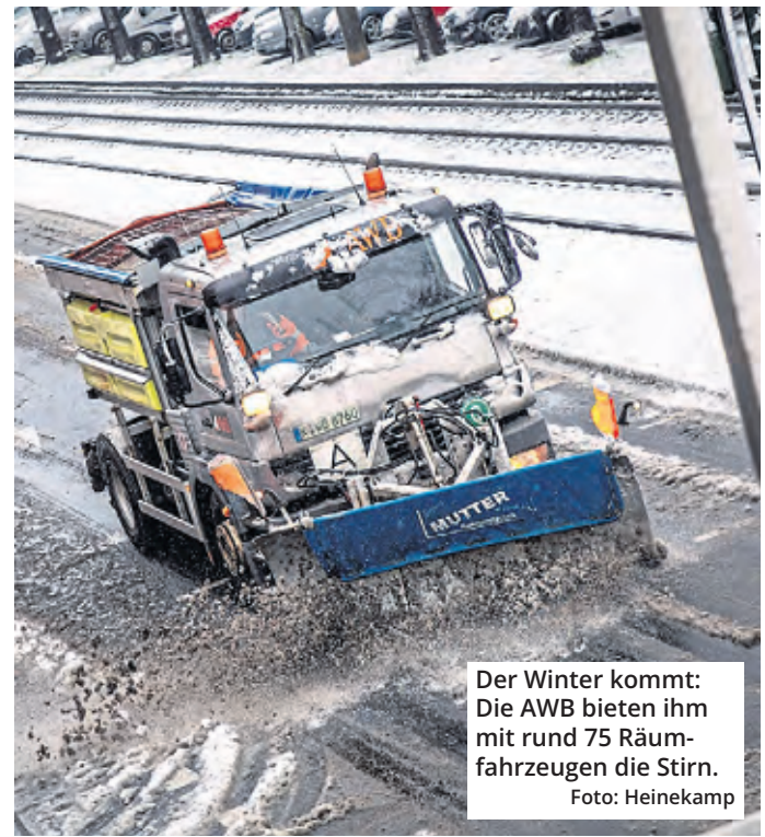
Der Winter kommt: Die AWB bieten ihm mit rund 75 Räumfahrzeugen die Stirn.

Alle weiteren Informationen zu den Services der AWB sind auf www.awbkoeln.de , der AWB App oder auf den Social Media-Kanälen des Betriebs zu finden.