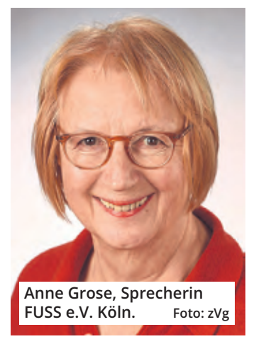
Anne Grose, Sprecherin FUSS e.V. Köln.

Im Vergleich gesehen ist Köln da noch ganz am Anfang. Einziger Trost: Es kann ja nur besser werden.