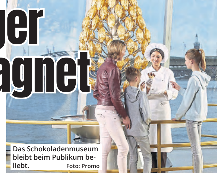
Das Schokoladenmuseum bleibt beim Publikum beliebt.

Das seien 16 Prozent mehr Besucher als 2019, dem letzten Vergleichsjahr vor der Corona-Krise, und sogar 26 Prozent mehr als 2022. Laut Museums-sprecher Klaus Schopen muss