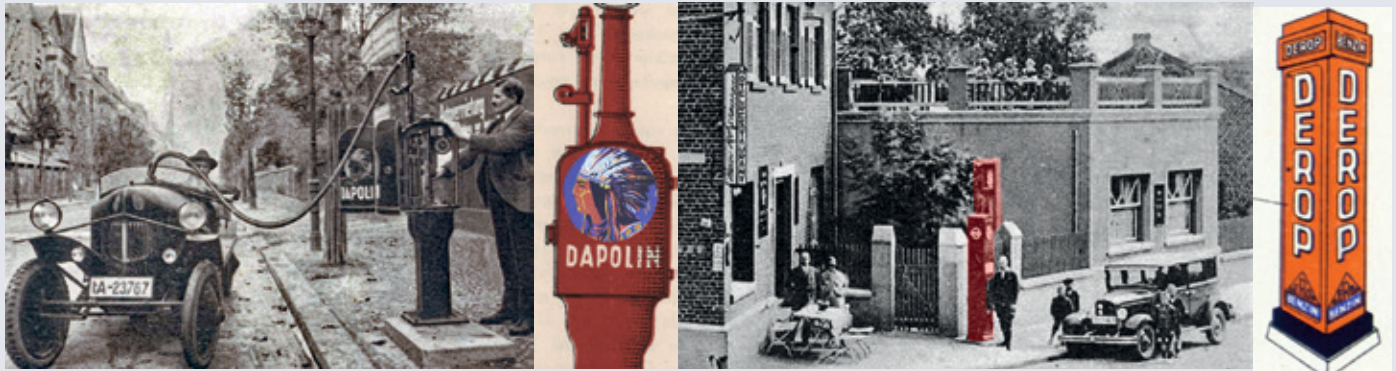
Von Hand bediente Dapolin-Zapfanlage (Werbefoto) und als Zapfsäule bei Hotel Kellenter Ecke Kückstr./Löffelstr.

Heutzutage ist alles anders durch E-Autos. Es gibt 73.683 Normalladepunkte und 16.622 Schnellladepunkte. Das meldet die Bundesnetzagentur 2023 zum Stand der Versorgung der E-Autos mit Antriebsenergie in Deutschland. Für Fahrzeuge mit Verbrennungsmotor gibt es aktuell laut ADAC etwas mehr als 14.000 Tankstellen, 1969 gab es sogar 46.684 Zapfstellen und vor 100 Jahren waren gerade mal 950 Tankstellen in Betrieb. Und in Baesweiler?