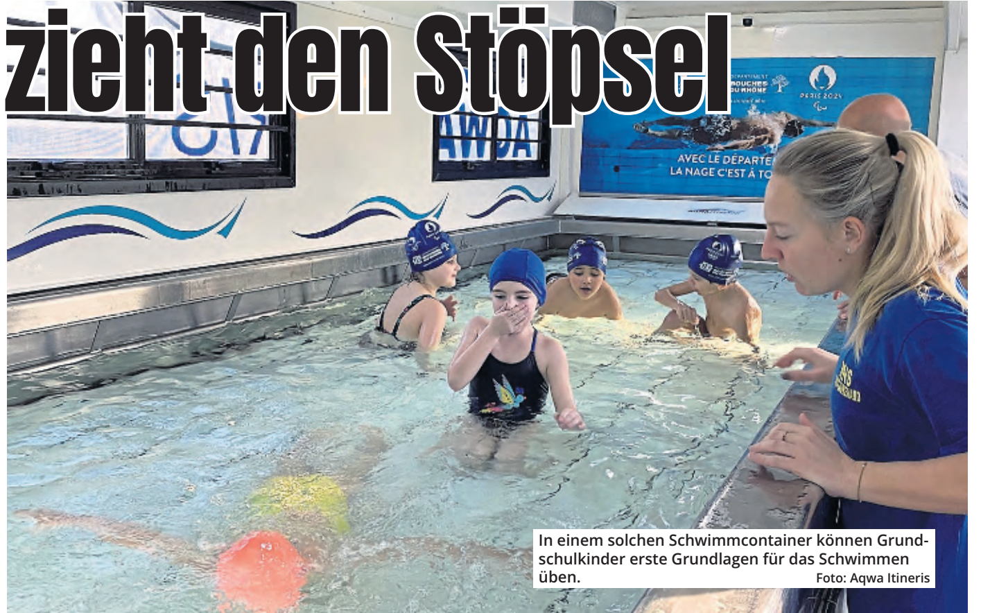
In einem solchen Schwimmcontainer können Grundschulkinder erste Grundlagen für das Schwimmen üben.

Der mobile Pool ist ein umgebauter Übersee-Container mit einem acht mal drei Meter großen Becken, das 1,30 Meter tief ist, sowie Umkleidekabine und Duschen. Ziel ist es