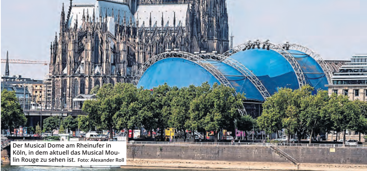
Der Musical Dome am Rheinufer in Köln, in dem aktuell das Musical Moulin Rouge zu sehen ist.

Nichts hat in Köln länger Bestand als ein Provisorium. Das gilt besonders für das blaue Zelt am Breslauer Platz. Ursprünglich sollte es nur ein paar Jahre bleiben, jetzt steht es seit 27 Jahren gleich neben dem Dom, im Herzen der City. Doch aktuelle Pläne der Stadt sehen sein „Aus“ vor: Der Musical Dome soll am 28. Februar 2026 abgebaut sein und die Fläche quasi besenrein an die Stadt übergeben werden.