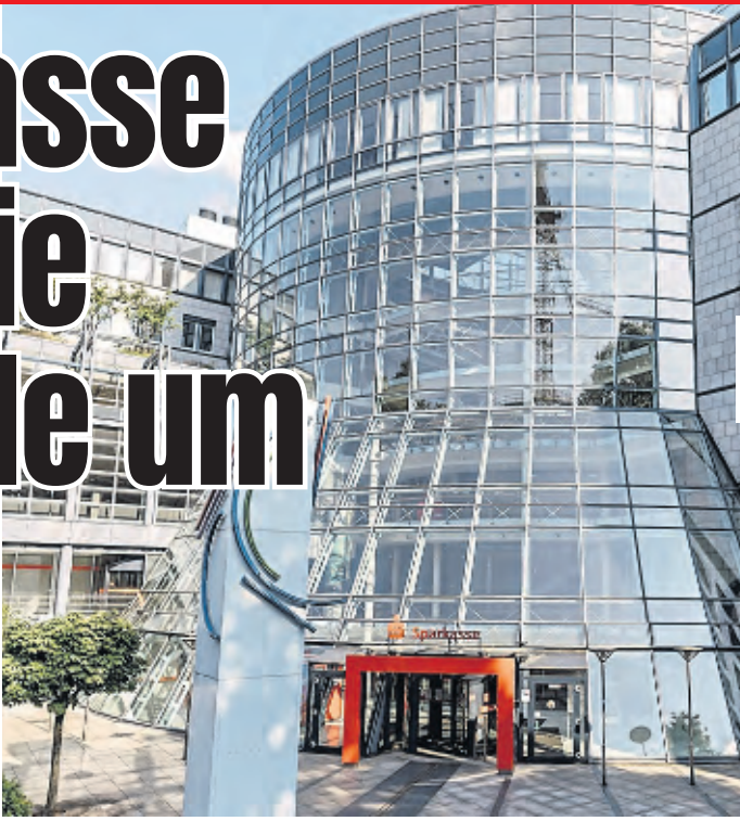
Die Zentrale der Sparkasse KölnBonn am Rudolfplatz.

Köln. 550 Mitarbeiter werden bis Jahresende aus der Zentrale der Sparkasse KölnBonn an der Hahnenstraße ausziehen und das Objekt für eine umfassende Modernisierung freimachen. Wichtige optische Veränderung: Die eigentliche Sparkassen-Filiale wird zukünftig nicht mehr im Untergeschoss, sondern im Erdgeschoss sein. Der prägnante, tiefer liegende Eingang wird also in Zukunft anders aussehen. Die Steinterrassen vor dem Gebäude – derzeit