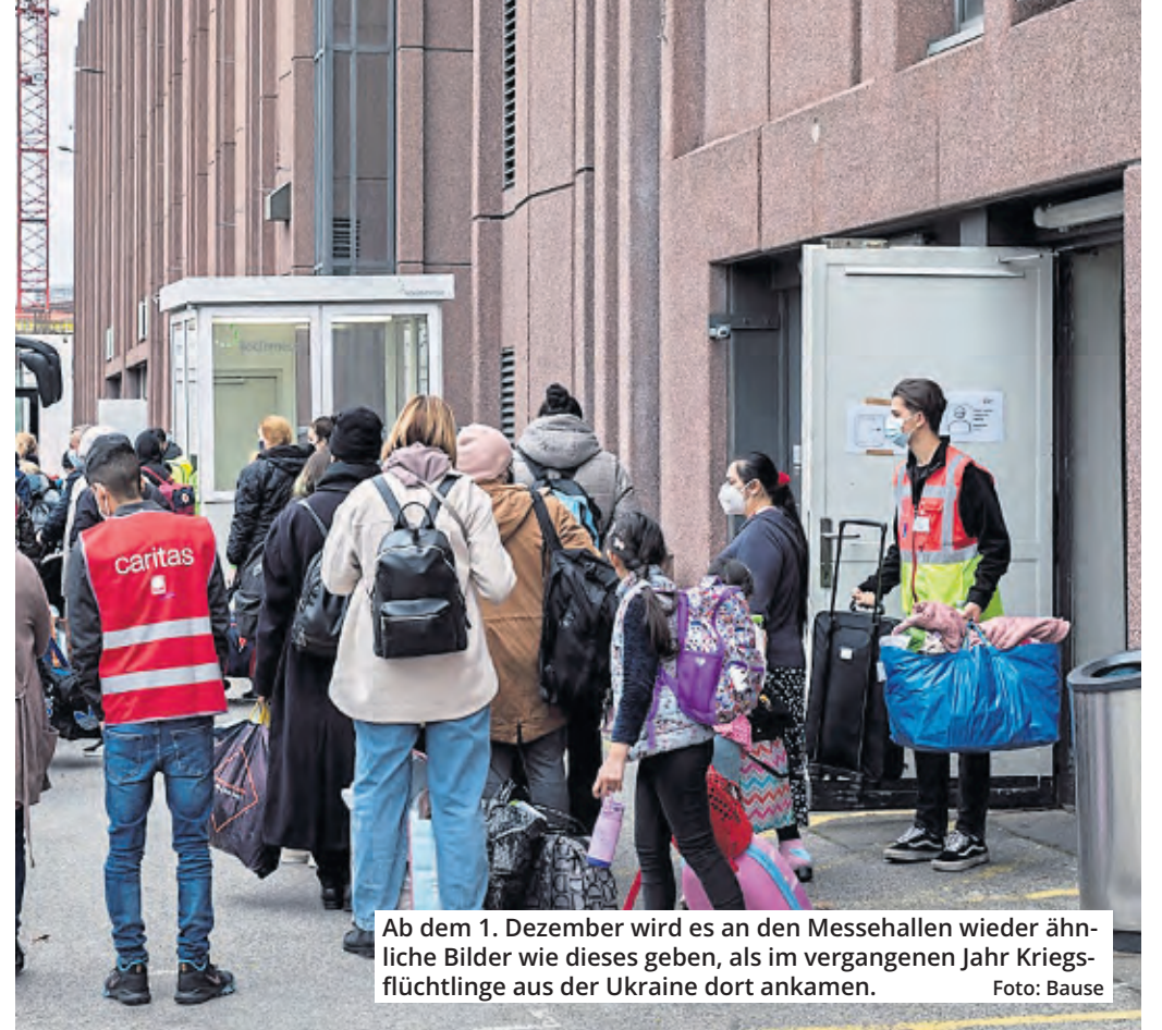
Ab dem 1. Dezember wird es an den Messehallen wieder ähnliche Bilder wie dieses geben, als im vergangenen Jahr Kriegsflüchtlinge aus der Ukraine dort ankamen.

Ende November sollen 800 Feldbetten geliefert werden, wenige Tage später geht die