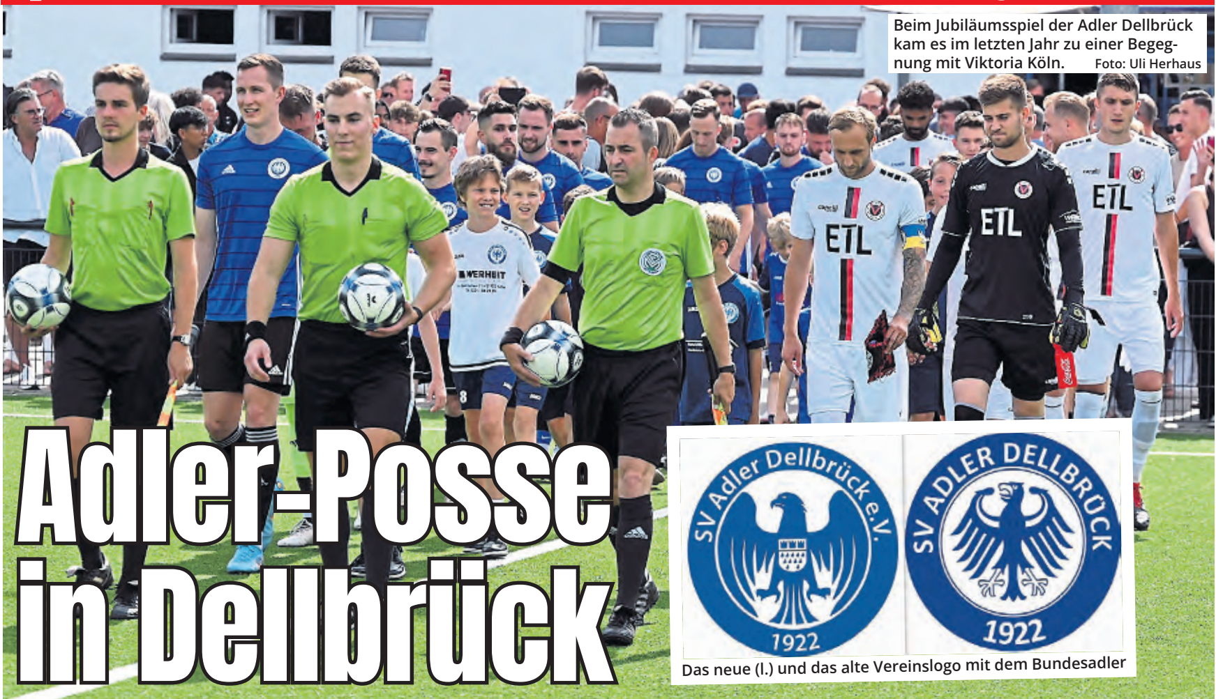
Beim Jubiläumsspiel der Adler Dellbrück kam es im letzten Jahr zu einer Begegnung mit Viktoria Köln.