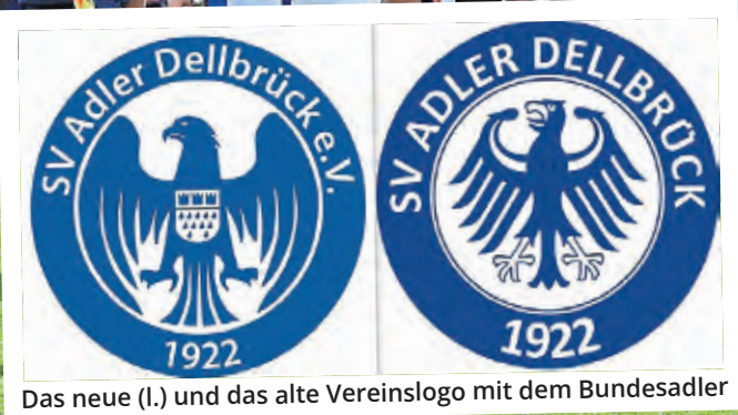
Das neue (l.) und das alte Vereinslogo mit dem Bundesadler

Das Wappentier ist ihr Stolz, aber jetzt hat der Kölner Traditionsverein Adler Dellbrück im 101. Jahr seines Bestehens genau deswegen die Behörden am Hals. Das Bundesverwaltungsamt hat den rechtsrheinischen Kickern untersagt, den Bundesadler weiter in ihrem Emblem zu nutzen. Bislang war offenbar nicht aufgefallen, dass der Club exakt das Hoheitszeichen der Bundesrepublik Deutschland verwendete. Jetzt gab es einen ersten Brief – mit Folgen.