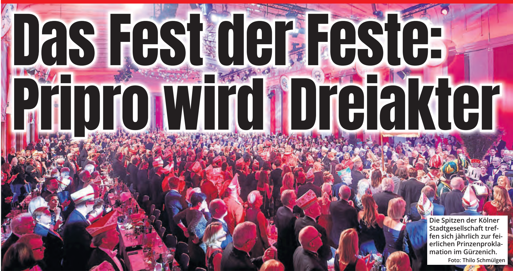
Die Spitzen der Kölner Stadtgesellschaft treffen sich jährlich zur feierlichen Prinzenproklamation im Gürzenich.

Frischer Wind für Kölns Jecken-Gala im Gürzenich