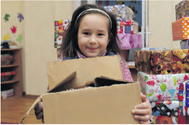
Viele Kinder freuen sich auf die Weihnachtspäckchen aus Deutschland.