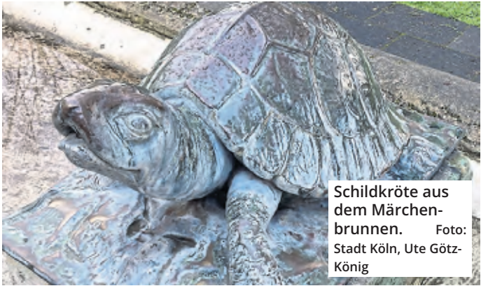
Schildkröte aus dem Märchenbrunnen.

Sie wurden unbemerkt aus dem Mülheimer Stadtgarten entfernt