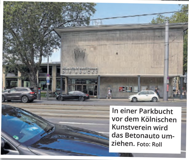
In einer Parkbucht vor dem Kölnischen Kunstverein wird das Betonauto umziehen.

bald an seinen neuen Standort umziehen – in eine reguläre Parkbucht vor dem Kölnischen Kunstverein in der Hahnenstraße. An einen Ort also, wo Vostell seine Skulptur ursprünglich immer sah.