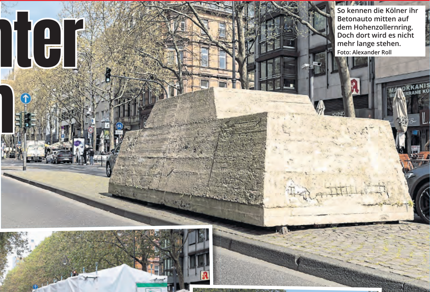
So kennen die Kölner ihr Betonauto mitten auf dem Hohenzollernring. Doch dort wird es nicht mehr lange stehen.