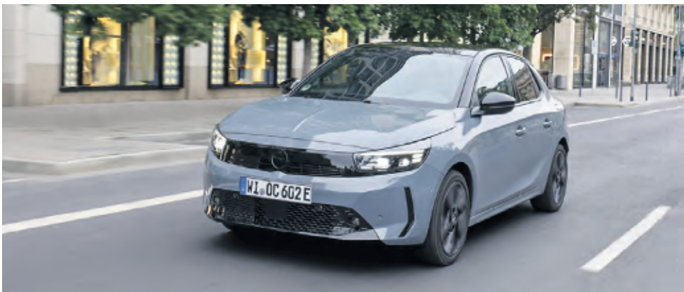
Neues Corsa Styling mit dem charakteristischen Markengesicht Opel Vizor

Corsa Electric bis zu 405 Kilometer Reichweite – Wahlweise in zwei Leistungsstufen bestellbar