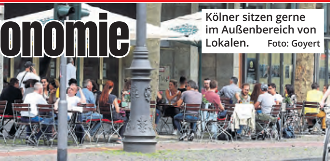
Kölner sitzen gerne im Außenbereich von Lokalen.

März 2024 soll ein dauerhaftes Konzept für die Außengastronomieflächen vorliegen. Ursprünglich wollte die Stadtverwaltung die Ausweitung früher beenden, worauf Wirte und die IG Gastro protestierten. (red)