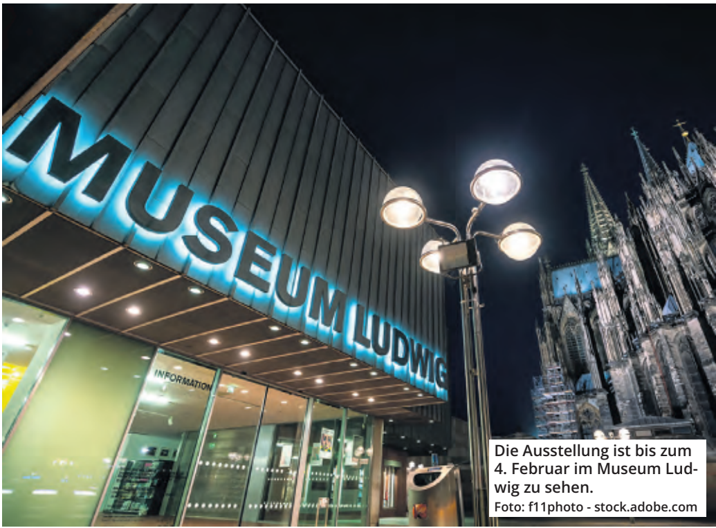
Die Ausstellung ist bis zum 4. Februar im Museum Ludwig zu sehen.

Pablo Picassos „Suite 156“ sorgt für jede Menge Diskussionsstoff – Szenarien im Bordell