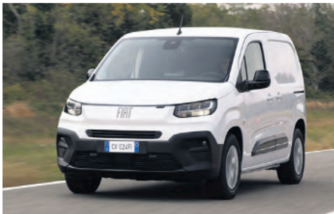
Der neue vollelektrische Fiat Doblo

Jumpy, Jumper; neuer Fiat Doblo, Scudo, Ducato; neuer Opel Combo, Vivaro, Movano und neuer Peugeot Partner, Expert, Boxer bis Ende 2023. Bis Ende 2023 sollen die neuen Transporter zu 100 Prozent vernetzt sein und ab 2026 sollen Over-the-Air Updates möglich sein. Derzeit ist Stellantis der unangefochtene Marktführer in Europa bei emissionsfreien Antrieben für Nutzfahrzeuge und bietet sowohl BEV- (Batterie-elektrische Fahrzeuge) als auch Brennstoffzellen-Optionen an. WMD