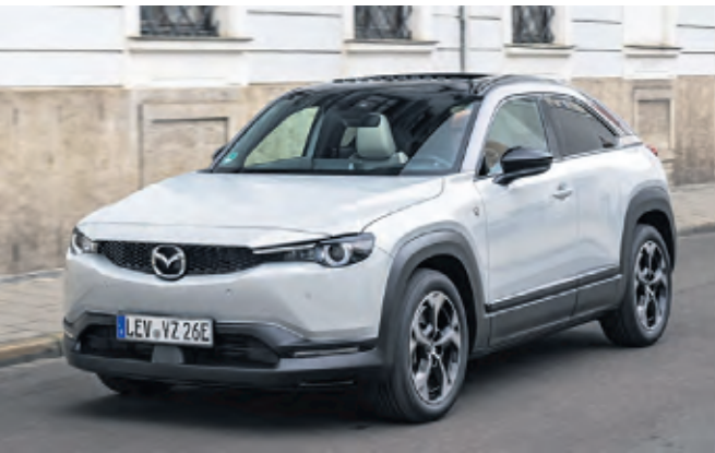
Mazda: Keine Gedanken über Reichweite oder Ladestopp

Und das Beste: Der Preis bleibt wie es war. Denn der Einstieg in den Corsa Electric liegt mit 34.650 Euro keinen Cent höher als zuvor. Wahlweise können die Kunden den neuen vollelektrischen Corsa auch ab 169 Euro monatlich – zur gleichen Rate wie eine Verbrenner-Variante – leasen. WMD