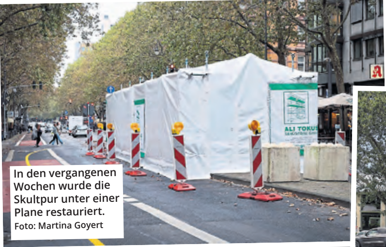
In den vergangenen Wochen wurde die Skulptur unter einer Plane restauriert.