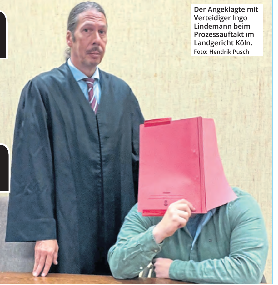
Der Angeklagte mit Verteidiger Ingo Lindemann beim Prozessauftakt im Landgericht Köln.

Das Verfahren um eine brutale Vergewaltigung im Mülheimer Stadtgarten wird seit Dienstag vor dem Kölner Landgericht verhandelt. Der Angeklagte soll in dem Park eine Frau mit einer Eisenstange bedroht, sie zum Oralverkehr gezwungen und ins Gesicht geschlagen haben. Der 23-Jährige soll bereits mehrfach wegen Gewaltdelikten in Erscheinung getreten sein, ihm droht eine hohe Strafe.