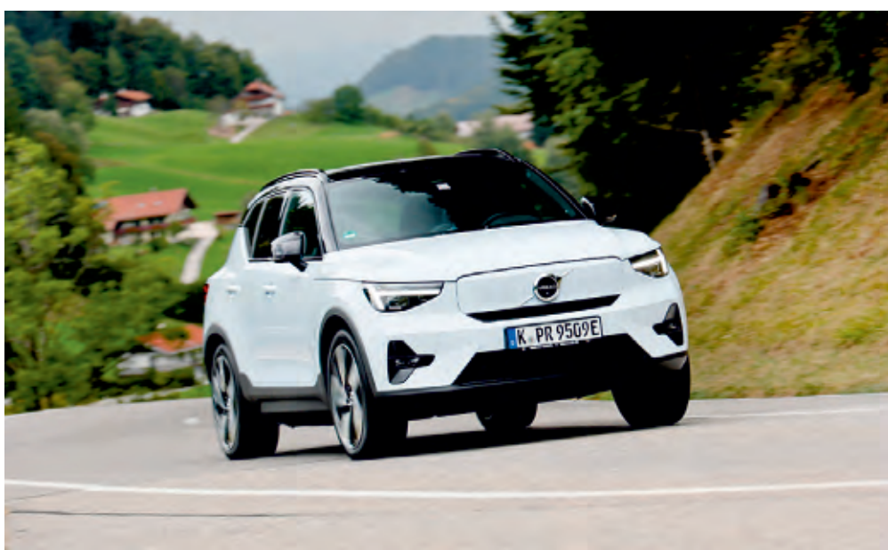
Den vollelektrischen Volvo XC40 Recharge gibt es jetzt auch mit Hinterradantrieb