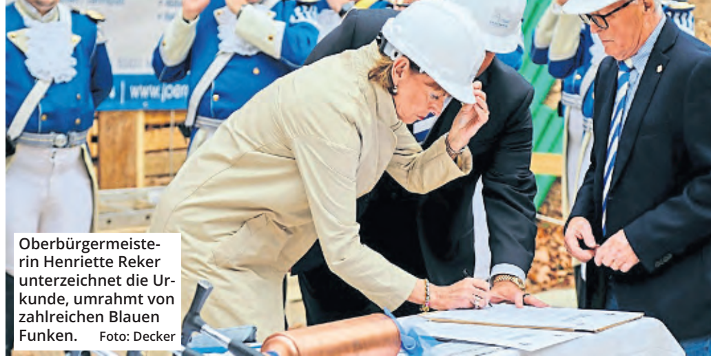
Oberbürgermeisterin Henriette Reker unterzeichnet die Urkunde, umrahmt von zahlreichen Blauen Funken.