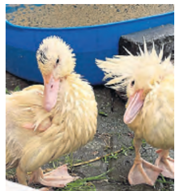
Aus einer Tüte befreit: Die Neuzugänge im Tierheim.

Entdeckt wurden die Tiere beim Gassigehen in Brück. Die Finder gaben gegenüber Tierheim-Mitarbeitenden an, dass ihr Hund die Tüte, die oben mit Klebeband zugeklebt gewesen sei, aufgespürt hätte. Als er daran schnüffelte, hätten sie die Tüte geöffnet. Die Küken seien zahm und in einem guten Zustand, erklärt Hemmerling. „Sie haben keine Angst vor Menschen.“ Die Tiere würden nun medizinisch durchgecheckt. (iri)