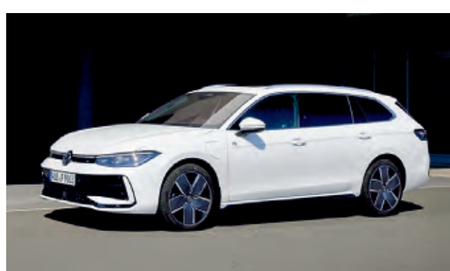
Geräumiges Reiseauto: Der neue VW Passat Variant

Kai Grünitz, Markenvorstand für Technische Entwicklung, erläutert: „Die neueste Evolutionsstufe des Modularen Querbaukastens (MQB evo) bildet die hochinnovative technische Basis der neunten Passat Generation. Durch die großen Skaleneffekte des MQB evo demokratisiert Volkswagen erneut zahlreiche Hightech-Entwicklungen und macht sie für hunderttausende