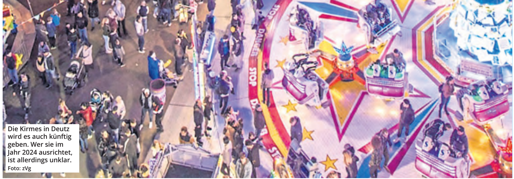
Die Kirmes in Deutz wird es auch künftig geben. Wer sie im Jahr 2024 ausrichtet, ist allerdings unklar.

Die Kirmes am Deutzer Rheinufer wird vom 28. Oktober bis zum 5. November womöglich zum letzten Mal von der Gesellschaft der Kölner Schausteller durchgeführt. Denn die Stadt vergibt die Fläche im nächsten Jahr wohl an die Konkurrenz.