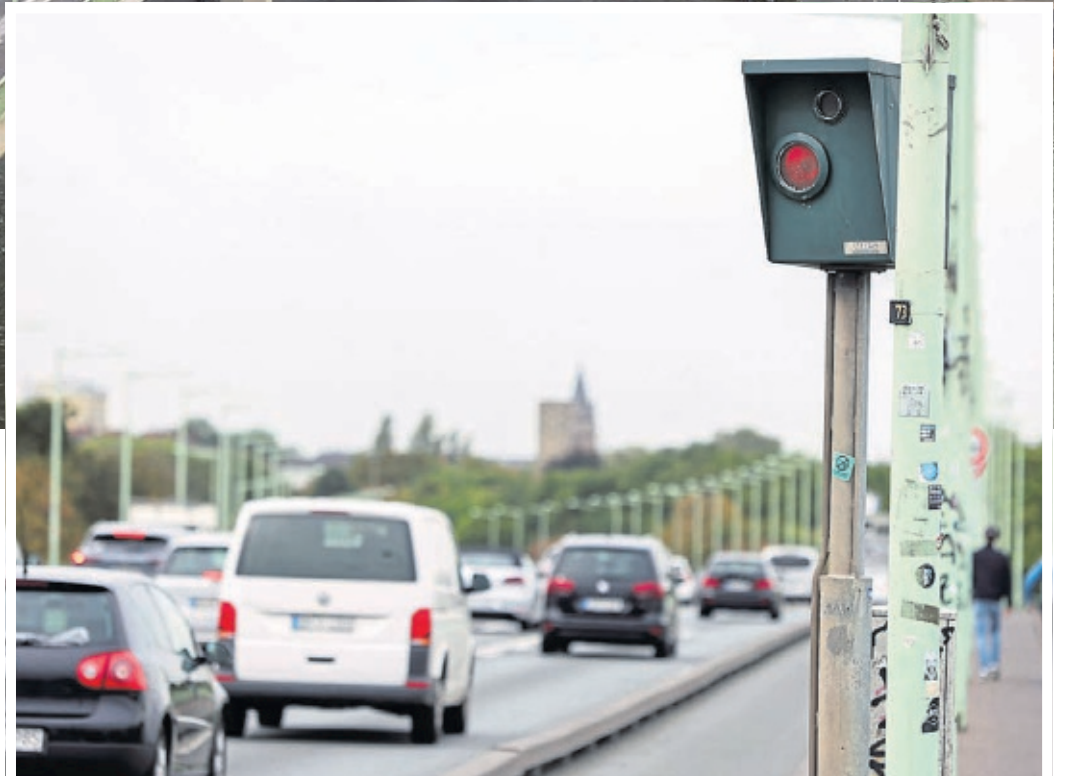
Einige Blitzer der Brücke sind bereits seit dem Jahr 2014 defekt.