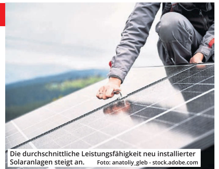
Die durchschnittliche Leistungsfähigkeit neu installierter Solaranlagen steigt an.

Viel wichtiger: Der Solarausbau in den untersuchten Metropolen wird insgesamt ambitioniert vorangetrieben. Im Durchschnitt liegt der Solar-Faktor bei 51,2 Prozent – rund die Hälfte des PV-Potenzials