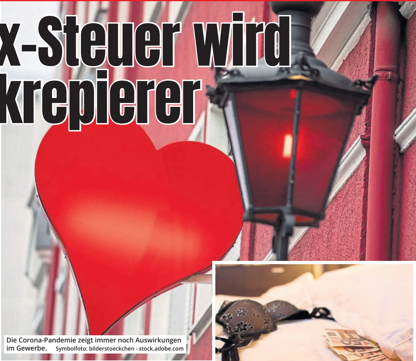
Die Corona-Pandemie zeigt immer noch Auswirkungen im Gewerbe.

dem EXPRESS. Wenn die Stadt Köln Prostitution tatsächlich eindämmen wolle, sollten nach Meinung des Steuerzahlerbundes „andere rechtliche