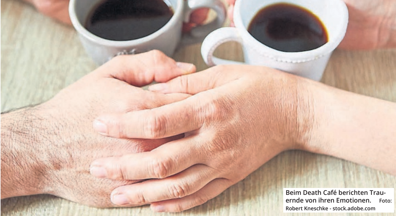
Beim Death Café berichten Trauernde von ihren Emotionen.

Die Themen Trauer, Tod und Sterben beschäftigen in Köln tagtäglich zahlreiche Menschen. Viele von ihnen haben aber nicht oder nur unzureichend die Möglichkeit über ihre Gefühlslage zu berichten. Andere trauen sich womöglich nicht, gewisse Themen gegenüber ihren Verwandten oder Bekannten nochmals anzusprechen. Um Betroffenen eine Möglichkeit zu geben, sich über diese Themen in einer angenehmen Atmosphäre mit Fachleuten und Gleichgesinnten auszutauschen, wird am 15. Oktober von 17 bis 18.30 Uhr in Köln erstmals ein sogenanntes Death Café durchgeführt.