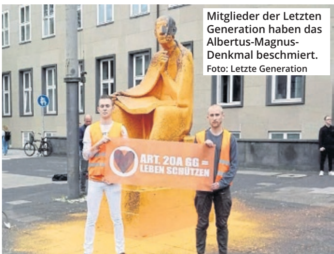
Mitglieder der Letzten Generation haben das Albertus-Magnus-Denkmal beschmiert.

Seitens des Flughafens heißt es, dass man in der Testphase des Wasserstoffbusses Erkenntnisse für einen optimalen nachhaltigen Mobilitätsmix der Zukunft gewinnen möchte. Die Infrastruktur für E- und Wasserstoff-Fahrzeuge werde im Zuge des Mobilitätskonzepts ausgebaut und der E-Fuhrpark laufend vergrößert. Der Aufbau und Betrieb einer zweiten Wasserstofftankstelle sei geplant.