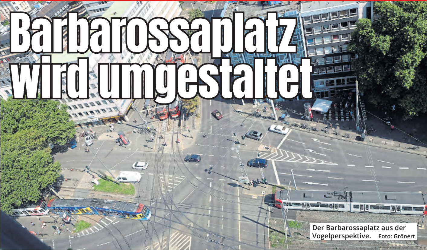
Der Barbarossaplatz aus der Vogelperspektive.

Eigentlich sollte in der nächsten Sitzung des Verkehrsausschusses der Stadt über den Sachstand zur Umgestaltung des Barbarossaplatzes informiert werden. Doch nun wurde dieser Programmpunkt von der Agenda gestrichen.