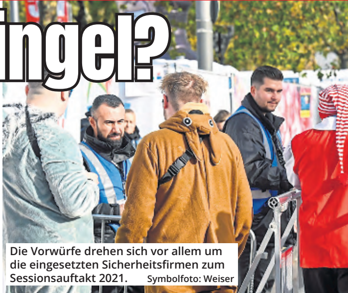
Die Vorwürfe drehen sich vor allem um die eingesetzten Sicherheitsfirmen zum Sessionsauftakt 2021.

für öffentliche Ordnung wurde in Folge des Prüfberichtes von ihren bisherigen Aufgaben entbunden und befindet sich im Urlaub. Disziplinarische Maßnahmen gegen Mitarbeitern werden – auch zu deren Eigenschutz – aktuell geprüft und eingeleitet, heißt es in einer Erklärung der Stadt. Damit wurde die fachliche Bearbeitung der Großveranstaltung zum Sessionsauftakt 2023 so-